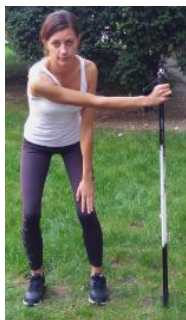
Slika 21. BOČNO POSTAVLJENI ŠTAPOVI

OPIS: Stopala postaviti paralelno u širini ramena. Učiniti blagi počinjanje te trupom napraviti blagi pretklon. Štapove postaviti na suprotnu stranu od ruke kojom ih držimo.