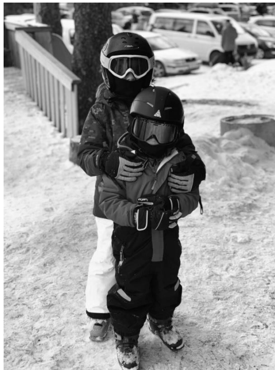
Slika 7. Dijete u školi alpskoga skijanja stvara nova prijateljstva.

Djeci se kroz učenje alpskoga skijanja omogućava i stjecanje novih vrsta informacija te znanja i to najčešće kroz dječje igre. Dijete se tijekom predškolske dobi puno kreće te na taj način ono upoznaje okolinu i prostor. Međutim, izrazi lijevo i desno djetetu postaju jasni tek pred kraj predškolske dobi i to je nešto čega učitelji skijanja uvijek moraju biti svjesni. Najbolji učitelj i kineziolog bit će primjer svoj djeci koja će se tijekom ovoga razdoblja poistovjetiti s njim. On će ih hrabriti, poticati, tješiti i posljedično utjecati na njihov pozitivni emocionalni razvoj (Neljak, 2009; Jurković i Jurković, 2003).