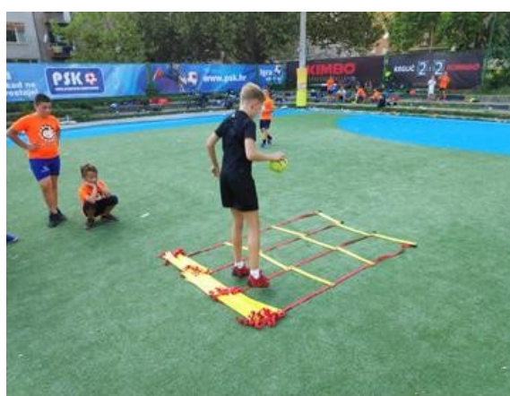
Slika 3. i 4. izvođenje finte veslanje na podnim ljestvama „kidgrid“