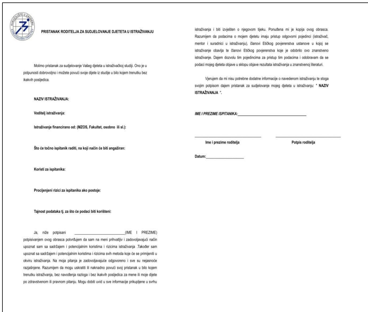
Slika 6. Obrazac suglasnosti roditelja za sudjelovanje djeteta u istraživanju