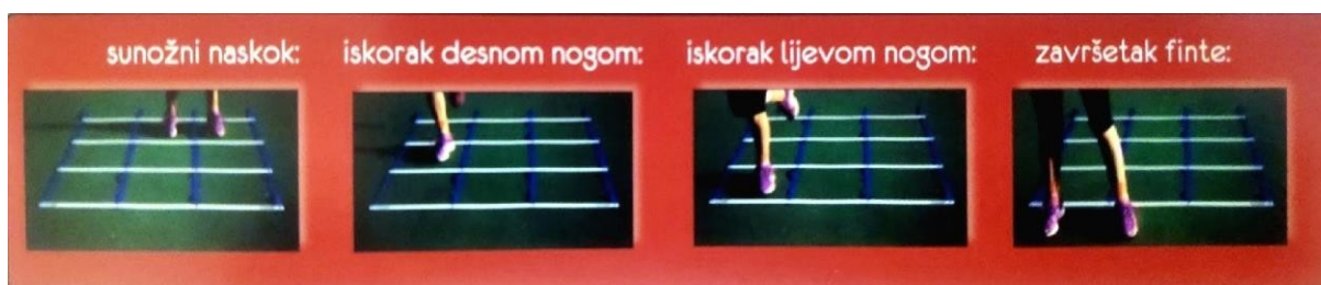
Slika 2. izvođenje osnovne finte na podnim ljestvama „kidgrid“. (Papić, 2014, str. 85)

Jednostruka finta u desno s prolazom u lijevo „presvlačenjem“,