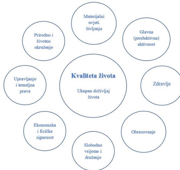
Slika 2. Koncept kvalitete života prema Europskoj komisiji