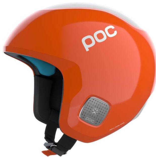
Slika 9. Zaštitna kaciga prve kategorije

Skijaška kaciga je obavezna zaštitna oprema tijekom svih disciplina alpskog skijanja, pa tako i veleslaloma. Prema uputama FIS-a, za veleslalom utrke natjecatelji smiju koristiti samo kacige prve kategorije sigurnosnih standarda. Kacige prve kategorije testirane su pri ispitnoj brzini od 6.8 m/s. Takva kaciga mora imati dio koji štiti uši, spojen u jednu cjelinu s ostatkom kacige. To je ujedno i njena glavna vizualna i zaštitna karakteristika. Zabranjena je bilo kakva modifikacija ili promjena na kacigi koja bi doprinijela poboljšanju njezine aerodinamičnosti. Kaciga prve kategorije osim u veleslalomu koristi se i u superveleslalomu, te u spustu. Za natjecanja u slalomu može se koristiti kaciga koja ima zaštitu ušiju odvojenu od ostatka.