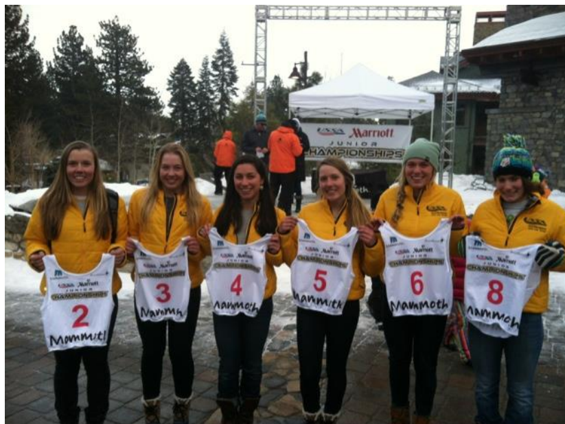
Slika 3. Izvlačenje startnih brojeva prije veleslalom utrke

Postavljača staze nominiraju nacionalni savezi uz dokaz o kompetenciji za postavljanje staza za određenu razinu natjecanja. Trenerska radna skupina odobrava postavljača, a žiri pojedinog natjecanja nadgleda cijeli proces. Postavljači prve i druge veleslalomske vožnje istog natjecanja moraju biti različiti. Veleslalom staza prve vožnje u pravilu mora biti postavljena dan prije samog natjecanja, a staza druge vožnje odmah po završetku prve, kako bi svi natjecatelji imali prilike proći i upoznati se sa stazom na vrijeme.