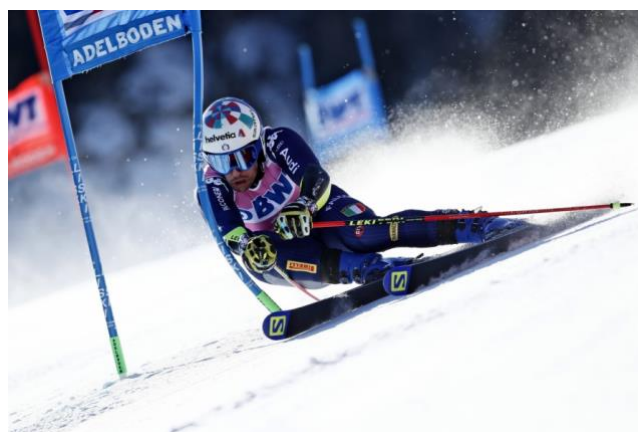
Slika 1: Skijaš veleslaloma tijekom zavoja u natjecateljskim uvjetima

Ekvivalent skijaškoj disciplini veleslalom u rekreativnom skijanju je skijaška tehnika carving , koja se također, u hrvatskoj školi alpskog skijanja, naziva i dinamički paralelni zavoj (Modrić (ur.), 2017)