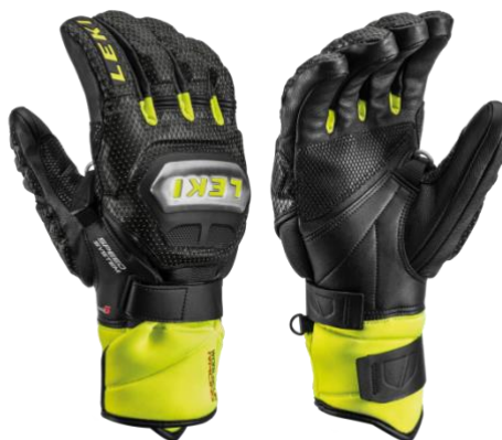
Slika 11. Natjecateljske skijaške rukavice

Skijaške rukavice imaju višestruku ulogu. Glavna uloga im je zaštita od hladnih vremenskih prilika i vanjskih sila. Rukavice koje se koriste na natjecanjima smiju imati plastičnu zaštitu za šake na vanjskim dijelovima, kako bi štatile ruke od mogućeg udarca u skijaška vrata. Rukavice ne smiju biti preoblikovane ni na koji način koji bi doprinio poboljšanju aerodinamičnosti tijekom natjecanja.