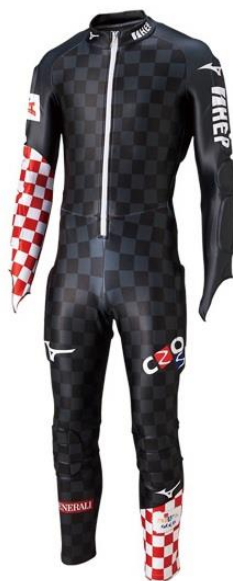
Slika 7: Natjecateljski kombinezon Hrvatske skijaške reprezentacije

Za lakšu kontrolu takvih zahtjeva, na donjoj strani lijeve noge proizvođač mora staviti standardiziranu oznaku u kojoj potvrđuje da je odijelo napravljeno po svim propisima FIS-a, te da nije plastificirano, niti tretirano kemijskim sredstvima.