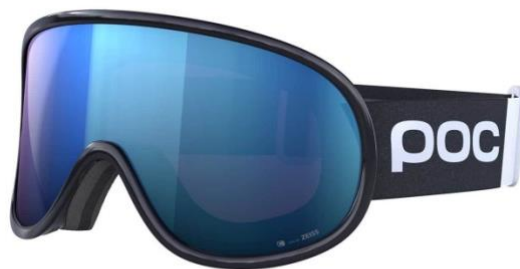
Slika 10. Skijaške naočale

Skijaške naočale služe za poboljšanje vidljivosti na skijaškoj stazi. Ovisno o vremenskim prilikama na stazi natjecatelj izabire naočale koja će mu pružiti najbolju moguću vidljivost. Skijaške naočale također štite oči od štetnih zraka sunca koje pri velikim visinama mogu biti vrlo štetne.