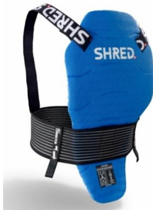
Slika 12. Zaštita za kralježnicu

U ostalu zaštitnu opremu za veleslalom natjecanja spadaju štitnici koji se mogu koristiti na vlastitu odgovornost. Jedan od najčešće korištenih je zaštita za kralježnicu. Takva zaštita štiti tijelo od vanjskih sila. Obavezno se nosi ispod natjecateljskog kombinezona. Samim time osigurava se da je pripojena uz tijelo, te ne doprinosi aerodinamičnim poboljšanjima. Prema FIS pravilima takva zaštita ne smije biti deblja od 45 mm, te se mora nalaziti ispod sedmog cervikalnog kralješka.