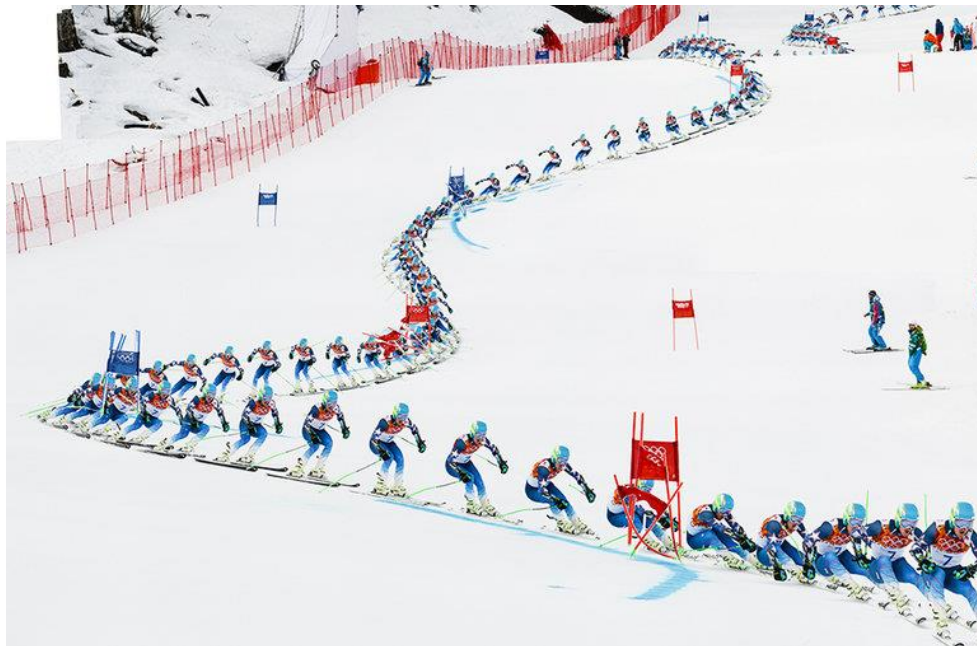
Slika 14. Ted Ligety u svim fazama veleslalom zavoja

Ovakve faze mogu se također primijeniti i kod veleslalom zavoja. Najveća razlika između slalom i veleslalom zavoja nastaje u puno dužem veleslalom zavoju. Samim time u izvedbi veleslalom zavoja postižu se veće brzine, ali i veće sile koje direktno utječu na uspješnost izvedbe zavoja.