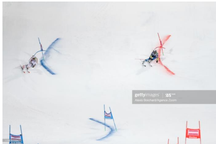
Slika 17. Skijaši paralelnog veleslaloma na ulasku u završnu fazu zavoja

Centrifugalna sila, zbog rasterećenja, znatno je manja nego u središnjem dijelu zavoja. Završna faza zavoja završava kada se dosegne maksimalno rasterećenje, te započne s prebacivanjem težišta na vanjsku skiju budućeg zavoja.