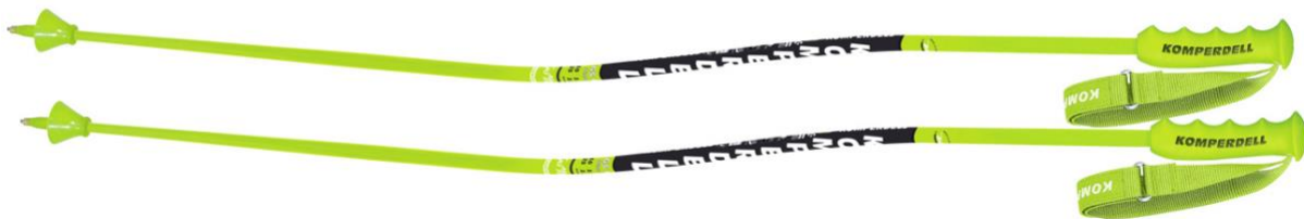
Slika 8. Skijaški štapovi za veleslalom natjecanje

U veleslalom natjecanju, natjecatelji na početku koriste štapove za odguravanje i ubrzanje, a zatim u nastavku samo za ravnotežu i ritam. Iz tog razloga štapovi nisu potpuno ravni, već imaju blago zavijen središnji dio kako bi usred utrke mogli natjecatelju pružiti što aerodinamičniju poziciju. Zbog prirode prolaska kroz veleslalom vrata, skijaški štapovi nemaju potrebu za zaštitom za šake. No zaštite se ipak koriste na nekim drugim dijelovima tijela.