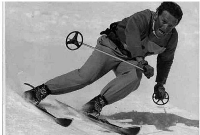
Slika 2. Helmuth Lantschner

Prvi zabilježeni veleslalom vozio se 1935. godine u Italiji. Zbog nepovoljnih uvjeta Giani Albertini, tadašnji povjerenik Talijanskog skijaškog saveza (FISI) umjesto predviđenog spusta napravio je improviziranu stazu gdje su skijaši morali pratiti određenu putanju. Zbog male visinske razlike od tek 300 m povećao je broj zavoja, ali i odlučio kako će se staza voziti dva puta, kako bi vrijeme spuštanja iznosilo otprilike kao i za predviđeni spust. Helmuth Lantschner je pobjednik prve utrke veleslaloma s prednošću od čak 6 sekundi.