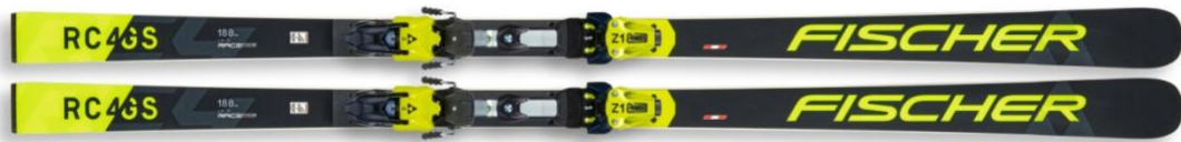
Slika 5: Natjecateljska veleslalom skija

U današnje vrijeme gotovo svaki proizvođač skija u svojoj ponudi nudi barem jedan model veleslalomskih skija. Svake godine proizvođači pokušavaju izbaciti novi, nadograđeni model skija koji će pomoći najboljim natjecateljima u pokušaju osvajanja velikih natjecanja. Uz pokušaj poboljšanja sposobnosti skija, proizvođači također mijenjaju i dizajn skija. Dizajn skija je najviše marketinškog karaktera. Mnogi rekreativni skijaši upravo na temelju dizajna odabiru svoje buduće skije. Natjecateljske i rekreativne skije uvijek se izrađuju istim dizajnom kako bi omogućili bolju prodaju skija namijenjenih skijašima rekreativne razine. Međutim, osim dizajna natjecateljske i rekreativne skije imaju bitno različitu strukturu u jezgri.