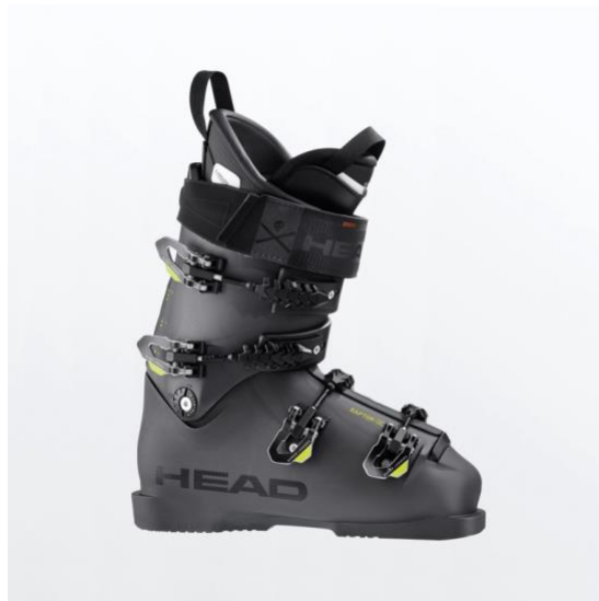
Slika 6: Skijaška cipela visoke čvrstoće pogodna za veleslalom natjecanja

Skijaška cipela je posebno izrađena za korištenje za vrijeme skijanja. Za disciplinu veleslalom natjecatelji koriste posebno izrađenu skijašku cipelu s četiri kopče. Osim vrlo bitne upravljačke funkcije, skijaška cipela ima i zaštitnu funkciju. Sastoji se od dva dijela. Prvi dio je vanjska čvrsta plastika koja dolazi u jednom dijelu. Kako bi se taj dio mogao prilagoditi nozi natjecatelja koriste se kopče. Dvije kopče nalaze se na prednjoj strani u visini potkoljenice, a preostale dvije iznad dorzalnog dijela stopala. S kopčama reguliramo čvrstoću prianjanja skijaške cipele za stopalo i potkoljenicu. Iznad kopči, još se nalazi i remen, koji služi za kontrolu nagiba potkoljenice. Između dijela kojim je obavijeno stopalo i dijela kojim je obavijena natkoljenica nalazi se kotač za namještanje nagiba. S tim kotačem možemo kontrolirati kut nagiba skijaške cipele. Na taj način možemo utjecati na pomicanje početnog težišta unutar skijaške cipele.