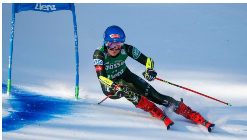
Slika 13. Natjecateljica veleslaloma s vidljivom žutom zaštitom za podlaktice

Zaštita za podlaktice i laktove, još je jedan dio opreme kojeg koriste gotovo svi natjecatelji u disciplini veleslalom. Naime, pri prolazu uz štapove vrata često se dogodi da natjecatelj tijelom ide vrlo blizu, ili čak direktno u vrata. U tim situacijama koristi svoju podlakticu bliže ruke kako bi odgurnuo vrata i odmaknuo ih od mogućeg sudara s ramenom što bi potencijalno znatno narušilo skijaševu ravnotežu. Zaštitu za podlaktice natjecatelj smije postaviti iznad kombinezona kako bi direktno s njima dolazio u kontakt s vratima.