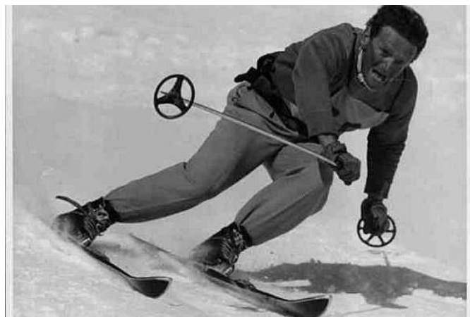
Slika 2. Helmuth Lantschner

Prvi zabilježeni veleslalom vozio se 1935. godine u Italiji. Zbog nepovoljnih uvjeta Giani Albertini, tadašnji povjerenik Talijanskog skijaškog saveza (FISI) umjesto predviđenog spusta napravio je improviziranu stazu gdje su skijaši morali pratiti određenu putanju. Zbog male visinske razlike od tek 300 m povećao je broj zavoja, ali i odlučio kako će se staza voziti dva puta, kako bi vrijeme spuštanja iznosilo otprilike kao i za predviđeni spust. Helmuth Lantschner je pobjednik prve utrke veleslaloma s prednošću od čak 6 sekundi.