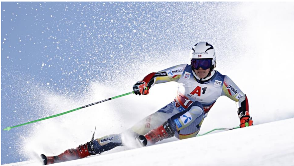
Slika 15. Prikaz natjecatelja iz čeone ravnine

Za takav način skijanja potrebna je visoka razina skijaške tehnike. Naime, u trenutku kružnih gibanja stav mora biti viši te skije moraju biti rasterećenije. U trenutku prelaska na rubnike skija, natjecatelj snažnim potiskom u snježnu podlogu i lateralnim kretnjama dovodi skije u položaj rubljenja i smjer idealne putanje za prolazak kroz veleslalom stazu.