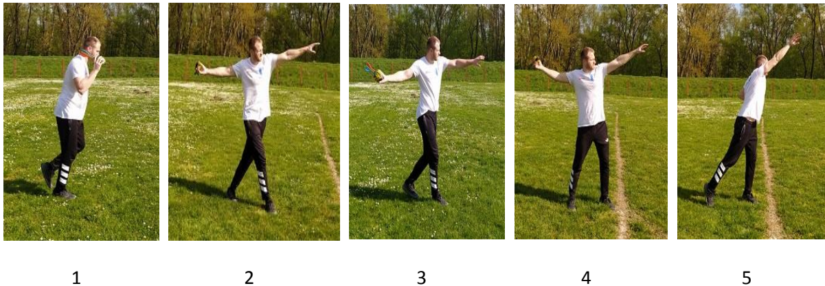
Prikaz 4. Povezivanje ravnog dijela zaleta s križnim koracima

Prikaz 4. pokazuje treću metodska vježbu povezivanje ravnog dijela zaleta (4 koraka) u bacanje križnim koracima (4 križna koraka). Vježba se izvodila iz kretanja s držanjem vortexa dominantnom rukom fleksiranom iznad ramena. U drugoj fazi izvodi se opružanje dominantne ruke iza tijela a nedominantne ispred tijela, te prelazak u križne korake. Nakon križnih koraka slijedi dolazak u centralnu poziciju te izbačaj vortexa.