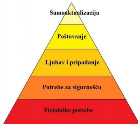
Slika 1. Maslowljeva hijerarhija potreba (Bosnar i Balent, 2009).

„Sportska rekreacija dio je širokog područja rekreacije, pri čemu se tjelesnim aktiviranjem zadovoljavaju opće ljudske potrebe. Sudionici sportske rekreacije su osobe svih životnih dobi različitih sposobnosti, mogućnosti i potreba“ (Andrijašević, 2010:29). Provedba bilo kojeg rekreacijskog sadržaja uvijek ima za cilj povećanje stupnja zdravlja i poboljšanje kvalitete življenja sudionika programa. Sportska rekreacija kod većine osoba izaziva osjećaj slobode i odmora duha i tijela. Svrha sportske rekreacije je rasterećenje čovječjeg uma od stresa i briga s kojima se tijekom radnog dana susreće. Sama potreba za korištenjem slobodnog vremena na način koji osoba želi, razvija stanje mira kod čovjeka. Većina ljudi se okreće sportskoj rekreaciji u slobodno vrijeme, no neki se posvećuju i primjerice ne kineziološkim oblicima rekreacije, slikanju, pisanju, čitanju i slično. Može se reći da je korištenje slobodnog vremena na sportsku rekreaciju veoma dobar „ispušni ventil“ za pojedinca. Rekreacija kod čovjeka potiče niz pozitivnih emocija te samim time pozitivno djeluje na zdravlje pojedinca. Dakle, svaki oblik sportske rekreacije ili samog kretanja ima pozitivan učinak na organizam i mentalno zdravlje osoba svih dobni skupina (Andrijašević, 2010). To nam dokazuje i Maslowljeva hijerarhija potreba prikazana na slici 1.