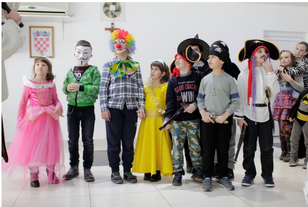
Slika 5. Izbor najbolje maske (Preuzeto s https://www.tz-suhopolje.hr/ieNews/media/711-MG_0479.jpg )

Maskenbal je igra u kojoj su svi sudionici maskirani. Njihova aktivnost u maškaranom plesu također je jedan od kriterija koji se ubraja u sveukupnu ocjenu žirija. Najčešće se provodi u vrijeme maškara, u popodnevним satima. Natjecanje je bazirano na plesu, pjevanju te najbolje osmišljenoj maski. Pobjednik je onaj kojega žiri smatra najaktivnijim i najkreativnijim te za pobjedu slijedi bogati niz nagrada (Andrijašević i sur., 1999).