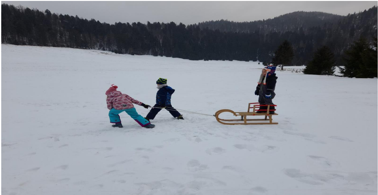
Slika 3. Utrka saonicama

Utrka saonicama je igra u kojoj sudjeluju ekipe po tri igrača. Pomagala koja su potrebna za ovu igru su: saonice i zastavice različitih boja. Svaka ekipa dobiva različitu boju zastavice. Igralište mora biti ravne površine. Zastavice se postavljaju 40 metara od startne linije. Igrači se postavljaju na startnu liniju tako da dvojica vuku saonice, a treći igrač mora stajati na njima te održavati ravnotežu, kako ne bi pao (slika 3). U slučaju da igrač padne ponovo se diže i zauzima uspravni stav na saonicama, nakon što se popeo i zauzeo uspravan stav tek tada njegovi suigrači mogu početi vući saonice. Zadatak je što brže doći do svoje zastavice, uzeti je te krenuti natrag prema startnoj liniji od koje su krenuli. Igra završava kada igrači dođu na cilj (kada pređu ciljnu liniju). Ekipa koja je najbrža osvaja jedan bod. Kada ekipa osvoji ukupno 3 boda proglašava se pobjednikom i nosi titulu najbrže i najspretnije trojke (Vukotić i Krameršek, 1953).