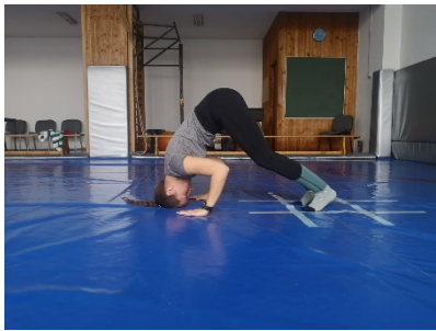
Slika 12., 13. i 14. Polušestarenje