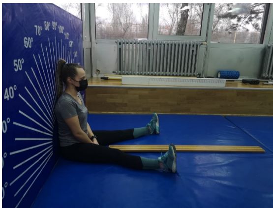
Slika 4. i 5. Pretklon raznožno

Test se izvodi u dvorani. Za izvođenje testa potreban je zid, a ispred zida se povuku linije duge 2 m pod kutom od 45° tako da vrh kuta dodiruje zid. Okomito na zid postavlja se centimetarska traka. Ispitanik sjedne na tlo glavom i leđima uza zid te postavi dlan preko dlana na tlo ispred sebe. Potpuno ispružene noge raznoži pod kutom od 45° te ih prilikom pretklona ne smije savijati u koljenima. Zadatak je da ispitanik izvede što dublji pretklon, ali tako da vrhovi prstiju bez trzaja klize uz traku na podu. Zadatak se izvodi tri puta. Rezultat u testu maksimalna je daljina dohvata od početnog dodira do krajnjeg dodira na centimetarskoj vrpici. Rezultat se očitava u centimetrima, upisuju se sva tri rezultata. (Bojić-Ćaćić, L., 2018)