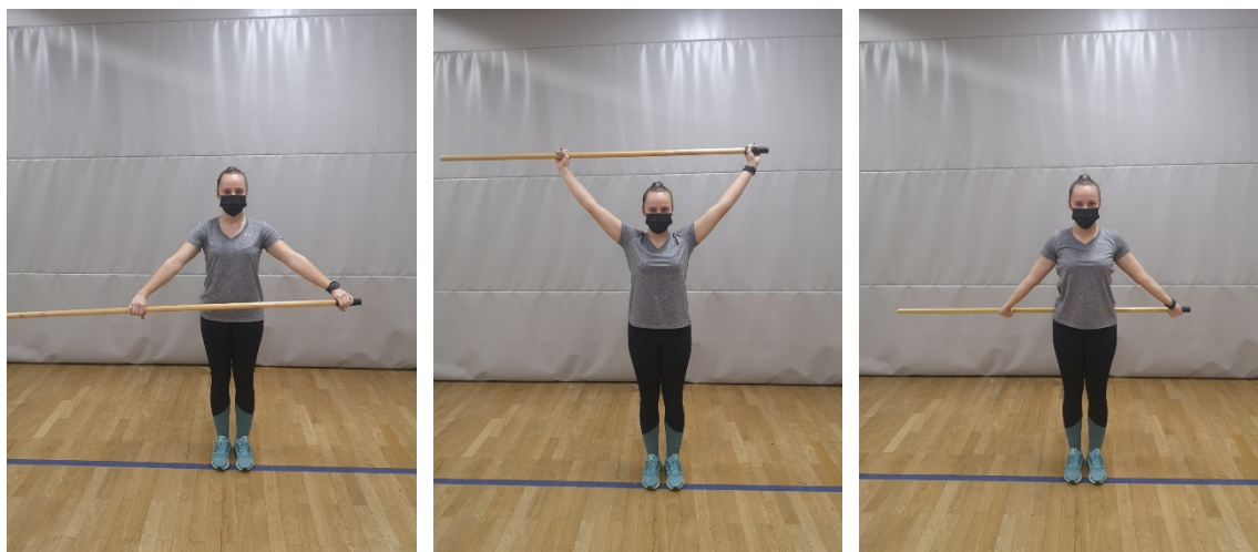
Slika 1.,2. i 3. Iskret palicom

Test se provodi u dvorani. Za izvođenje testa koristimo drvenu palicu promjera 2,5 cm i duljine 165 cm. Na jednom kraju palice, 15 cm od kraja, ucrtana je nulta točka te je od nje do drugoga kraja palice nacrtana centimetarska skala. Ispitanik u stojećem stavu drži palicu ispred sebe tako da lijevom šakom obuhvaća dio ispred ucrtane skale, a desnom šakom obuhvaća palicu neposredno do nulte točke. Iz početnog položaja ispitanik lagano pruženim rukama podiže palicu pred sebe i istovremeno razdvaja ruke kličući desnom šakom po palici, dok lijeva ostaje fiksirana. Zadatak je da ispitanik izvede iskret iznad glave držeći palicu pruženim rukama, a da je razmak između ruku najmanji mogući. Zadatak se bez pauze izvodi tri puta uzastopce. Rezultat je udaljenost između unutrašnjih rubova šaka nakon izvedenog iskreta izražena u centimetrima. Upisuju se rezultati svih triju pokušaja. (Bojić-Ćaćić, L., 2018)