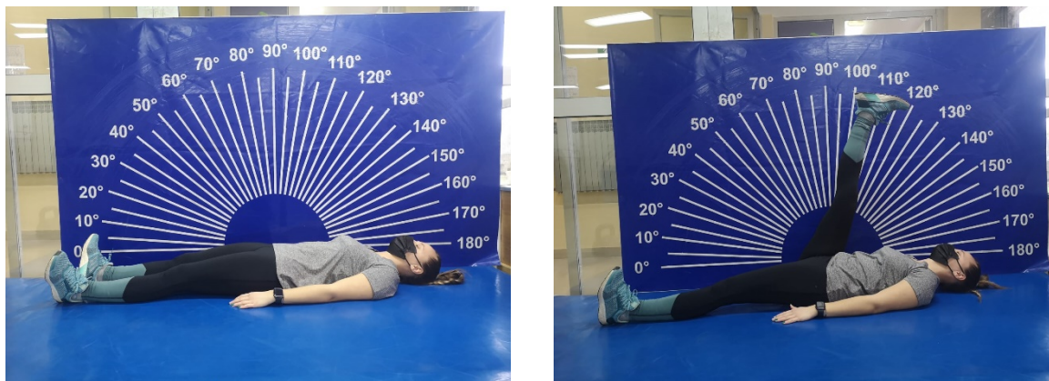
Slika 6. i 7. Prednoženje iz ležanja