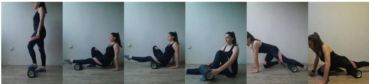
Slika 2. Prikaz protokola masaže pjenastim valjkom.

Za razliku od svih ostalih regija tijela, kod kojih se FR provodio u uporuz za/pred rukama ili u sjedećem položaju, FR stražnje strane stopala provodio se u stojećem stavu. Za FR stražnje strane potkoljenice, ispitanice su se nalazile u uporuz pred rukama, s pjenastim valjkom ispod potkoljenice, te stopalom iste noge i kukovima u zraku. FR potkoljenice obuhvaćao je masažu mekog tkiva iznad gležnja i ispod zgloba koljena. Prilikom FR-a stražnje strane natkoljenice, ispitanice su se nalazile u jednakom položaju, no s pjenastim valjkom ispod natkoljenice. Površina masiranja obuhvaćala je meko tkivo iznad zgloba koljena do sjedne kosti. FR prednje strane stopala izvodio se u sjedećem položaju. Ispitanice su u rukama držale pjenasti valjak i valjale po cijeloj površini stopala. Što se tiče FR-a prednje strane potkoljenice i natkoljenice, ispitanice su se nalazile u uporuz za rukama s pjenastim valjkom ispod regije koja se obrađuje. Prilikom FR-a prednje strane potkoljenice, ispitanice su obrađivale medijalnu i lateralnu stranu potkoljenice, te su se ponovo zadržavale u području između gležnja i zgloba koljena. Za FR natkoljenice ispitanice su obrađivale meko tkivo iznad zgloba koljena s nastojanjem da obrade što veću površinu, uključujući i medijalnu i lateralnu stranu natkoljenice (mišiće abduktore i aduktore) (slika 2).