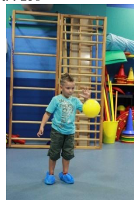
Slike 24a i 24b