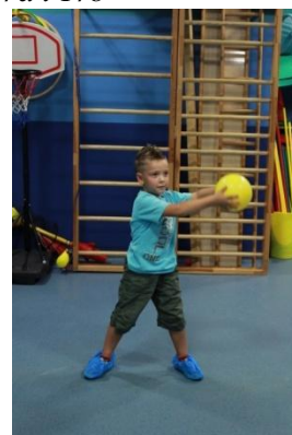
Slike 18a i 18b