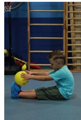
Slike 11a i 11b

11. Podizanje rampe – upor sjedeći pruženih nogu, loptom između stopala; naizmjenično nisko/visoko predložiti, spustiti na tlo