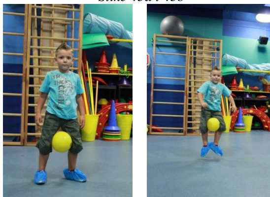
Slike 46a i 46b