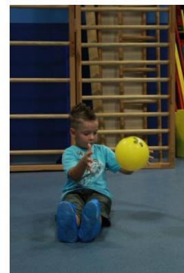
Slike 26a i 26b

11. Dizalica – upor sjedeći pruženih nogu, loptom između stopala; prednožiti, okret za 90°, vratiti se u početni položaj