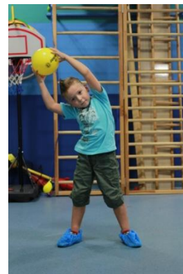
Slike 2a i 2b