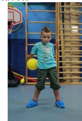
slike 19a i 19b