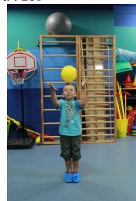
Slike 22a i 22b