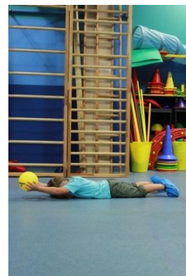
Slike 29a i 29b