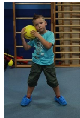
Slike 17a i 17b