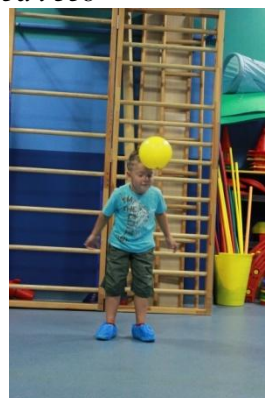
Slike 36a i 36b