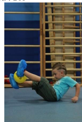
Slike 27a i 27b

12. Bomba – leći na leđa, uzručiti loptom; prednožno zgrčiti, loptom dotaknuti koljenja i vratiti se u početni položaj