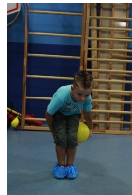
Slike 20a i 20b