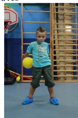
Slike 4a i 4b