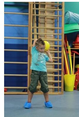
Slike 32a i 32b