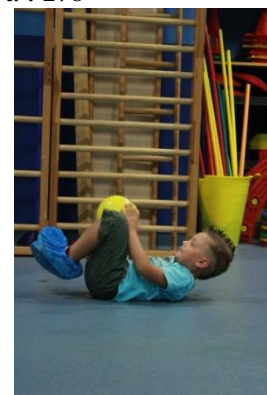
Slike 28a i 28b