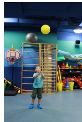
Slike 23a i 23b