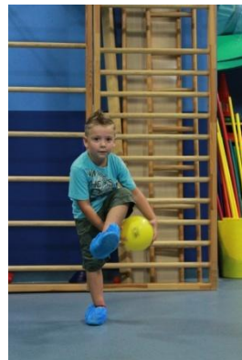
Slike 41a i 41b