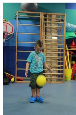
Slike 6a i 6b