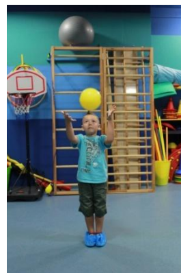
Slike 5a i 5b