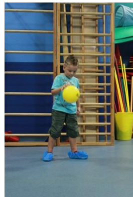
Slike 38a i 38b