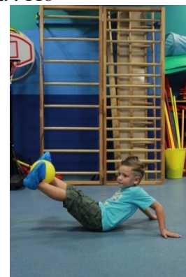
Slike 12a i 12b

12. Vozimo loptu brodom – sjed prednožno zgrčeno sa spojenim stopalima, loptom u predručenju dolje na stopalima; naizmjenični otkloni