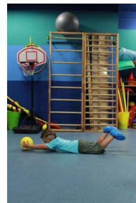
Slike 14a i 14b

14. Tuljan – leći licem prema tlu, loptom u uzručenju; kotrljati loptu iz ruke u ruku