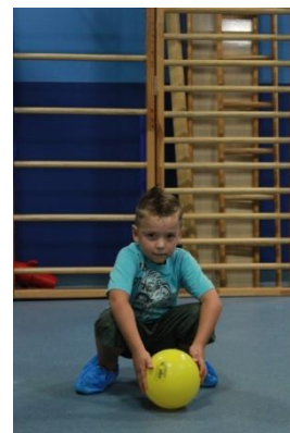
Slike 8a i 8b