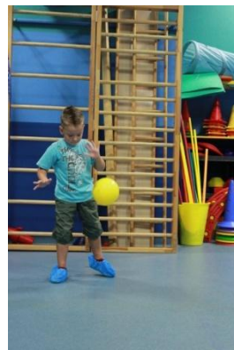
Slike 40a i 40b