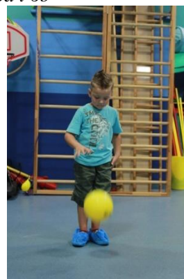
Slike 7a i 7b