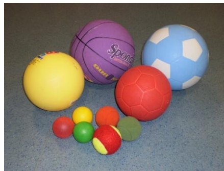
Slika 1. Lopte

U radu s djecom predškolske dobi mogu se koristiti rekviziti kao što su obruči, palice, baloni, vrećice i sl. Djeca su prilikom izvođenja pokreta zaokupljena manipuliranjem rekvizita pa pokret postaje točniji i koordiniran, a osim toga uz jačanje velikih mišićnih skupina razvijaju se i male.