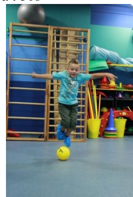
Slike 31a i 31b