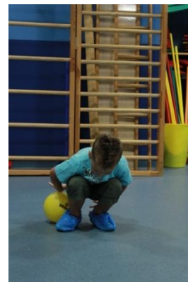
Slike 10a i 10b