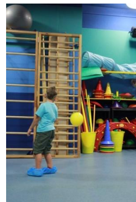
Slike 35a i 35b