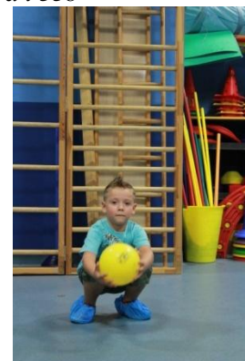
Slike 34a i 34b