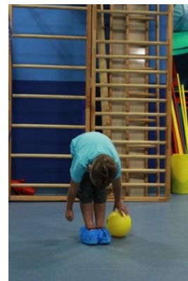
Slike 25a i 25b