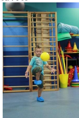
Slike 37a i 37b