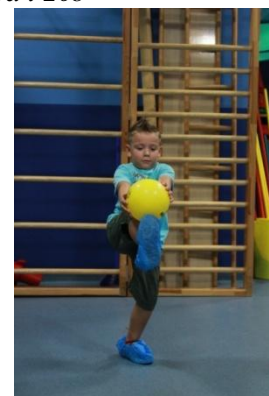
Slike 21a i 21b