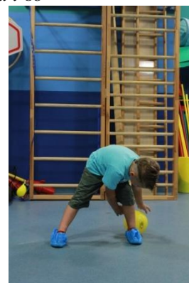
Slike 9a i 9b