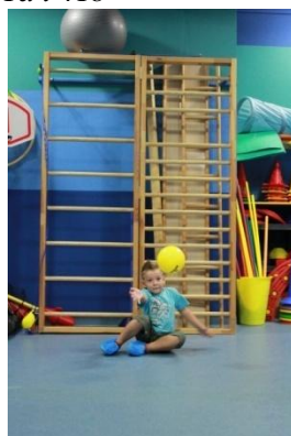
Slike 42a i 42b