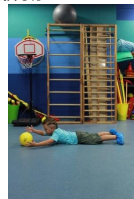
Slike 15a i 15b

15. Masaža – stav spojni, loptom predručiti unutra; kotrljati loptu po tijelu od prsiju do stopala i natrag