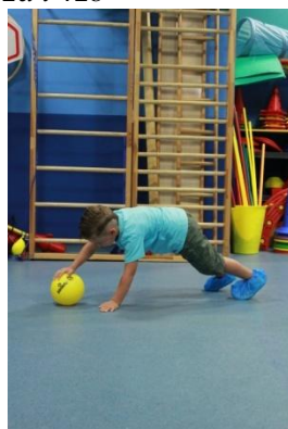
Slike 43a i 43b