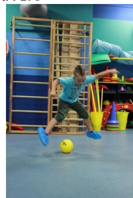
Slike 30a i 30b