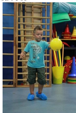
Slike 39a i 39b