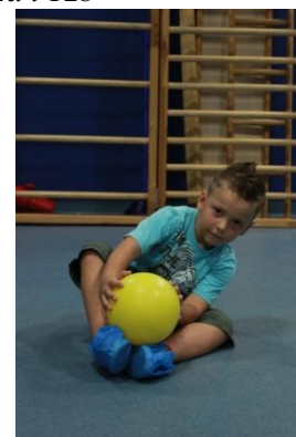
Slike 13a i 13b