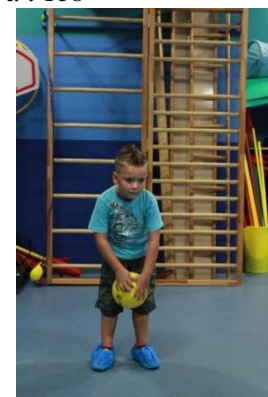
Slike 16a i 16b