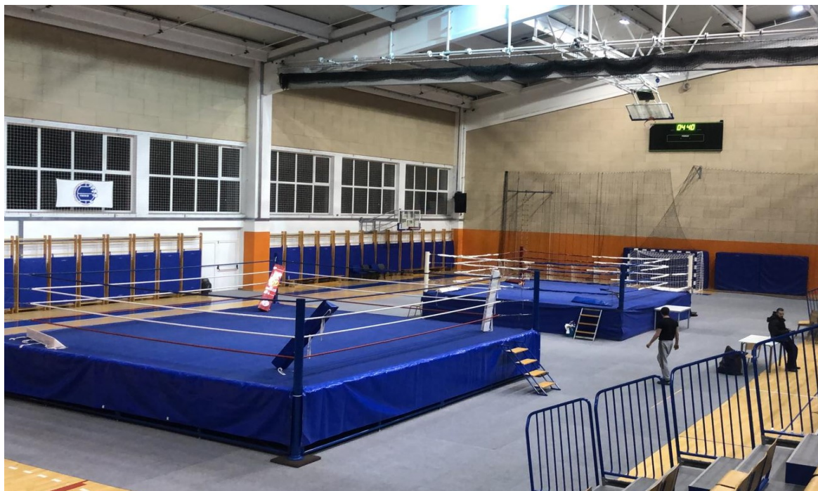
Slika 5: Dvorana u 4:40 sati na dan natjecanja.