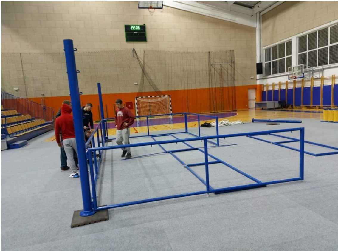
Slika 4: Dvorana u 22:06 dan prije natjecanja.