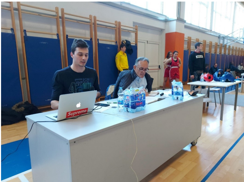
Slika 6: Raspored neslužbenog osoblja i najavljiivača .

Iduća slika broj 6. prikazuje improvizirani raspored napravljen za navedeno natjecanje. Naime, iza ringa su postavljeni najavljiivač događaja koji proziva natjecatelje i promatrač koji je imao simboličnu funkciju za vrijeme HBL-a, dok je za vrijeme Boksackog kupa odlučivao o dodjeli nagrada za najbolje sportaše. Uz navedeni dvojac, raspoređena su dva stola s volonterima koji su bili zaduženi za raspoređivanje boksačke opreme natjecateljima.