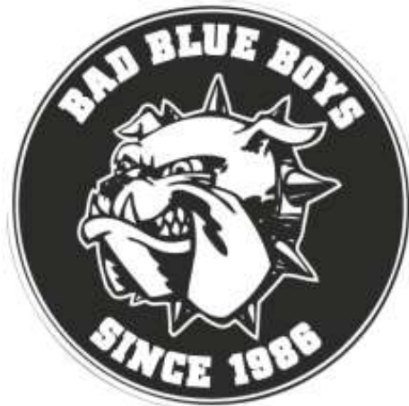
Slika 8. Maskota Bad Blue Boys – a, https://www.badblueboys.hr/bad-blue-bad-blue-boys/

BBB je ime za navijačku skupinu koja navija za zagrebački Dinamo. Osnovali su ih najvjerniji navijači Dinama i to po uzoru na slične skupine koje su postojale u inozemstvu. Ideju za naziv skupine su dobili po filmu „Bad Boys“ koji je bio poznat u to vrijeme. BBB-i su imali svoje podružnice i na utakmicama se pojavljuju razni transparenti poput BBB Maksimir, BBB Travno, BBB Dugave i sl. Njihova maskota je buldog, slika 8., a osnovani su 17. ožujka 1986. godine (Bad Blue Boys - https://www.badblueboys.hr/bad-blue-bad-blue-boys/ ).