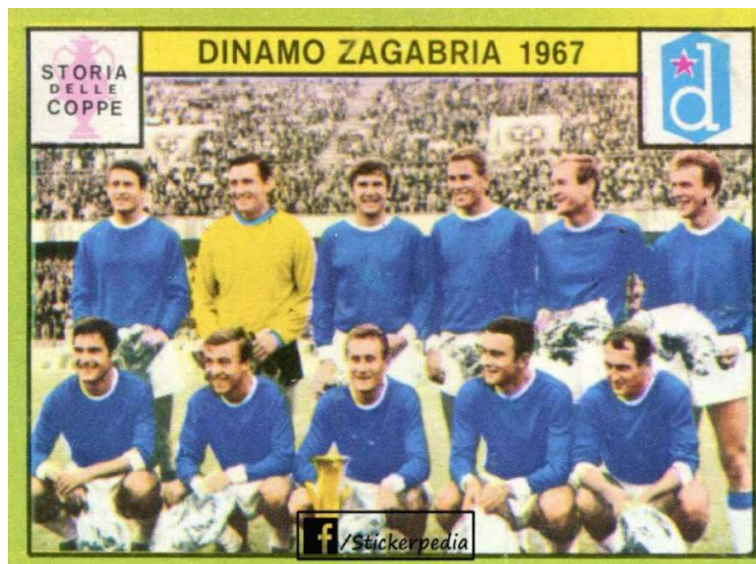
Slika 4. Dinamova ekipa 1967. godine,

Dinamo je na ovom natjecanju koje se odigralo 1967. godine osvojio Kup. U toj sezoni Dinamo je igrao na 4 fronta. Osim nastupa u jugoslavenskoj ligi i Kupu, Dinamo je nastupao i na Mitropa kupu. Trener Dinama tada je bio Branko Zebec, a tadašnja ekipa Dinama se može vidjeti na slici 5. U ekipi Dinama koja je osvojila Kup velesajamskih gradova nastupali su igrači: Škorić, Gračanin, Brnčić, Belin, Ramljak, Blašković, Čerček, Pirić, Zambata, Gurcmirtl i Rora te osvojili prvo mjesto koje je ujedno i najveće postignuće kluba na nekom europskom natjecanju. (Frntić, 1971).