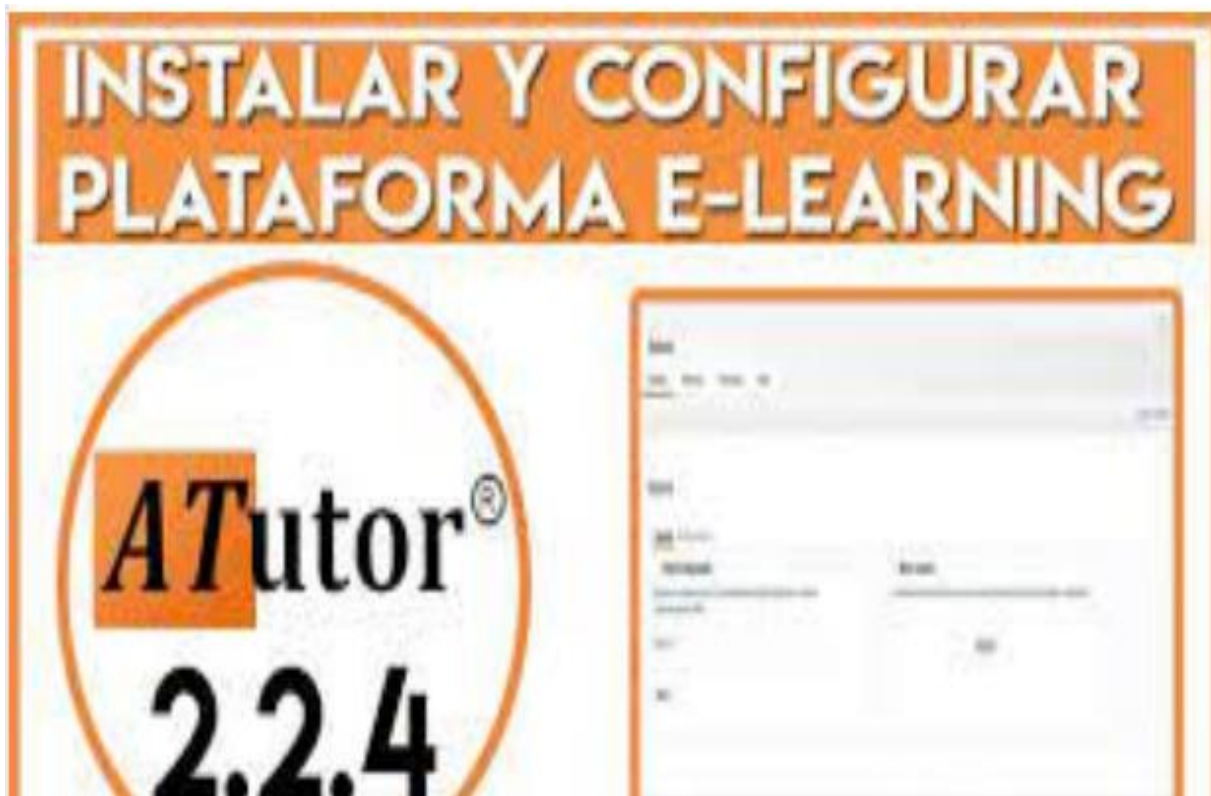
Slika 3. aTutor, platforma za e-učenje