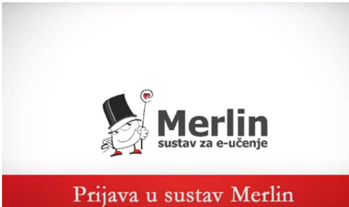
Slika 2. Merlin, platforma za e-učenje