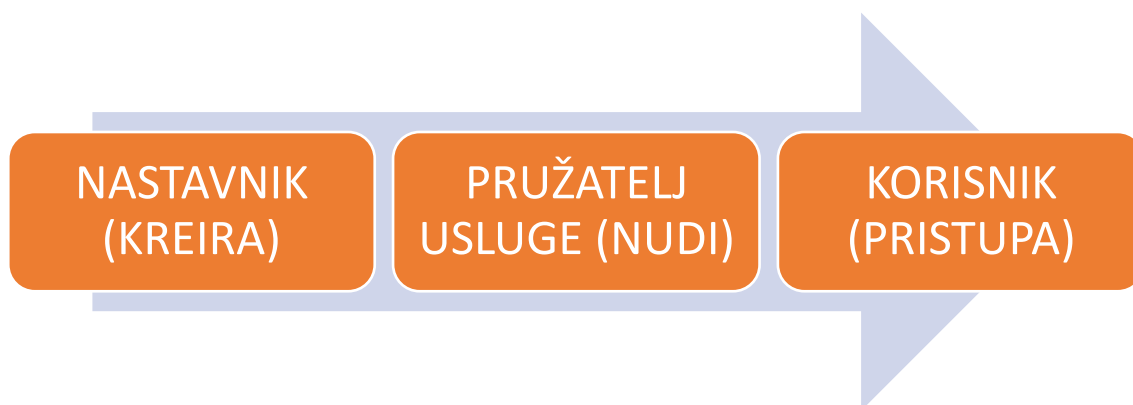
Slika 1. Proces e-učenja

Također, e-obrazovanje može se podijeliti na dvije skupine: sinkrono i asinkrono. Aktivnosti u e-obrazovanju mogu biti izvedene sinkrono, odnosno (u isto vrijeme ili unutar nekog kraćeg vremenskog intervala) i asinkrono (u različito vrijeme, odnosno bez definiranih kratkih ciljnih vremenskih intervala). Iako se smatra kako bi sinkrone aktivnosti trebale biti samo one koje se izvode u istom trenutku, povremeno se navedeni termin upotrebljava i za aktivnosti koje su "sinkronizirane", tj. koje treba izvesti određenog sata, dana ili tjedna tijekom obrazovanja na daljinu. U sinkrone aktivnosti ubrajamo: videokonferencije, elektroničko čavljanje, istovremene poruke, elektroničke ploče i dijeljenje ekrana. Kod sinkronih aktivnosti svi uključeni polaznici trebaju istovremeno sudjelovati. Asinkrone aktivnosti omogućuju polaznicima da ih obavljaju u vrijeme koje sami izaberu. Vremenski neograničeno korištenje elektroničke pošte, foruma i dokumenata postavljenih na web, kao i kvizova i testova čije je bodovanje automatizirano, predstavljaju vrste asinkronih aktivnosti (Karač i sur., 2015).