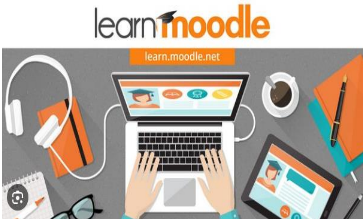
Slika 5. Moodle, platforma za e-učenje

Riječ Moodle skraćena je izraza Modularno objektno-orijentirano dinamičko obrazovno okruženje (eng. Modular Object-Oriented Dynamic Learning Environment) i veže se na obrazovnu teoriju društvenog konstruktivizma. Moodle predstavlja besplatno sredstvo otvorenog koda (eng. open source ), odnosno dozvoljen je uvid u programski kôd, njegovo mijenjanje i prilagodavanje, ali pod uvjetom da se ponudi zajednici na korištenje pod originalnom licencom. Ujedno, moodle je i glagol koji na engleskom jeziku označava proces polaganog prolaska kroz neku materiju, u ovom slučaju kroz elektronske obrazovne sadržaje, načinom i dinamikom koji odgovara sudioniku obrazovnog procesa. Moodle zajednica iznimno je velika i broji preko stotinu milijuna korisnika na više od 79000 registriranih web sjedišta. Države koje imaju najveći broj registriranih sjedišta su Sjedinjene Američke Države, Španjolska i Brazil. U Hrvatskoj je javno dostupno 100 sjedišta, a broj korisnika je u stalnom porastu (Nacionalni portal za učenje na daljinu, „Nikola Tesla“). 2