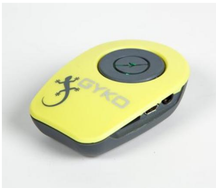
Slika 1 Mjerni uređaj Akcelerometar Microgate Gyko

Akcelerometar Microgate Gyko predstavlja napredni uređaj za mjerenje ubrzanja, kutne brzine te magnetno polje i time omogućava prikupljanje kinematičkih podataka o bilo kojem dijelu tijela prilikom pokreta, te mjeri kroz 3 dimenzije jer posjeduje 3D akcelerometar koji mjeri linearno ubrzanje, 3D žiroskop koji mjeri kutnu brzinu te 3D magnetometar koji mjeri magnetno polje kojem je uređaj izložen. U dosadašnjim istraživanjima se ovaj uređaj pokazao valjanim i pouzdanim za mjerenje brzine šipke kod potiska s klupe (Jorge i suradnici, 2019) .