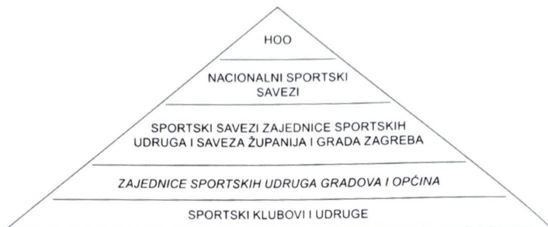
Slika 1. Piramidalni sustav sporta u RH, prema „Karakteristike menadžera u upravljanju sportskim organizacijama“, M. Bartoluci i S. Škorić, 2009.

U HOO djeluju i udružuju se nacionalni sportski savezi te sportske zajednice lokalnih i regionalnih samouprava. (Zakon o sportu, NN 141/2022)