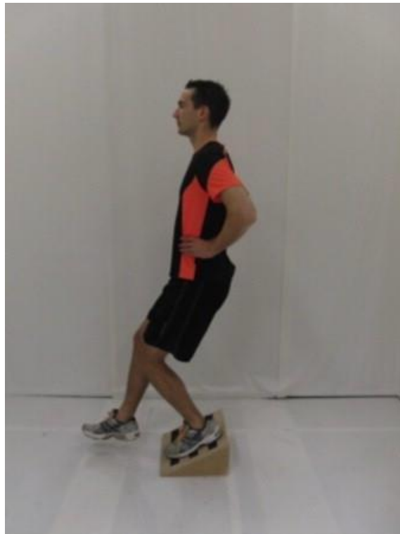
Slika 2. Jednonožni ekscentrični čučanj

Ključni test koji se izvodi da bi se ustanovilo radi li se u konkretnoj situaciji o boli u koljenu odnosno na vršku patele je ekscentrični čučanj s jednom nogom. Od sportaša koji stoji na bolnoj nozi na kosoj ploči od 25 stupnjeva traži se da održava uspravan trup i čučne do 90 stupnjeva, ako je moguće (Slika 2.). Test se također radi stojeći na zdravoj nozi.