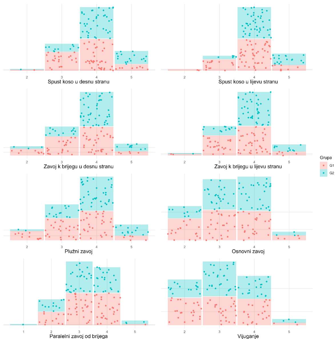
Slika 1. Distribucija frekvencija ocjena za obje grupe u svim promatranim varijablama

Nadalje, slika 2. prikazuje distribuciju ispitanika pripadnika različitih grupa uzimajući u obzir dobivenu ocjenu u svim promatranim varijablama, gdje su ocjene prikazane kao kontinuirana varijabla zaokružena na jedno decimalno mjesto.