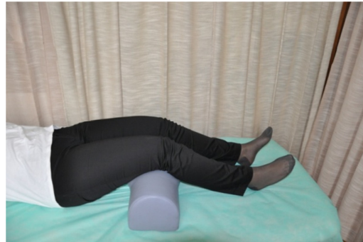
Slika 6. Početni položaj - ležeći na leđima, s blago savinutim koljenima preko jastučića.