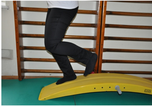
Slika 46. Zatim se samo na zdravoj nozi podiže u početni položaj. Podizanje ne mora biti polagano.