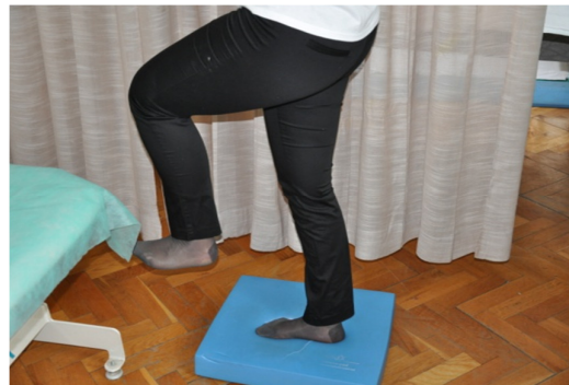
Slika 42. Stabilnost pokušati zadržati samo na jednoj nozi. Druga se noga savije u koljenu i odmakne prema naprijed. Vježbu je moguće izvoditi uz pridržavanje.