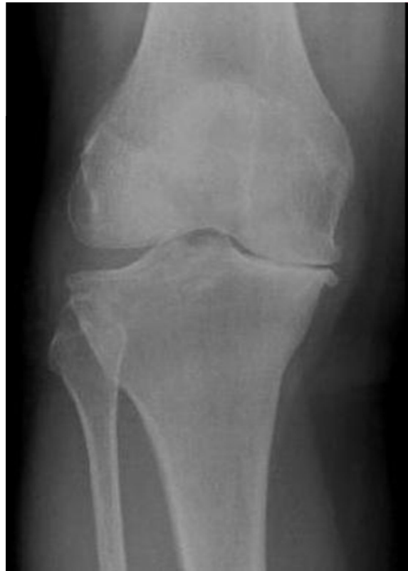
Slika 2. Radiografski nalaz kod OA koljena

koštani izdanci (osteofiti) (slika 2). Drži se da su te promjene primarno odgovor kostiju na povećano mehaničko opterećenje uslijed oštećenja zglobne hrskavice (Sinusas, 2012).