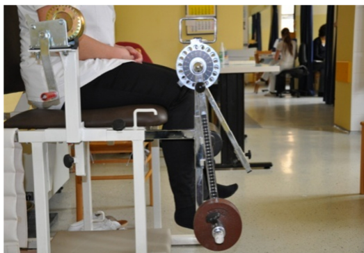
Slika 29. Početni položaj - uspravno sjedeći na stolcu, stopala su u širini kukova, a koljena savijena pod pravim kutom.