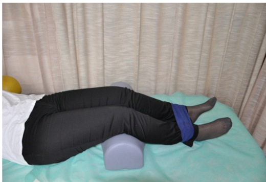
Slika 11. Početni položaj - ležeći na leđima, s blago savinutim koljenima preko jastučića i potkoljenicama povezanih elastičnom trakom.