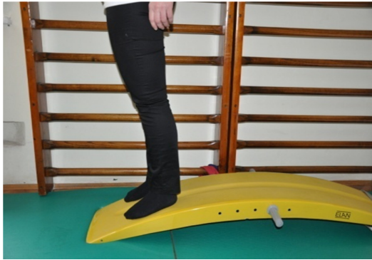
Slika 43. Početni položaj s nogama na kosoj podlozi (25 stupnjeva kosine).