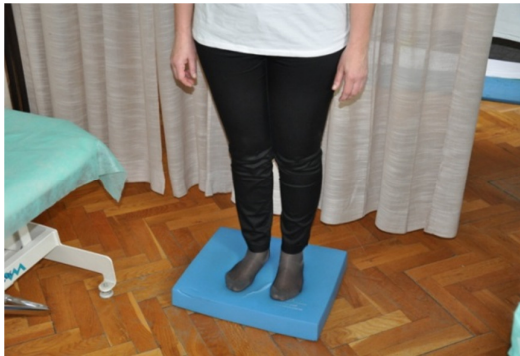
Slika 37. Ponovno uspostaviti stabilnost na balansnoj spužvi.