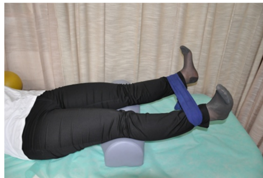
Slika 12. Sa čvrsto zategnutim stopalima ispružiti noge, a koljenima pritiskati jastučić. Nakon toga maksimalno odmaknuti noge uz progresivni otpor elastične trake.