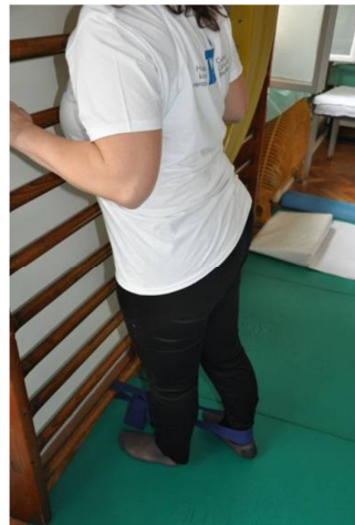
Slika 24. Kod ove vježbe vrijede sva pravila kao kod prve vježbe, jedino je početni položaj licem prema zidu, a noga se odmiče prema straga.