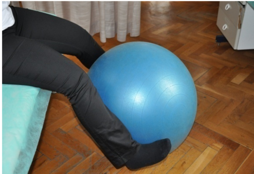
Slika 25. Početni položaj - uspravno sjedeći, s rukama oslonjenim na krevet i loptom između potkoljenica.