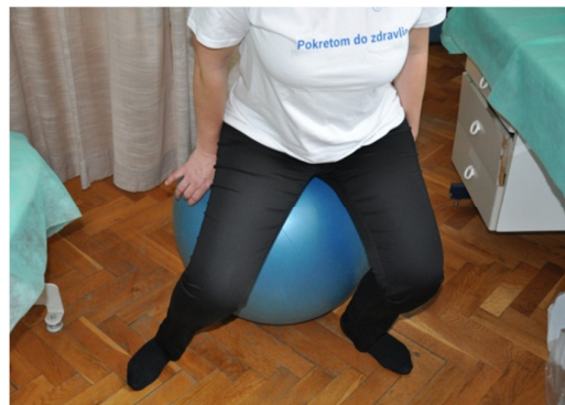
Slika 28. Iz početnog položaja pokušati prebaciti težinu na jednu nogu i lagano kao da noga ide u dizanje. Zadržati se u tom krajnjem stabilnom položaju i potom se vratiti u početni položaj.