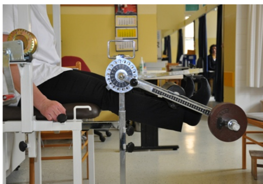
Slika 31. Kod ove vježbe pravila su ista kao i kod prethodne, jedino se vježba s obje noge istovremeno.