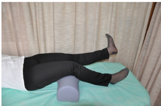
Slika 7. Odizati potkoljenicu ispružene noge, čvrsto zategnuti stopalo, a koljenom pritiskati jastučić. Zadržati nogu u tom položaju i potom vratiti u početni položaj.