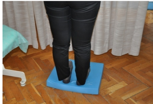
Slika 38. Težinu prebaciti na pete i odignuti prste, te što dulje i što bolje održati taj položaj.