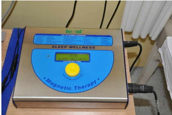
Slika 47. Uređaj za elektromagnetoterapiju.