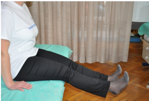
Slika 19. Kod ove vježbe vrijede sva pravila kao kod prethodne, ali se istovremeno ispružaju obje noge.