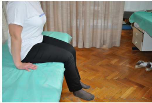
Slika 20. Završni položaj.