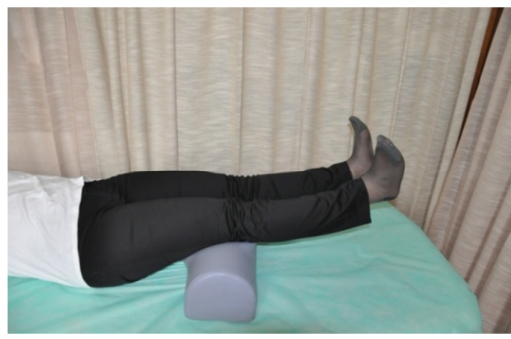
Slika 8. Kod ove vježbe vrijede sva pravila kao kod prethodne, ali se istovremeno odizuju obje noge.