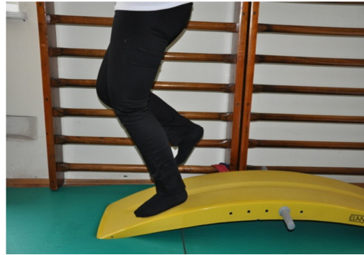
Slika 44. Oslonac je samo na jednoj (bolesnoj) nozi, koja se vrlo polagano savija u koljenu do 45 stupnjeva. Spuštanje traje 4-5 sekundi.