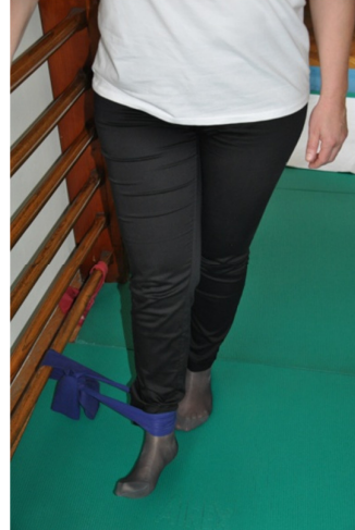
Slika 22. Kod ove vježbe vrijede sva pravila kao kod prethodne, jedino je usmjerenost noge prema unutra (medijalno).