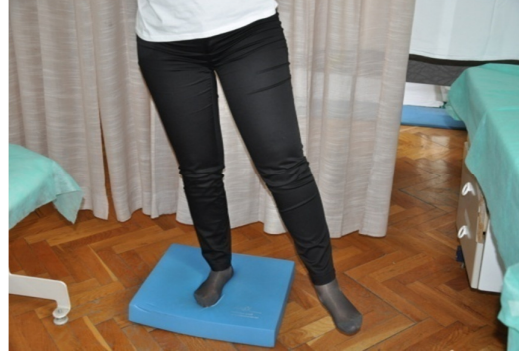
Slika 40. Stabilnost pokušati zadržati samo na jednoj nozi. Druga se noga odmakne u stranu. Ako je potrebno, vježbu je moguće izvoditi uz pridržavanje.