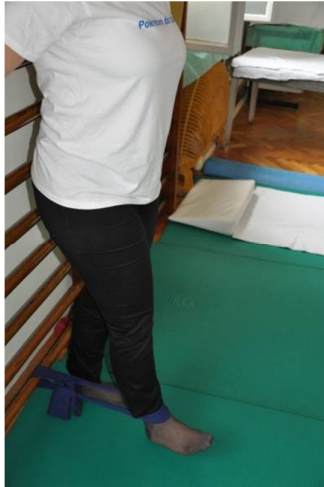
Slika 21. Sa čvrsto zategnutim stopalom usmjeriti ispruženu nogu u koljenu prema naprijed uz otpor elastične trake.