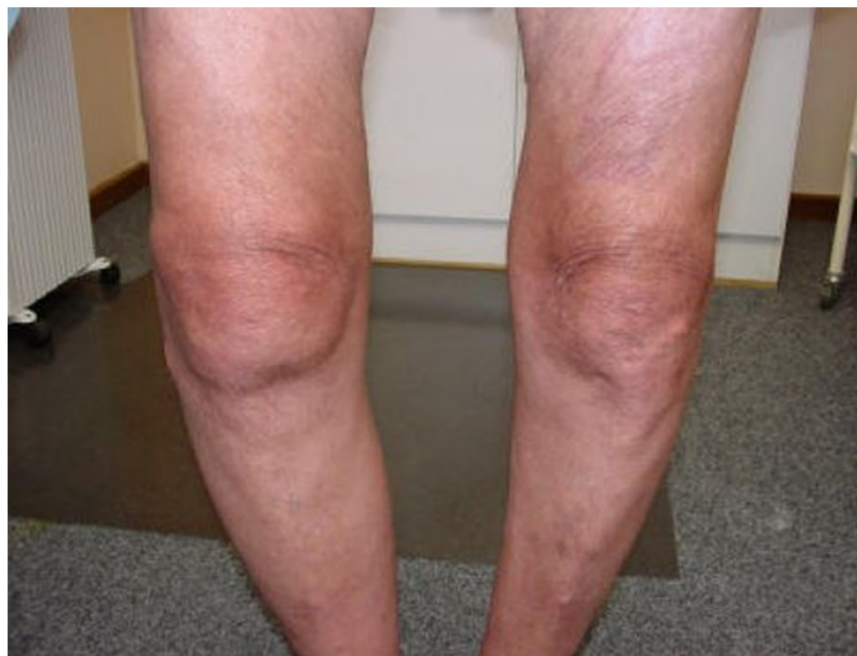
Slika 1. Tipičan klinički nalaz u težem stadiju OA koljena

bolesnici izbjegavaju bilo kakva opterećenja koljena koja uzrokuju bol. Ta smanjena mišićna snaga usko je povezana s gubitkom tjelesne funkcije (Peat, Croft i Hay, 2001).