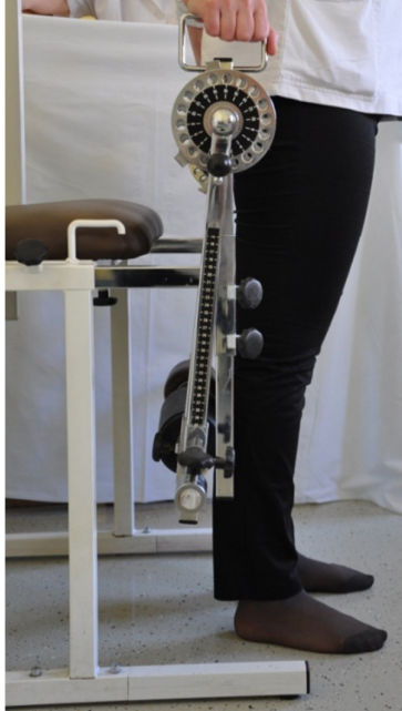
Slika 33. Početni položaj - stojeći, stopala su u širini kukova, a koljena potpuno ispružena.