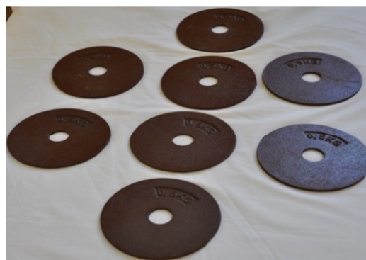
Slika 32. Opterećenje je u početku 1 kg, a povećava se za 1 kg tjedno do maksimalno 4 kg. Tolerancija u broju ponavljanja je individualna.