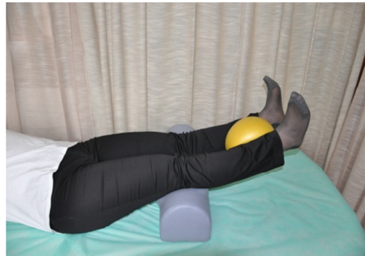
Slika 10. Sa čvrsto zategnutim stopalima stisnuti loptu, ispružiti noge preko jastuka, zadržati u tom položaju i vratiti noge na podlogu.