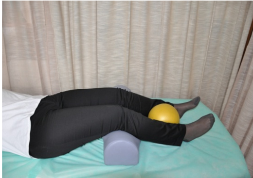
Slika 9. Početni položaj - ležeći na leđima, s blago savinutim koljenima preko jastučića i loptom smještenom između potkoljenica.