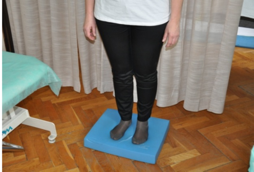
Slika 39. Uspostaviti stabilnost na balansnoj spužvi.