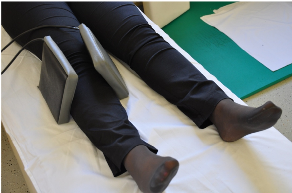
Slika 48. Primjena elektromagnetoterapije.