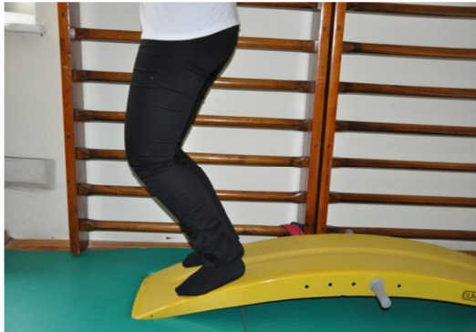
Slika 45. Nakon dosegnute fleksije u koljenu od 45 stupnjeva spušta se druga (zdrava) noga na podlogu i prebacuje težina na tu zdravu nogu.