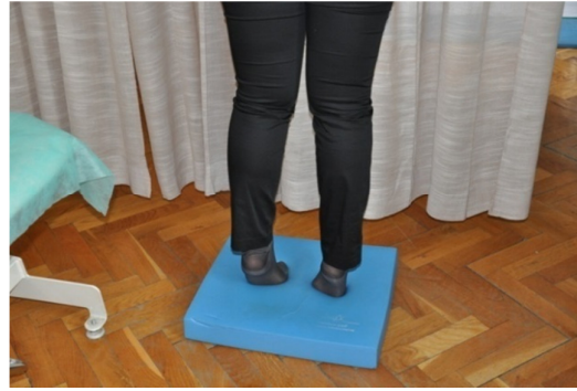
Slika 36. Iz početnog se položaja podići na prste oba stopala, te što dulje i što bolje održati taj položaj.