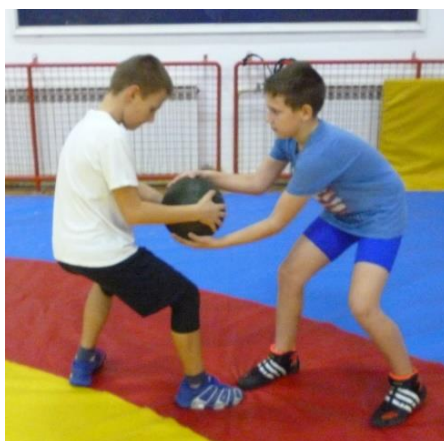
Slika 35: Igra 22

Elementi tehnike: učenje i usavršavanje osnovnog borbenog hrvačkog stava