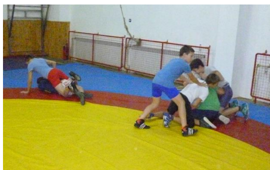
Slika 11: Kralj borilišta