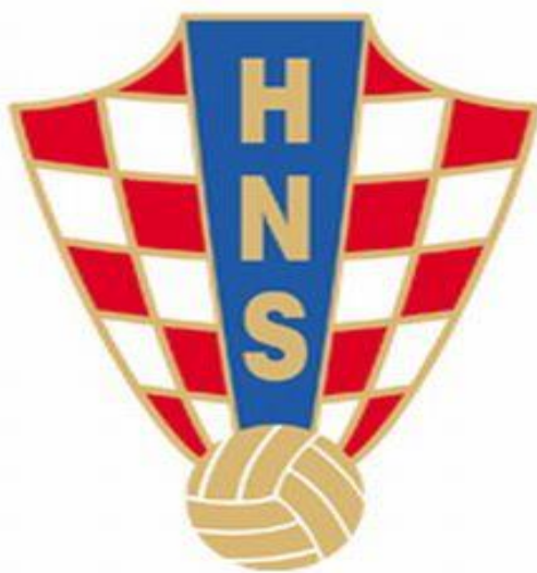
Slika 3. Logo Hrvatskog nogometnog saveza, Sport.hrt.hr (2011).

Krovna nogometna organizacija u svijetu je Fédération Internationale de Football Association (FIFA). U Europi je to Union of European Football Associations (UEFA), a u Hrvatskoj Hrvatski nogometni savez (HNS).