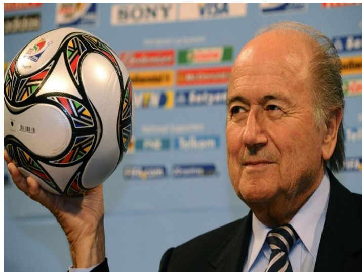
Slika 4. Bivši predsjednik FIFA-e, Sepp Blatter.

Nedugo nakon spomenute afere tadašnji predsjednik FIFA-e Sepp Blatter je podnio ostavku i rekao: „Fifa nije korumpirana. U nogometu nema korupcije, postoje samo ljudi koji su podmitljivi. Fifa pati, ali se događaju i pozitivne stvari nakon optužbi koje su je pogodile.“ (Vecernji.hr, 2015) Također je izjavio i: „Podnio sam ostavku jer želim zaštititi Fifu. Sebe mogu zaštititi, dovoljno sam snažan.“ (Vecernji.hr, 2015)