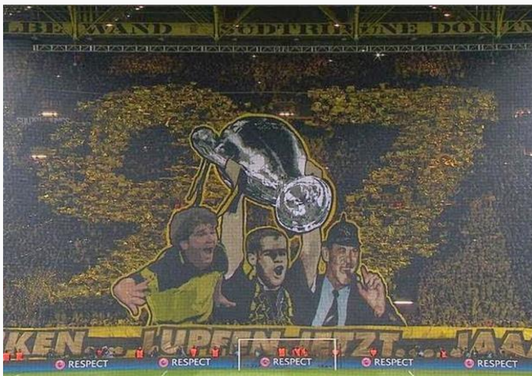
Slika 7. Koreografija navijača Borussie Dortmund.

Jedino što ostaje navijačima nakon ovakvih afera je nada u bolje sutra. Nada da će vodstvo institucija, klubova i nogometnih organizacija biti stručno, pošteno i da neće biti naznaka pojave korupcije.