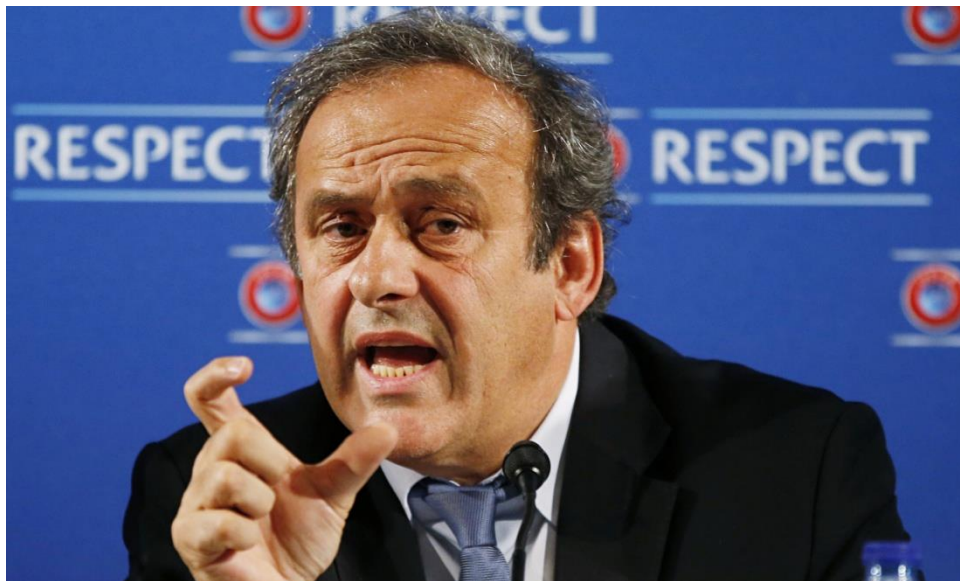
Slika 5. Bivši predsjednik UEFA-e, Michel Platini

„Francuz je ranije objavio kada je podnio žalbu na suspenziju koju mu je dodijelila FIFA da će podnijeti ostavku na funkciju predsjednika UEFA-e ako mu žalba ne uspije. Danas je nakon odluke CAS-a kazao da podnosi ostavku kako bi mogao "nastaviti svoju borbu pred švicarskim sudovima". FIFA je 21. prosinca donijela odluku kojom suspendira Platinija na sve aktivnosti vezane za nogomet na osam godina, no ta je kazna nakon njegove žalbe u veljači smanjena na šest godfna.“ (Jutarnji.hr, 2016)