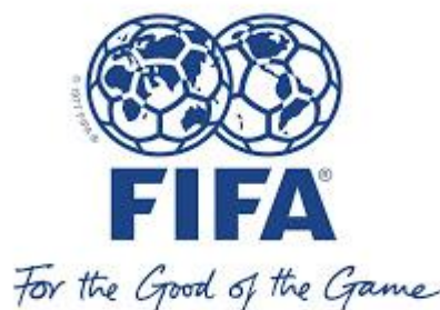
Slika 1. Logo FIFA-e, Logo-share.blogspot.hr (2013).

Na definiciju bih se nadovezao pitanjem je li korupcija prisutna i u hrvatskom nogometu? Pitanje se ne odnosi samo na institucije hrvatskog nogometa i njihove službenike već i na nogometne terene, odnosno samo odigravanje nogometne utakmice. Isto tako, spomenuo bih različite sumnjive ždrjebove, odnosno izvlačenja parova u nacionalnim kupovima, Ligi prvaka i u Europskoj ligi gdje često „veći“ i poznatiji nogometni klubovi dobivaju „lakše“ protivnike do finala. Takve priče kruže po medijima i društvenim mrežama svake godine.