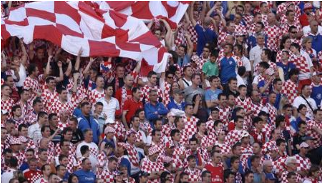
Slika 8. Hrvatski navijači.

Provedeno je istraživanje na temu percepcija pojava korupcije u hrvatskom nogometu na uzorku navijača, a metode i rezultati istraživanja su prikazani u nastavku.