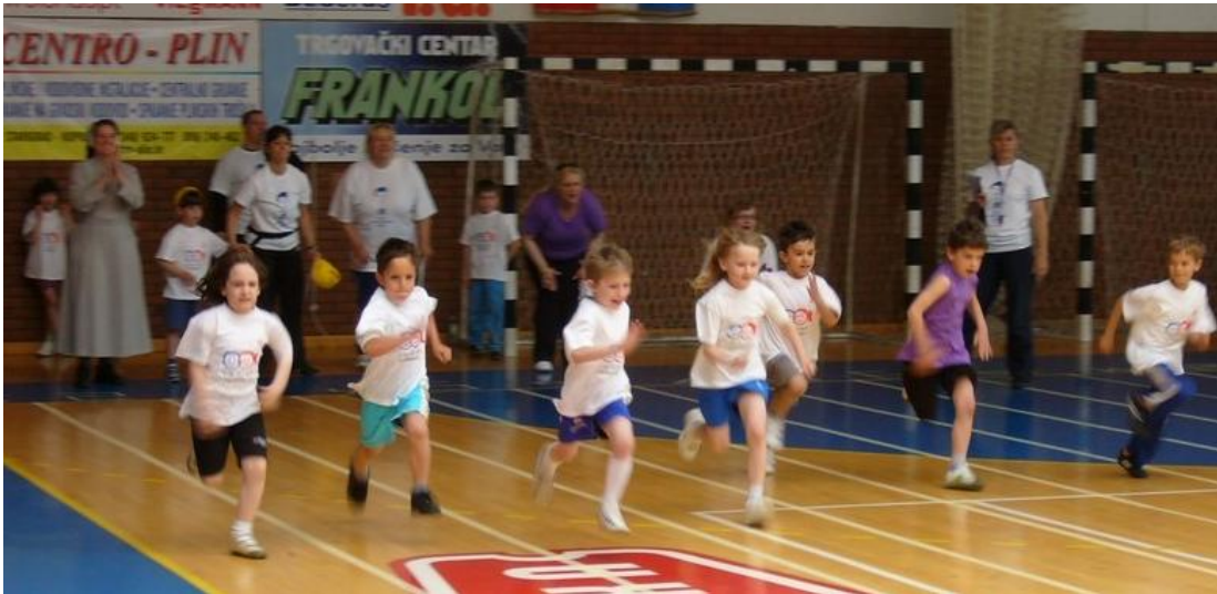
Slika 28. Trčanje

Motorička znanja i motoričke sposobnosti razvijaju se usporedno i sustavno jer su atletska znanja i sposobnosti, na čiji razvoj djeluju atletske operatore, temeljna za nadogradnju velikog broja znanja i sposobnosti bitnih za uspjeh u drugim aktivnostima. Višestrani razvoj je ono što djeca moraju dobiti kroz atletiku i to kroz kineziološke operatore koji su interesantni, raznovrsni, zabavni i djelotvorni. (slika 28)