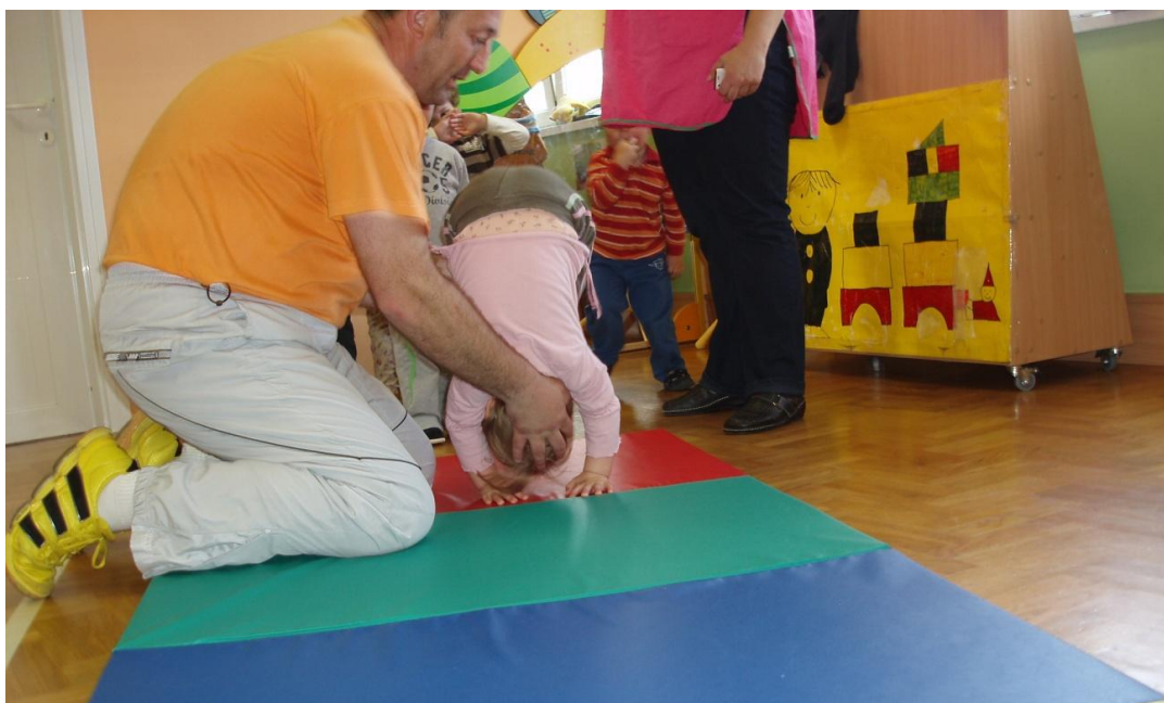
Slika 24. Kolut naprijed s asistencijom