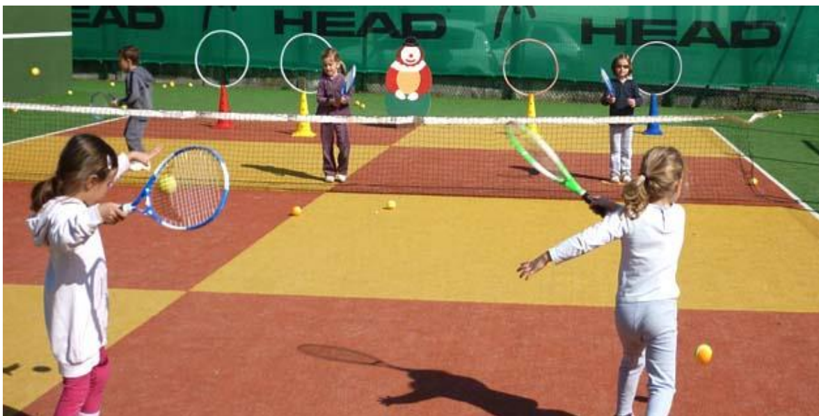
Slika 6. Prikaz mini tenisa u teniskoj školi u Francuskoj

Mini-tenis je diljem svijeta prihvaćena metoda, kojom djeca između pete i osme godine života uče igrati tenis. Osnovna ideja je da prva iskustva s tenisom budu ugodan doživljaj. Zato je prvo pravilo mini-tenisa da se učenje provodi kroz igru (Friščić, 2004).