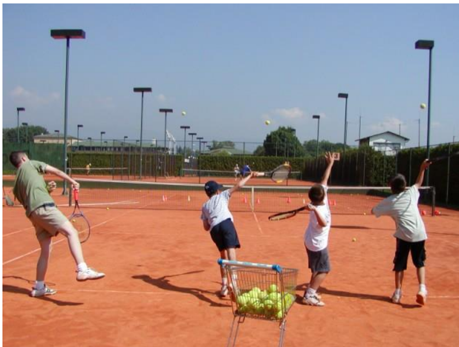
Slika 7. Škola tenisa – grupni rad

moгу pokazati pravilne teniske udarce. Djeca dobro reaguju na vizualne podražaje, stoga vizualni doživljaj igre u dječjem uzrastu ima vrlo veliku važnost. Jako je bitan pristup djetetu i primjena osnovnih didaktičkih principa kao što su: lakše – teže, poznato – nepoznato, konkretno – apstraktno, bliže – dalje itd.