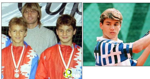
Slika 8. Roger Federer kao junior - s 12 godina je počeo ozbiljnije trenirati tenis, do tad je igrao nogomet. S 15 godina počima igrati ITF turnire, a sa 17 osvaja juniorski Wimbledon

Klasično srednjoškolsko obrazovanje se provodi u okviru dopisne škole. Obzirom da profesionalno obrazovanje zahtjeva znatna materijalna i tehnička sredstva, nužno je u takav proces obrazovanja uključiti samo izrazito talentirane igrače (Rupić, 2008).