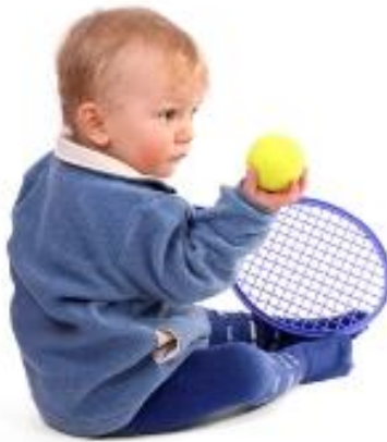
Slika 5. Dijete s teniskim reketom i lopticom

Kako je već utvrđeno, dijete se može početi baviti tenisom vrlo rano. Ako se krene individualno raditi s djetetom, opet je naglasak na igru i ravnopravnost s trenerom. Što se grupnog rada tiče, djeca bi trebala biti podjednake dobi ili sposobnosti da bi se trening mogao planirati i lakše provoditi.