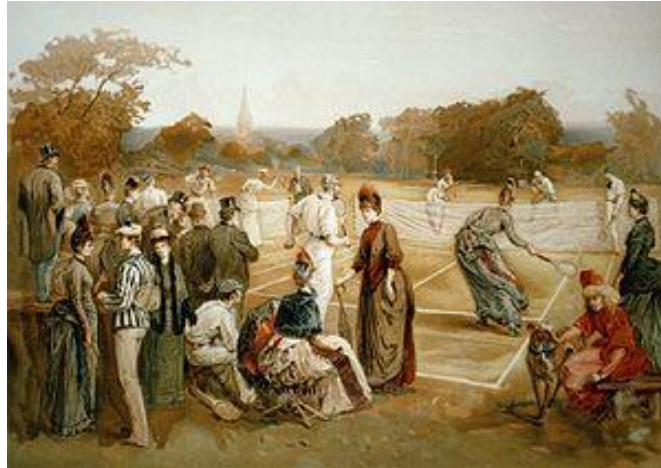
Slika 3. Tenis 1887. godine