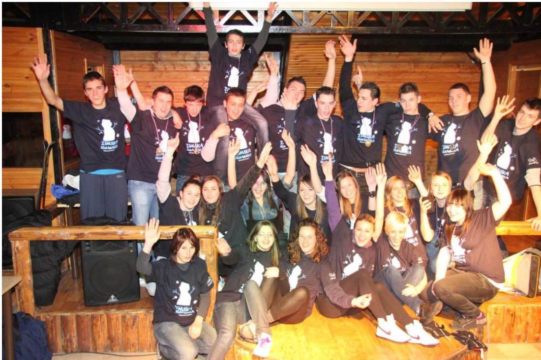
Slika 1. Sudionici zimske igraonice na Bjelolasici 2010. godine

Prošlo je 15 godina od kada je grad Jastrebarsko pokrenuo organizaciju zimske igraonice u želji da svakom djetetu u svome gradu omogući aktivno sudjelovanje u zimskim sportovima u mjestu, te izvan mjesta stanovanja. Detaljnom analizom programa Zimskih igraonica doći će se do zaključaka, te odlučiti o mogućnostima daljnje realizacije Zimskih igraonica u gradu Jastrebarsko. Moći će se zaključiti na koji se način i s kakvim efektom različiti programi realiziraju. Rad bi trebao poslužiti kao smjernica prema osiguravanju kvalitetne Zimske igraonice u budućnosti, kako u samom gradu, tako i izvan mjesta stanovanja.