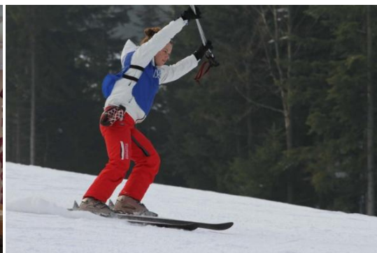
Slika 25. Škola skijanja