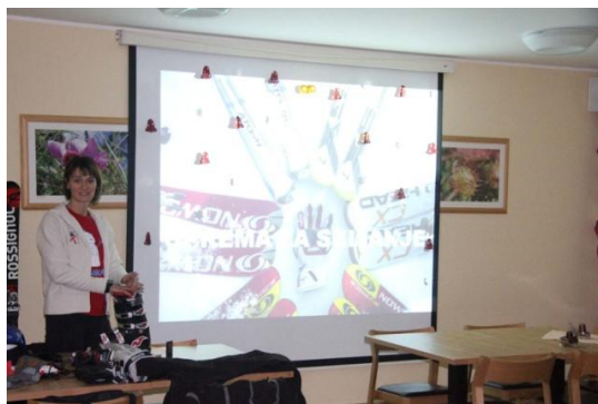
Slika 24. Teorijsko predavanje