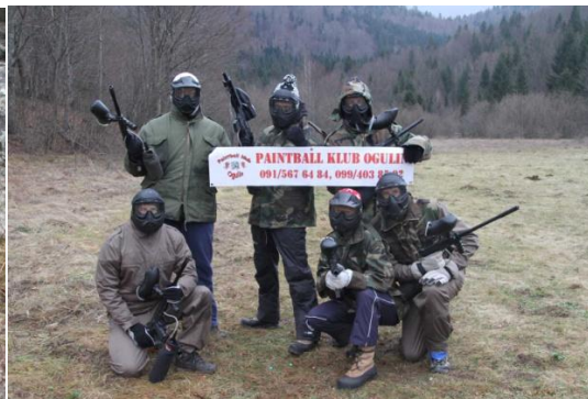
Slika 23. Paintball