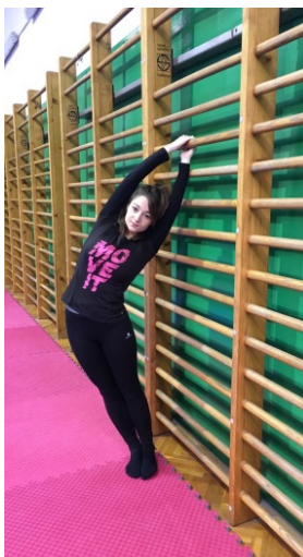
Slika 5. Otkloni uz švedske ljestve