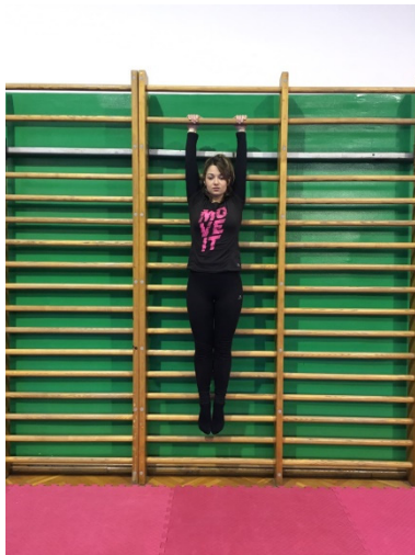
Slika 25. Vis na švedskim ljestvama