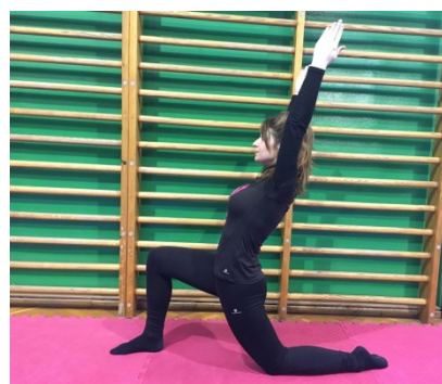
Slika 28. Jednonožni klek sa uzručenjem