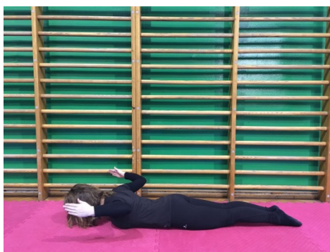
Slika 13. Primicanje lopatica ležeći na trbuhu