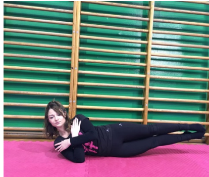
Slika 3. Ležanje na boku i otklon