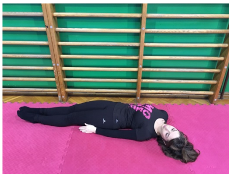
Slika 1. Otkloni