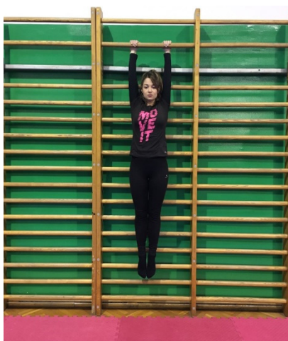
Slika 6. Vis na švedskim ljestvama