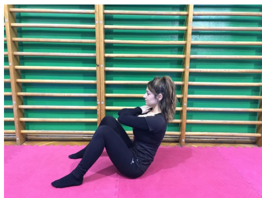
Slika 23. Iz ležaja u sjed