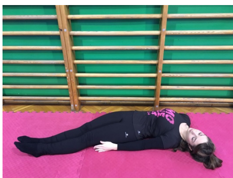
Slika 2. Otklon i odnoženje