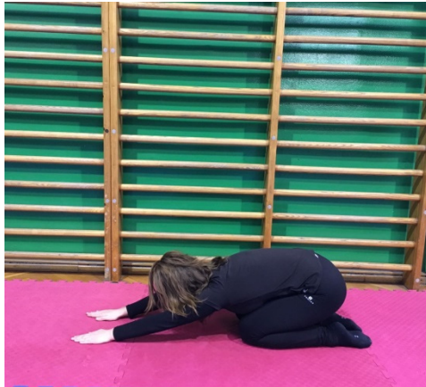
Slika 20. Sjed na pete