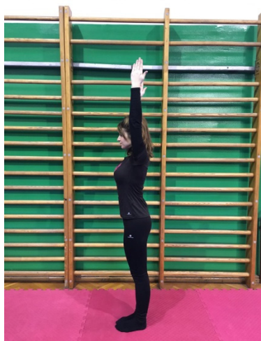
Slika 8. Uzručenje