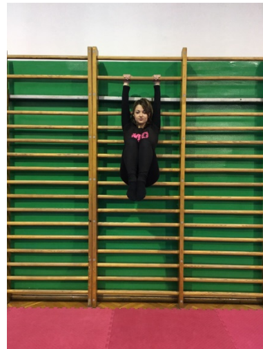
Slika 26. „Bombica“