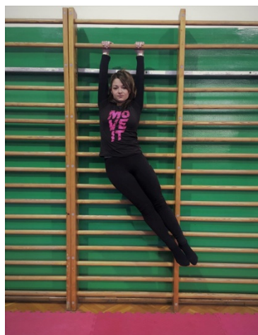
Slika 7. Odnoženje na švedskim ljestvama