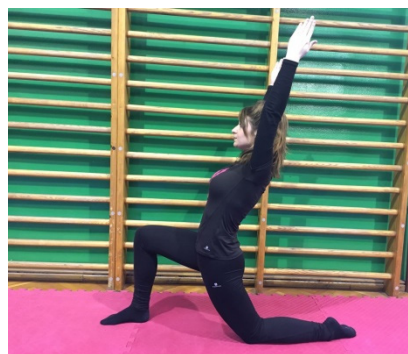
Slika 28. Jednonožni klek sa uzručenjem