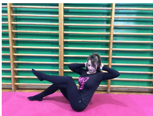
Slika 24. Suprotna ruka - suprotna noga