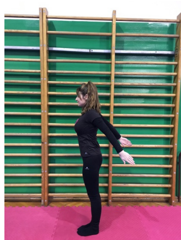
Slika 9. Kruženje rukama u natrag