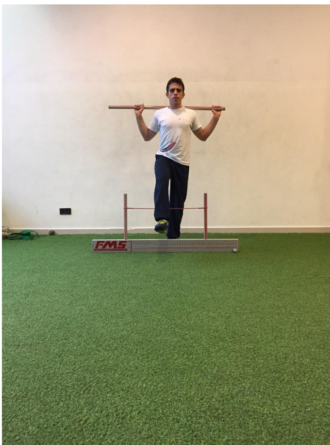
Slika2. Izvedba testa prekorak.