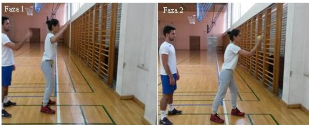
Slika 24. Hvatanje teniske loptice odbijene od zida

OPIS: Vježba se izvodi u paru. Prvi vježbač stoji u osnovnom vratarskom stavu, drugi vježbač ima loptu kod sebe (faza 1), drugi vježbač baca loptu iznad glave prvog vježbača tako da se odbije od zida (faza 2), prvi vježbač hvata loptu (faza 3).