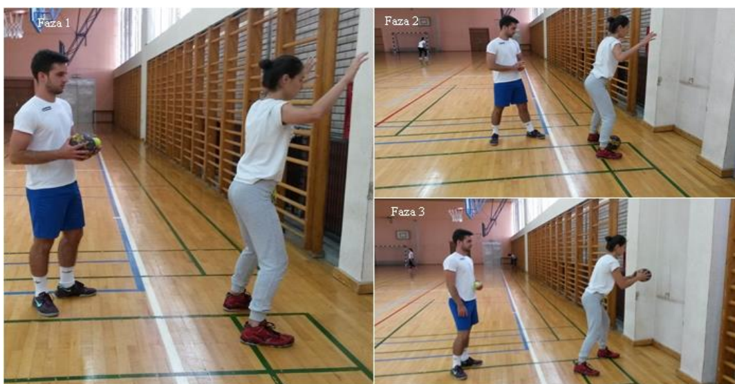
Slika 21. Hvatanje rukometne lopte prolaskom kroz noge