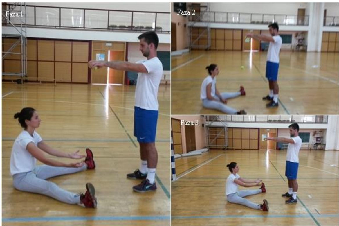
Slika 15. Hvatanje lopte u sjedu

OPIS: Vježba se izvodi u paru. Početna pozicija, prvi vježbač sjed ražnožno, predručiti, drugi vježbač raskoračni stav, predručiti s lopticama (faza 1), drugi vježbač ispušta proizvoljno jednu lopticu (faza 2), prvi vježbač hvata lopticu (faza 3).