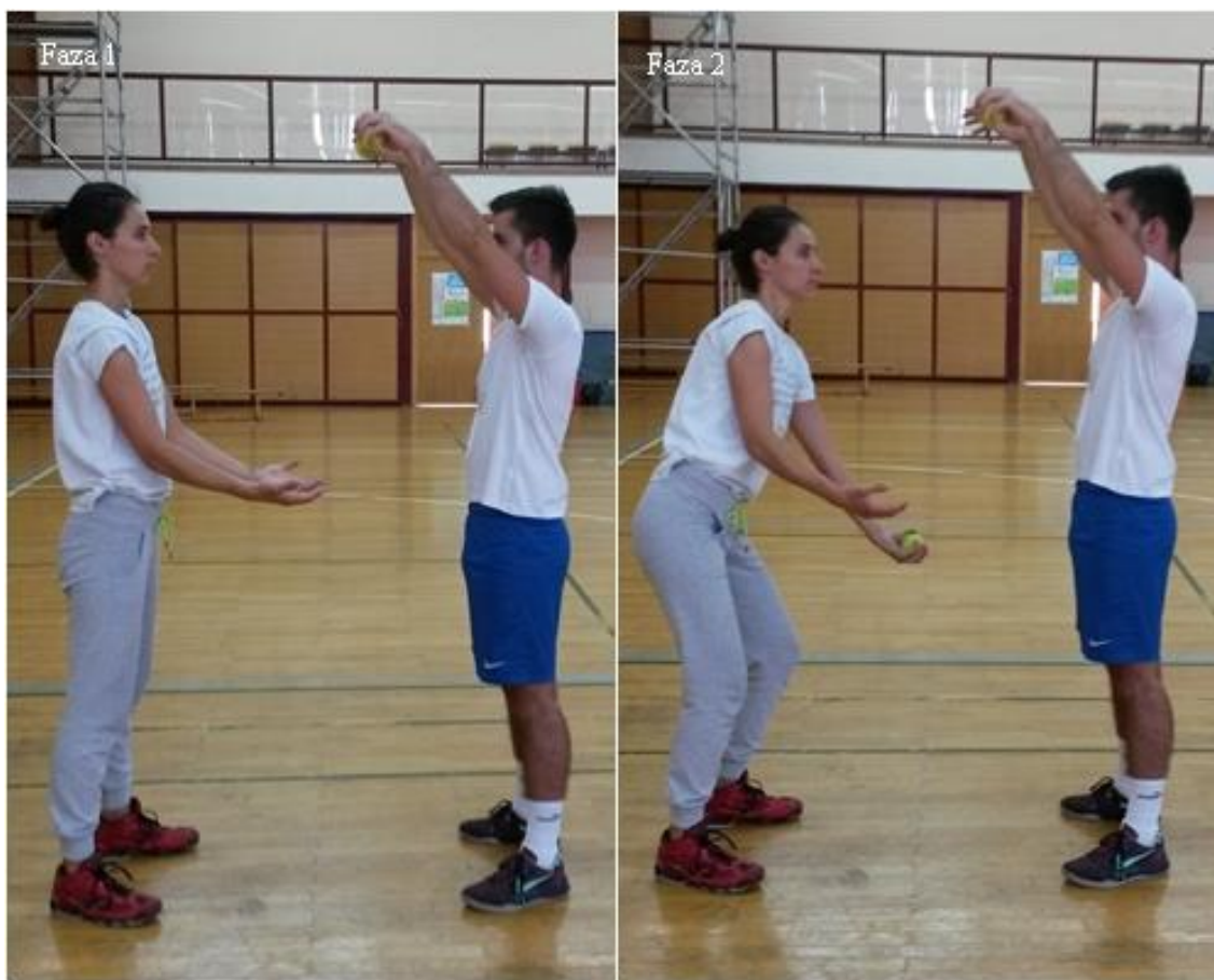
Slika 20. Hvatanje teniske loptice

OPIS: Vježba se izvodi u paru. Prvi vježbač predruči dolje, drugi vježbač predruči gore s teniskim lopticama (faza 1), drugi vježbač ispušta lopticu, prvi vježbač ju mora uhvatiti (faza 2).