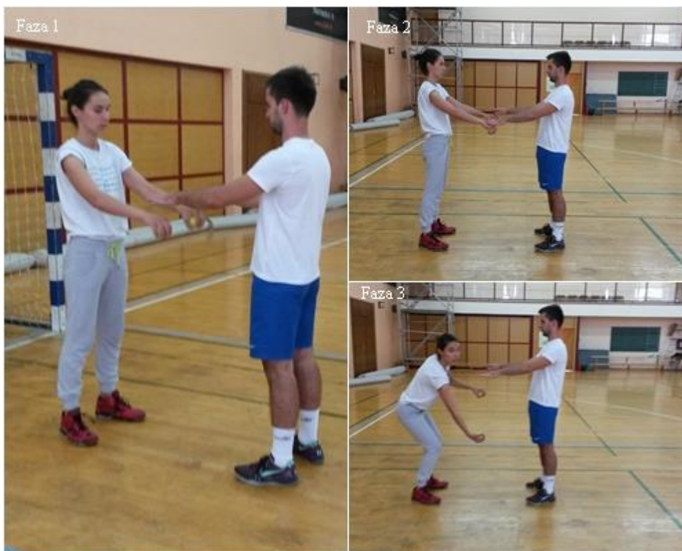
Slika 18. „Takac“ u predručenju

OPIS: Vježba se izvodi u pravu. Raskoračni stav, prvi vježbač predruči s lopticama, drugi predruči (faza 1), „takac“, odnosno drugi vježbač dotakne lijevom rukom desnu nadlanicu prvog vježbača (faza 2), hvatanje loptice desnom (faza 3).