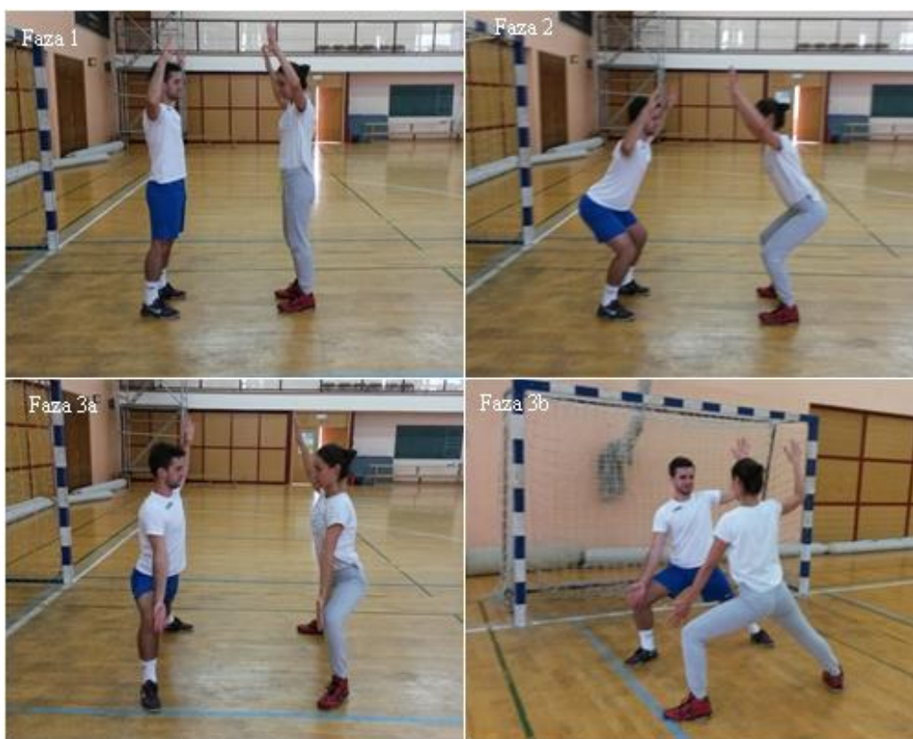
Slika 14. Čučanj – iskorak u stranu

OPIS: Vježba se izvodi u paru. Početna pozicija, osnovni vratarski stav (faza 1), čučanj, ruke u osnovnom vratarskom stavu (faza 2), iskorak u stran, jedna ruka prati nogu koja ide u iskorak, druga ostaje u osnovnom vratarskom stavu (faza 3a i 3b).