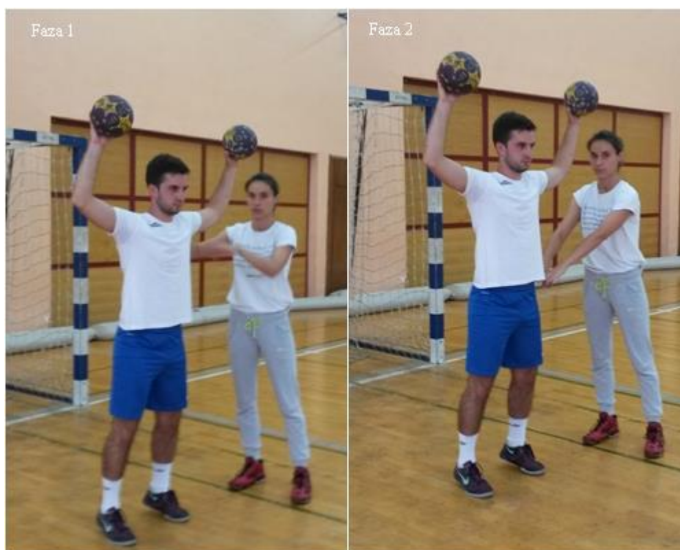
Slika 12. Izbacivanje iz ravnoteže

OPIS: Vježba se izvodi u paru. Osnovni vratarski stav s loptama, drugi vježbač stoji bočno od partnera te ga izbacuje iz ravnoteže guranjem u ramena (faza 1), osnovni vratarski stav s loptama, izbacivanje iz ravnoteže guranjem u kukove (faza 2).