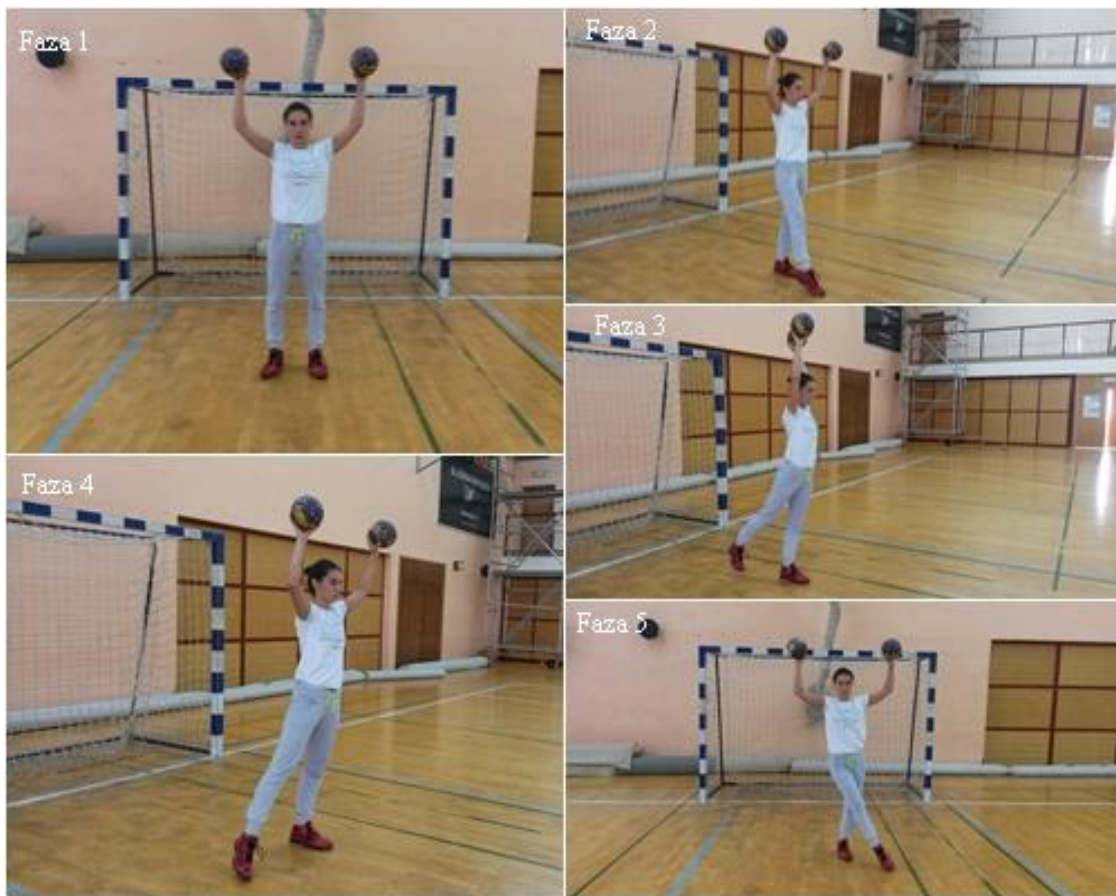
Slika 11. „Križ“

OPIS: Početna pozicija, osnovni vratarski stav s loptama (faza 1), osnovni vratarski stav sa prednoženjem desne (faza 2), osnovni vratarski stav sa zanoženjem desne (faza 3), osnovni vratarski stav sa odnoženjem desne (faza 4), osnovni vratarski stav sa prednoženjem desne u lijevo (faza 5).