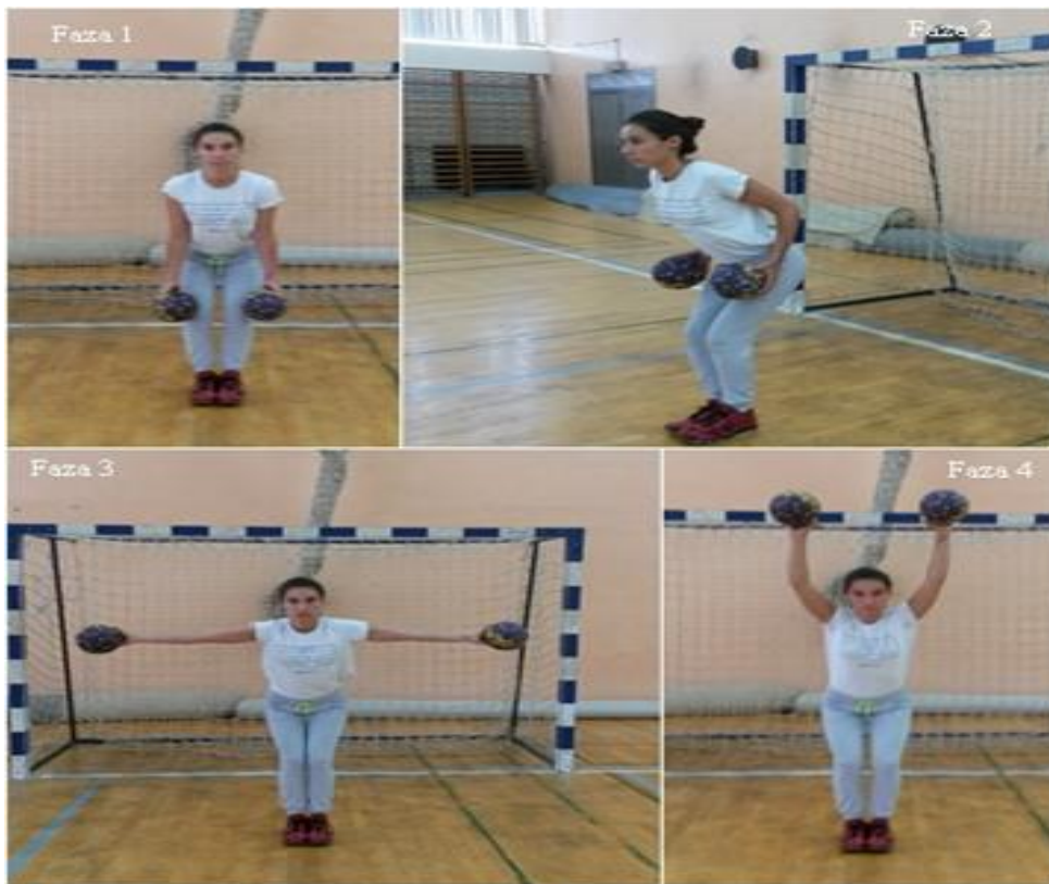
Slika 4. Imitacija branjenja niske lopte oko tijela

OPIS: Početna pozicija, počučanj, stav spetni, priručiti s loptom (faza 1), počučanj, stav spetni, spajanje lopatica, laktovi uz tijelo (faza 2) počučanj, stav spetni, , opružanje ruku do odručenja s loptom (faza 3), odnosno uzručenja s loptom (faza 4).