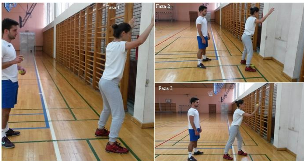
Slika 22. Hvatanje teniske loptice prolaskom kroz noge

OPIS: Vježba se izvodi u paru. Prvi vježbač zauzima osnovni vratarski stav, drugi vježbač ima loptu (faza 1), drugi vježbač baca loptu kroz noge prvog vježbača (faza 2), prvi vježbač hvata loptu (faza 3).