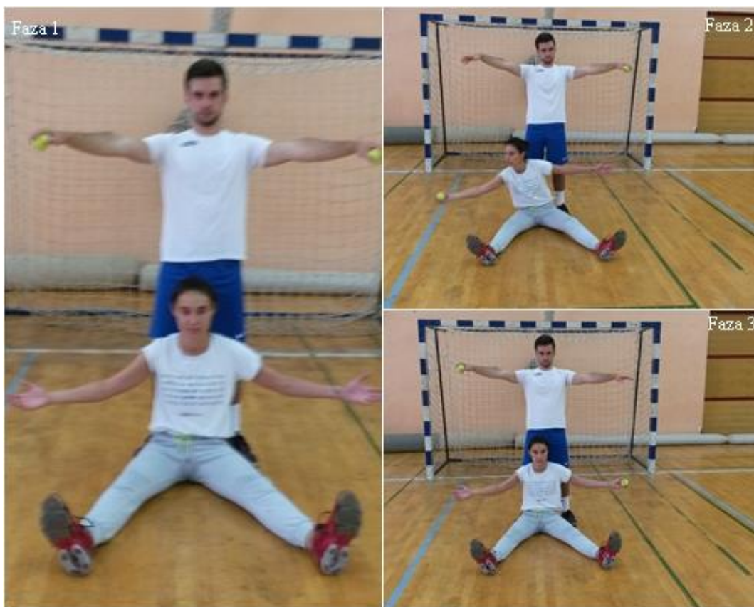
Slika 17. Hvatanje lopte u odručenju

OPIS: Vježba se izvodi u paru. Prvi vježbač, sjed raznožno, odručiti, drugi vježbač stoji iza leđa prvog vježbača, odručiti s lopticama (faza 1), naizmjenično izbacivanje loptice desno i lijevo (faza 2 i 3).