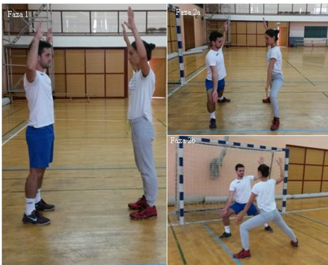
Slika 13. Iskorak u stranu

OPIS: Vježba se izvodi u paru. Početna pozicija, osnovni vratarski stav (faza 1), iskorak u stranu, 1 ruka prati nogu u iskoraku, druga ostaje u osnovnom vratarskom stavu (faza 2a i 2b).