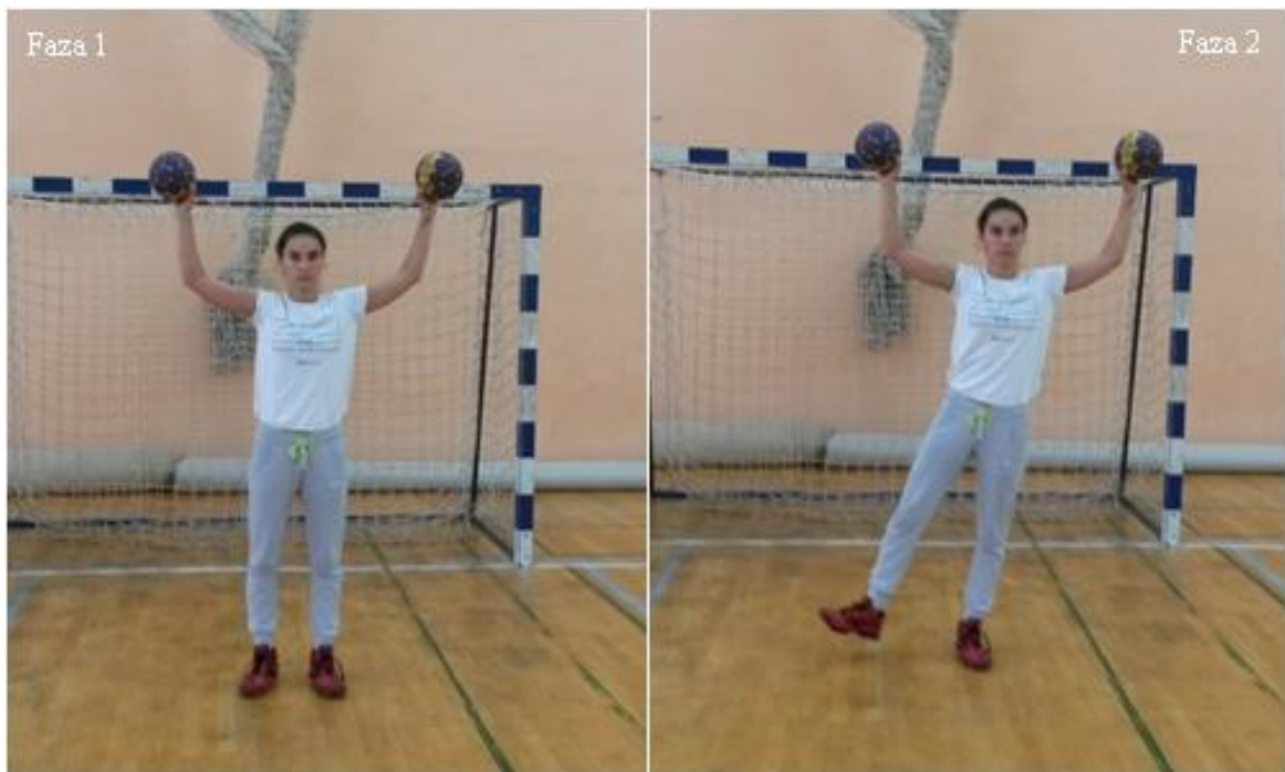
Slika 8. Odnoženje

OPIS: Početna pozicija, osnovni vratarski stav s loptama (faza 1), osnovni vratarski stav s loptama sa odnoženjem desne (faza 2).