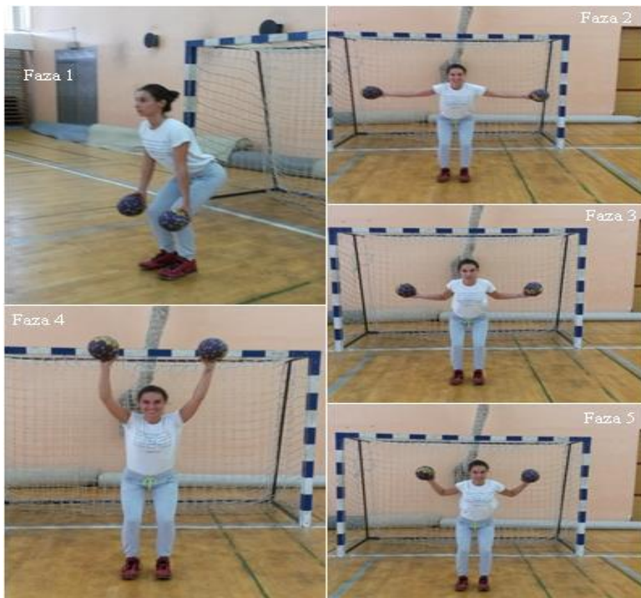
Slika 3. Imitacija branjenja niske i poluvisoke lopte

OPIS: Početna pozicija, počučanj, priručiti s loptom (faza 1), počučanj, odručiti s loptom (faza 2), radimo spajanje laktova iza leđa (faza 3). Iz te pozicije idemo do