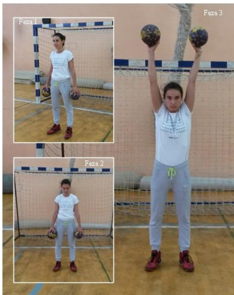
Slika 2. Naizmjenična depresija i elevacija