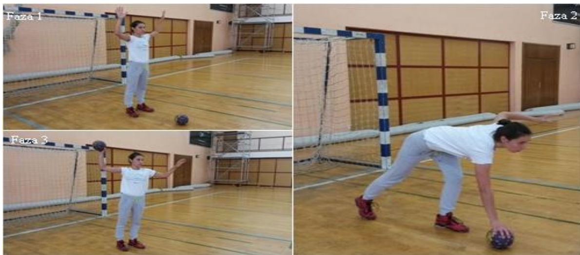
Slika 6. Imitacija dolaska po nisku loptu jednom rukom

OPIS: Početna pozicija, osnovni vratarski stav (faza 1), iskorak u natrag desnom, predručiti desnom uzimamo loptu, odručiti pogručeno lijevom (faza 2), uspraviti se, raskoračni stav, imitacija bacanja lopte u kontru (faza 3).