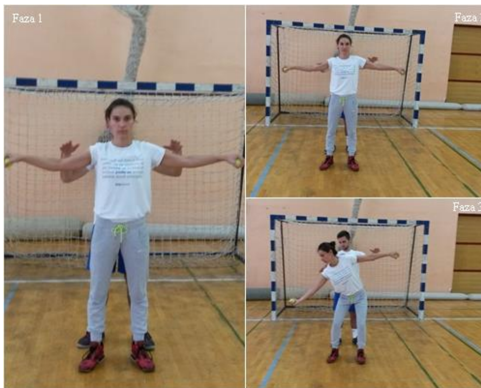
Slika 19. „Takac“ u odručenju

OPIS: Vježba se izvodi u paru. Prvi vježbač, raskoračni stav, odručiti sa lopticama, drugi vježbač stoji iza prvog vježbača (faza 1), drugi vježbač dotakne desno rame prvog vježbača (faza 2), hvatanje loptice (faza 3).