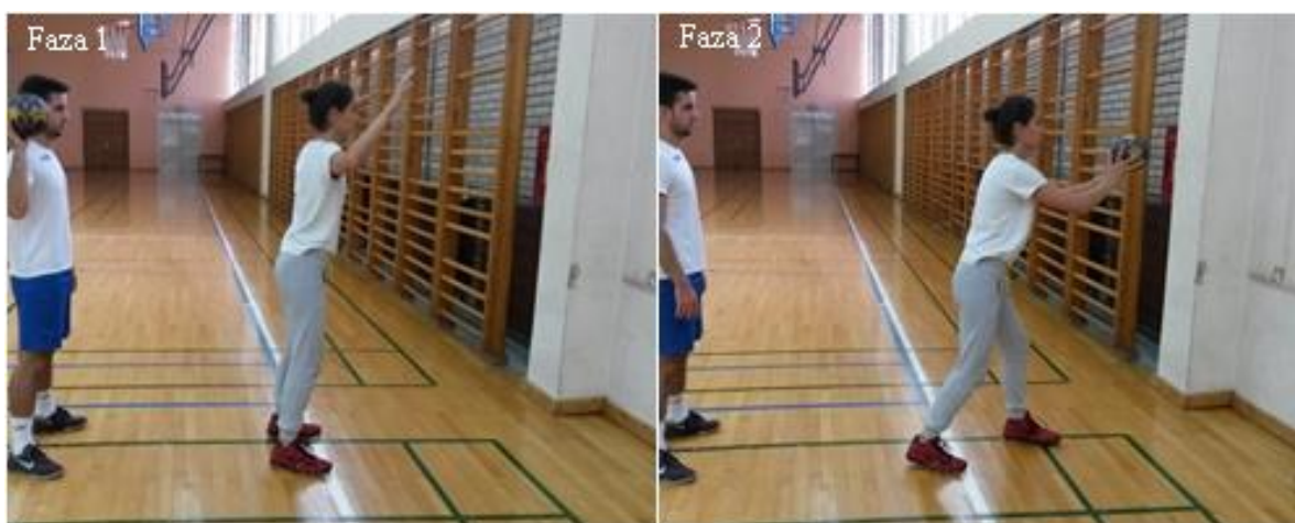
Slika 23. Hvatanje rukometne lopte odbijene od zida