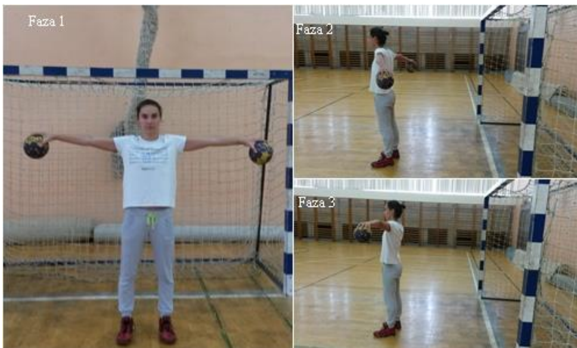
Slika 1. Mali bočni krugovi prema gore i prema dolje