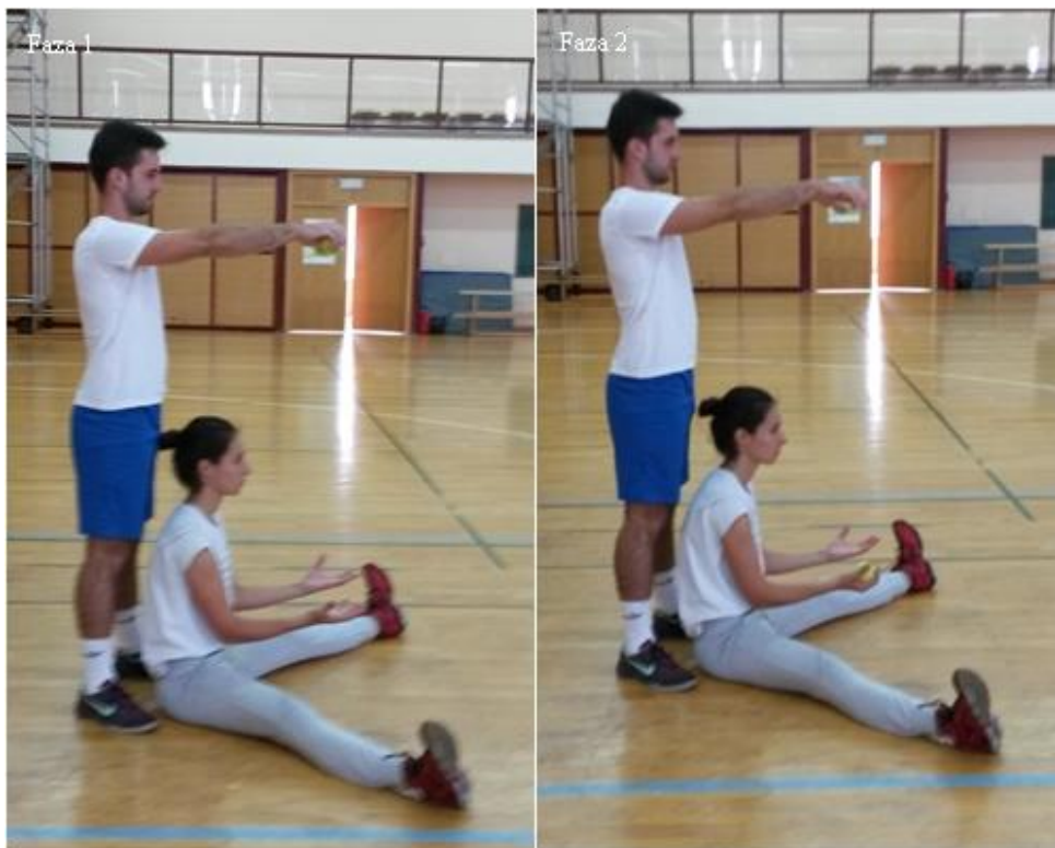
Slika 16. Hvatanje lopte u sjedu

OPIS: Vježba se izvodi u paru. Prvi vježbač, sjed raznožno, predručiti , drugi vježbač stoji iza leđa prvog vježbača, predručiti s lopticama (faza1), hvatanje loptice (faza 2).