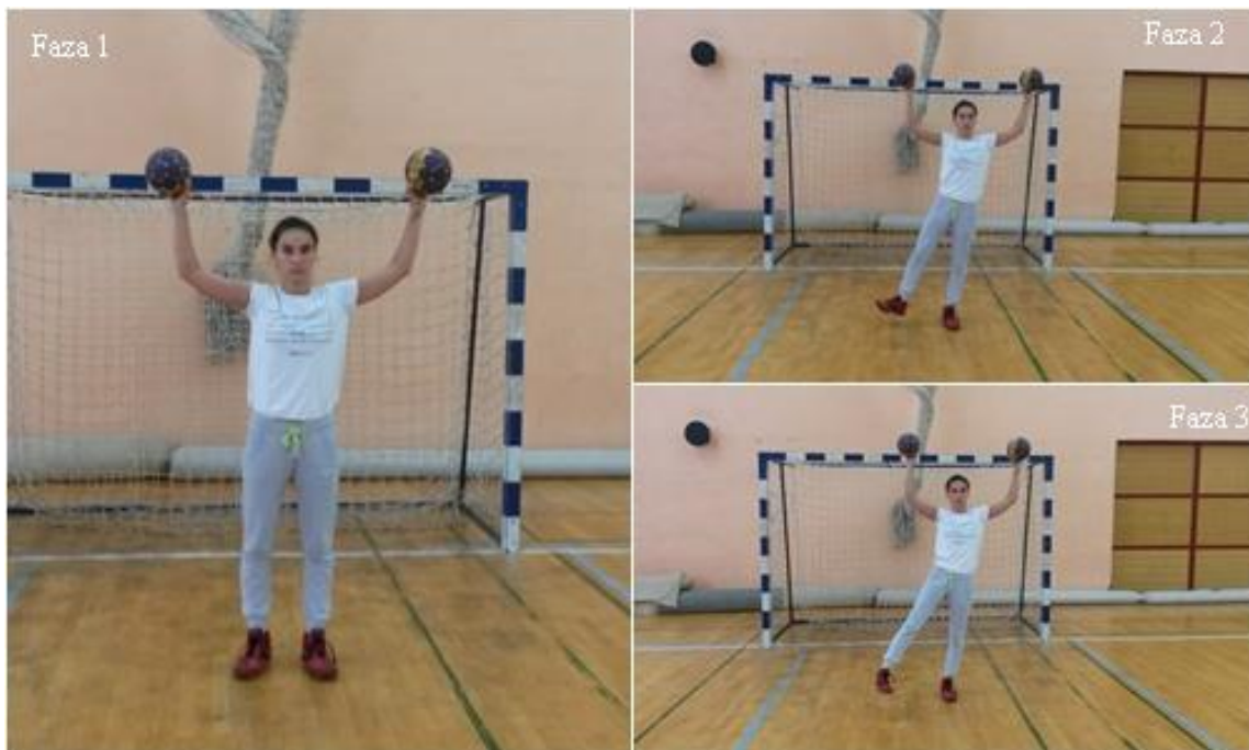
Slika 10. Everzija – inverzija sa odnoženjem

OPIS: Početna pozicija, osnovni vratarski stav s loptama (faza 1), osnovni vratarski stav s loptama, naizmjenična everzija (faza 2) i inverzija (faza 3) sa odnoženjem.