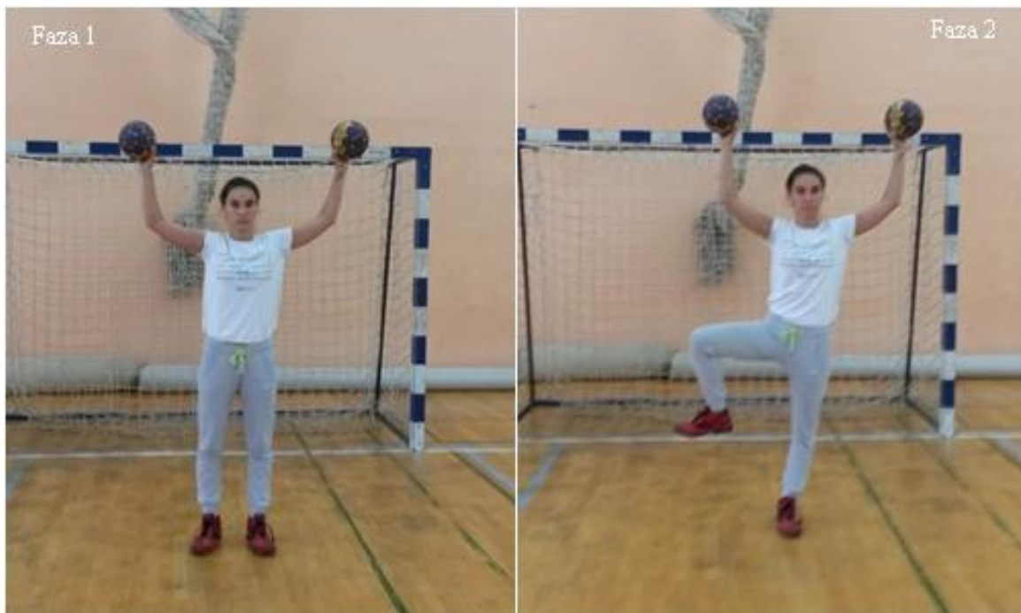
Slika 9. Odnoženje pogrčeno

OPIS: Početna pozicija, osnovni vratarski stav s loptama (faza 1), osnovni vratarski stav s loptama sa odnoženjem pogrčeno desne (faza 2).