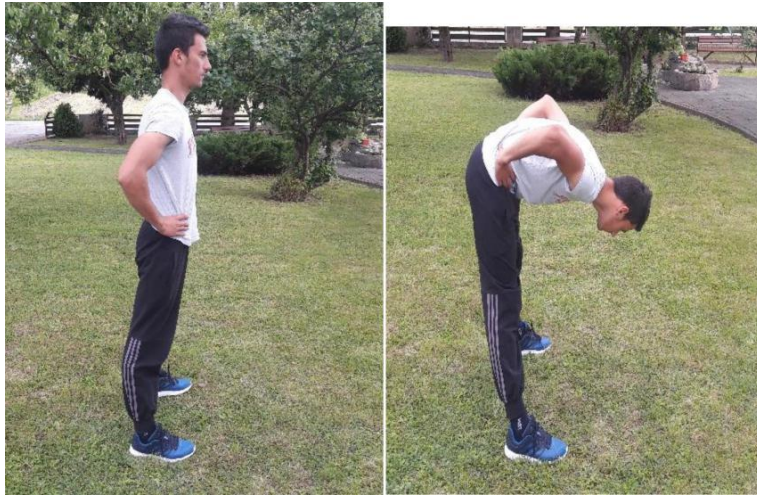
Slika 11. Pretklon trupa