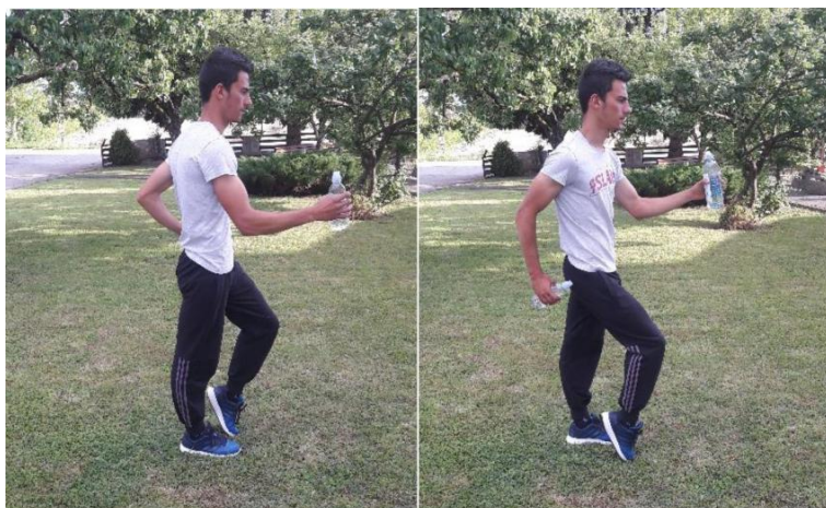
Slika 16. Srednji skip u mjestu