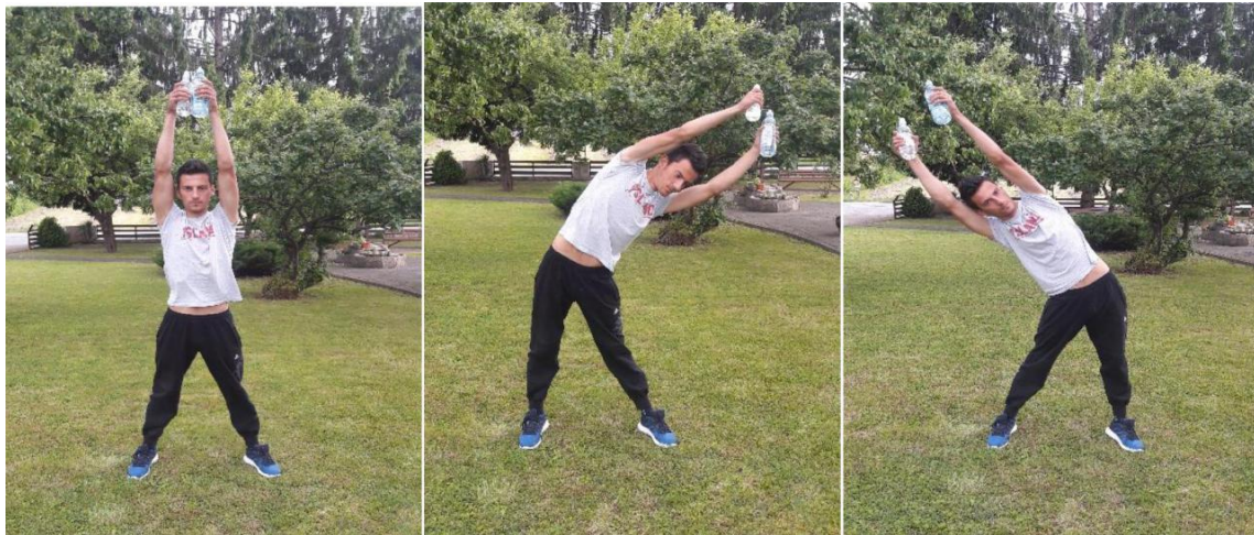
Slika 13. Otklon trupom

Broj ponavljanja: 10 ponavljanja u svaku stranu