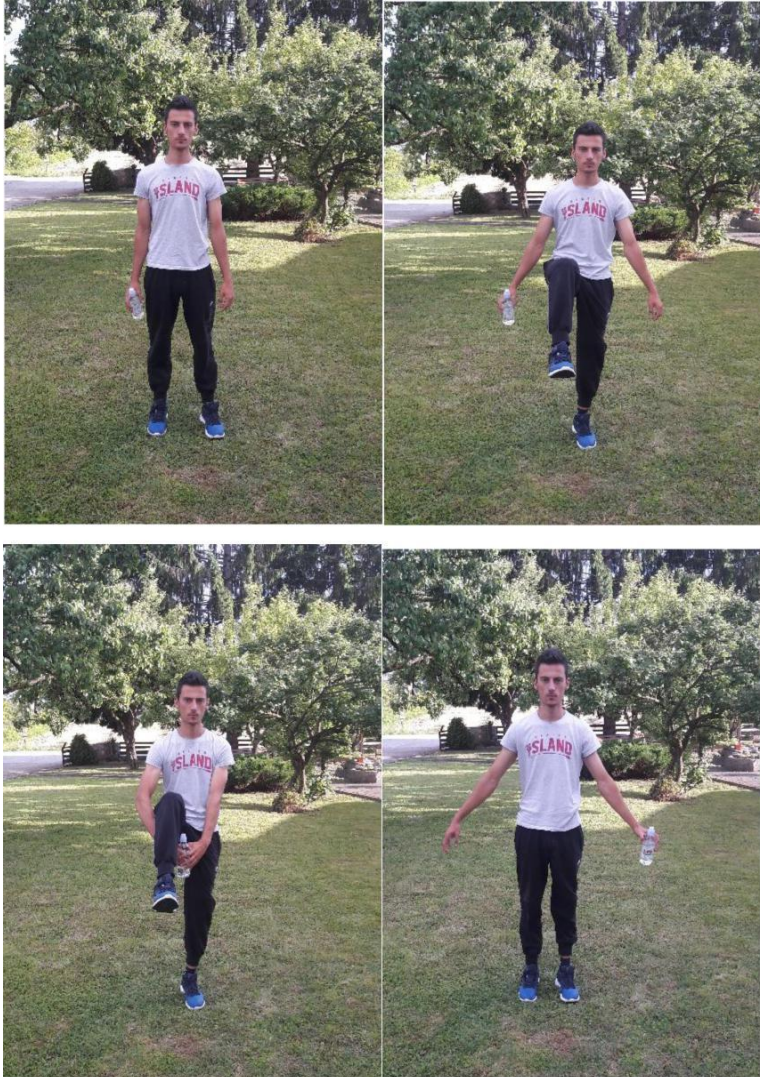
Slika 17. Podizanje natkoljenica

Broj ponavljanja: 10 podizanja svake noge