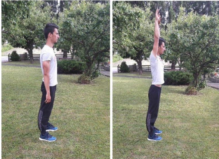
Slika 7. Uzručenje

Broj ponavljanja: Izvodi se 10 ponavljanja