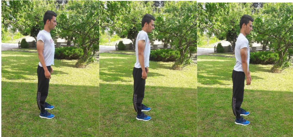
Slika 5. Kruženje ramenima

Broj ponavljanja: Izvodi se 10 po kruženja prema naprijed i prema natrag.