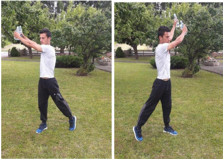
Slika 9. Zasuci trupom

Broj ponavljanja: Izvodi se 10 ponavljanja