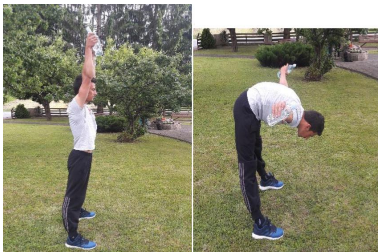
Slika 12. Pretklon trupom s odručenjem