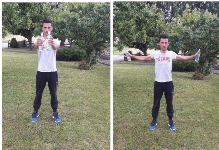
Slika 8. Spajanje lopatica