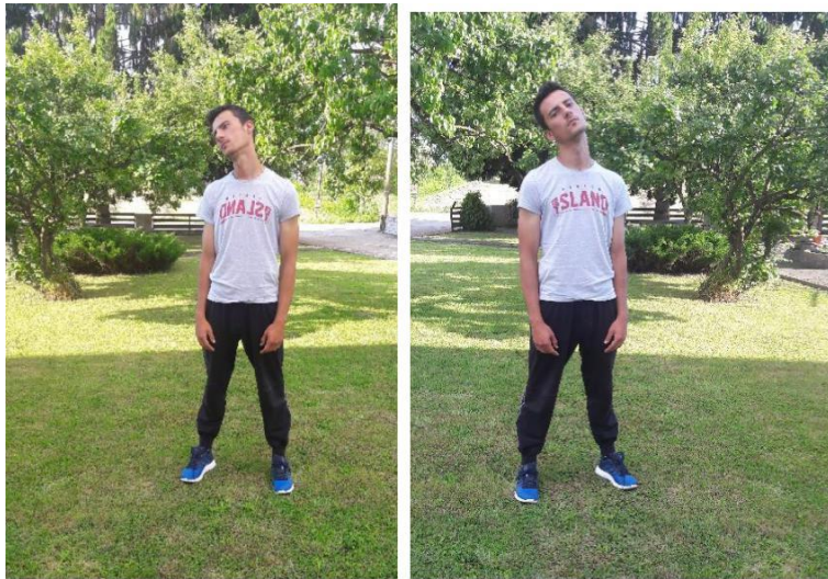
Slika 3. Kruženje glavom

Trajanje: po 10 ponavljanja u lijevu i desnu stranu