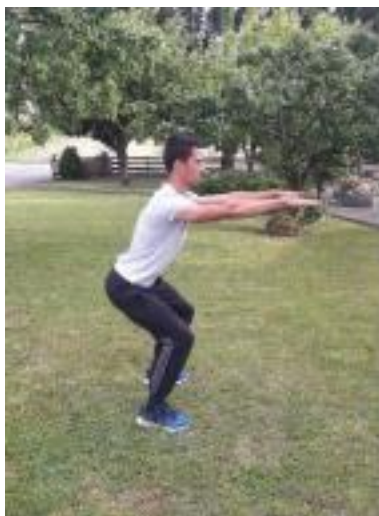
Slika 14. Čučnjevi