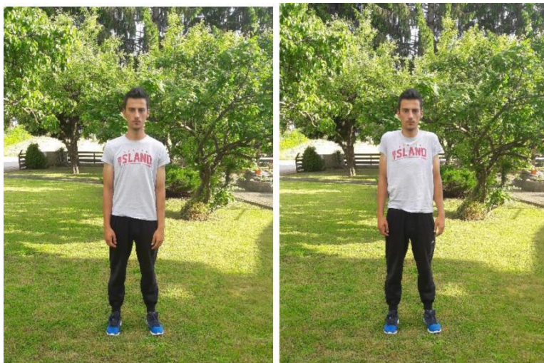
Slika 6. Podizanje ramena

Broj ponavljanja: Izvodi se 15 podizanja lijevog i desnog ramena