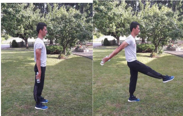
Slika 15. Prednoženje sa zaručenjem

Broj ponavljanja: Izvodi se 10 ponavljanja