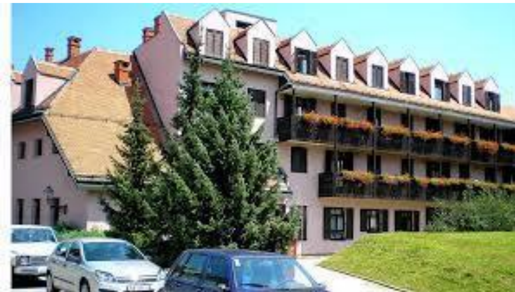
Slika 2. Starački dom Sveti Antun Karlovac

Osim tjelesnih aktivnosti koje su navedene u prethodnome poglavlju, postoji i čitav niz od različitih vježbi disanja do jednostavnih struktura gibanja i vježbi, koje starije osobe mogu izvoditi u više navrata tijekom jednog dana. Stoga će ovo poglavlje biti namijenjeno prikazu nekih od tih vježbi. Program vježbi rađen je za Dom umirovljenika „Sveti Antun“ Karlovac. Jedini je to državni dom u gradu Karlovcu koji pruža kvalitetnu njegu i zdravstvenu skrb osobama starije životne dobi. Kapacitet doma je 222 korisnika koji su podijeljeni u dvije vrste smještaja. Stambeni smještaj, na koji se smještaju korisnici koji mogu samostalno živjeti ima kapacitet od 141 korisnika, dok bolnički smještaj koji pruža 24-satnu zdravstvenu njegu ima smještajni kapacitet od 81 korisnika. Ovaj program vježbi je rađen je za osobe koje su pokretne i sposobne za samostalan život, odnosno ovih 141 korisnika. Dom je smješten u samom centru grada na rubu karlovačkih parkova. Ustanova se nalazi u prirodnom okruženju u blizini rijeke Korane (Slika 2). Također oko doma se nalaze mnoge šetnice te zelene površine na kojima bi umirovljenici ove vježbe mogli provoditi na svježem zraku.