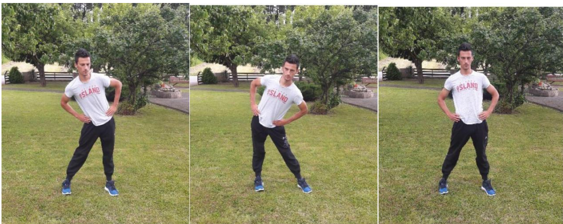
Slika 10. Kruženje kukovima

Broja ponavljanja: 10 kruženja u svaku stranu