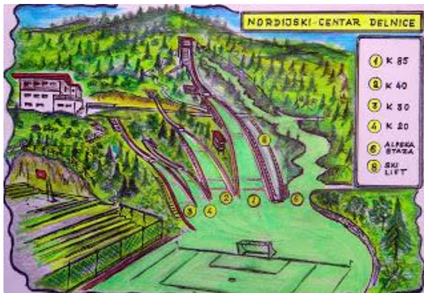
Slika 2. Prikaz plana izgradnje Nordijskog centra Delnice

“Grad Delnice u izgradnju je prateće infrastrukture ovih objekata uložio je 138000 kuna, a svota potrebna za daljnje radove vezane uz postavljanje pragova i plastike još nije određena, iako se zna da će plastika biti postavljena na skakaonice od 8 i 25 m, dok za trideset metarsku skakaonicu postoji obećanje Međunarodnog olimpijskog komiteta koji će taj novac osigurati iz sredstava solidarnosti. No, to, kao i radovi na izgradnji četrdeset pet metarske skakaonice, odnosno proširenja sedamdeset metarske na skakaonicu od 80-85 m sada su u drugom planu. Najbitnije je prije jeseni urediti ove dvije male skakaonice kako bi mali goranski skakači i skakačice napokon mogli svakodnevno trenirati u Delnicama” (Grad Delnice zeleno srce Hrvatske, 2009).