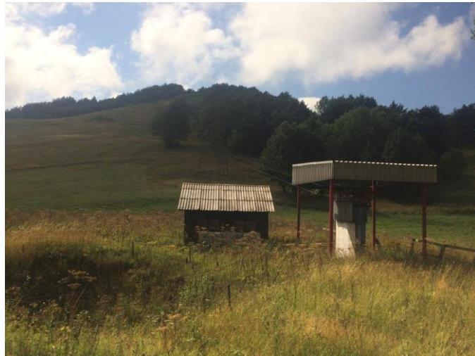
Slika 11. Prikaz dijela skijališta u Begovom Razdolju u ljeto 2017. godine

Skijalište Begovo Razdolje nalazi se točno preko puta hotela “Jatreb” i dio je Olimpijskog centra Bjelolasica koji danas nije u funkciji. Inače je najviše naseljeno mjesto u Hrvatskoj koje se nalazi na 1078 mnv. Skijalište ima jednu stazu duljine 1000 m i vučnicu Sidrašicu duljine 400 m koja se penje na Klobučarev vrh (1215 m). Mjesto je okruženo planinama i šumskim stazama te je idealno za visinske pripreme sportaša i planinarenje. Staza je na vrhu dosta uska, spuštajući se prema dolje je sve šira. Vrh je često opasan zato što se brzo napravi led koji uglavnom stvara probleme. Ovdje je rođen Jakob Mihelčić, jedan od prvih hrvatskih planinarskih vodiča, koji je otkrio Bijeje i Samarske stijene, a one su danas strogi rezervat prirode (Muhvić, 2004).