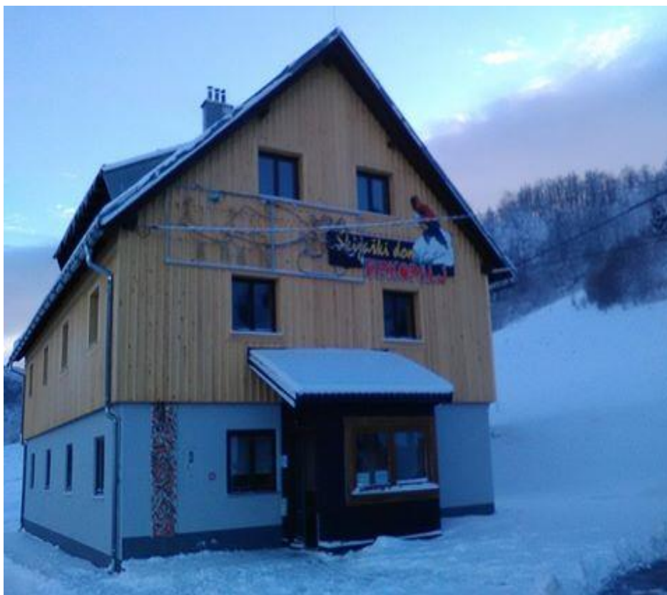
Slika 9. Skijaški dom “Mrkopalj”

Nedavno je otvoren hostel uz samo skijalište sa smještajnim kapacitetom od šest dvokrevetnih i dvije četverokrevetne sobe uz odličnu gastronomsku ponudu i pristupačne cijene. U hostelu se također organiziraju različite skijaške zabave i priredbe. Također u domu postoji mogućnost iznajmljivanja skijaške opreme, ski servis i licencirani učitelji za ski školu.