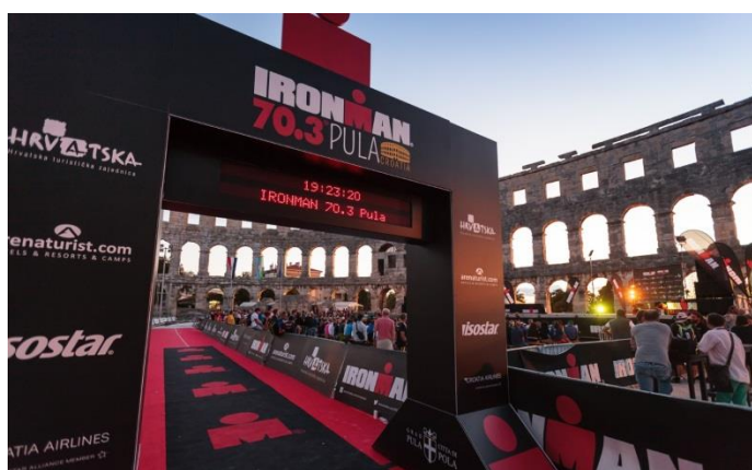
Slika 17. Cilj Ironman utke u Pulskoj Areni 18

Osim toga, dan ranije organizirana je dječja utrka „Ironkids“ kao popratni event, kojom se promovirala glavna utrka i njome su se otvorile mogućnosti daljnje tradicijske organizacije dječje utrke (Ironman 70.3 Pula, 2016).