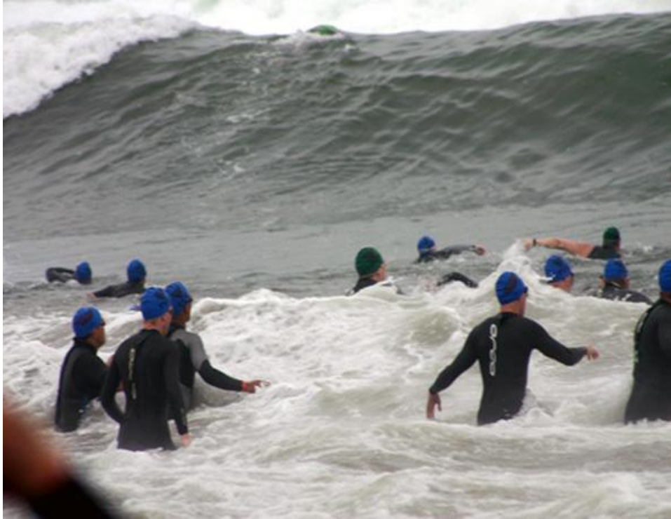
Slika 1. Triatlonci plivaju uz velike valove.

a pogotovo disanja i podvodnog dijela zaveslaja te takvu tehniku nesvjesno koristiti u otvorenim vodama te moći većinu koncentracije usmjeriti na orijentaciju.