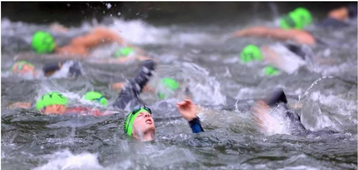
Slika 3. Plivač se suočava sa bolovima spazma.

Strahovi se manifestiraju raznim fiziološkim promjenama od kojih razlikujemo ubrzani srčani ritam, povišeni krvni tlak, povećanje mišićnog tonusa, lučenje adrenalina, sušenje usta, ubrzano disanje i druge. Navedeni strahovi se mogu manifestirati na način da natjecatelj tokom utrke počinje paničariti uslijed čega može doći do gušenja , zatajenja srca, smrti i šoka.