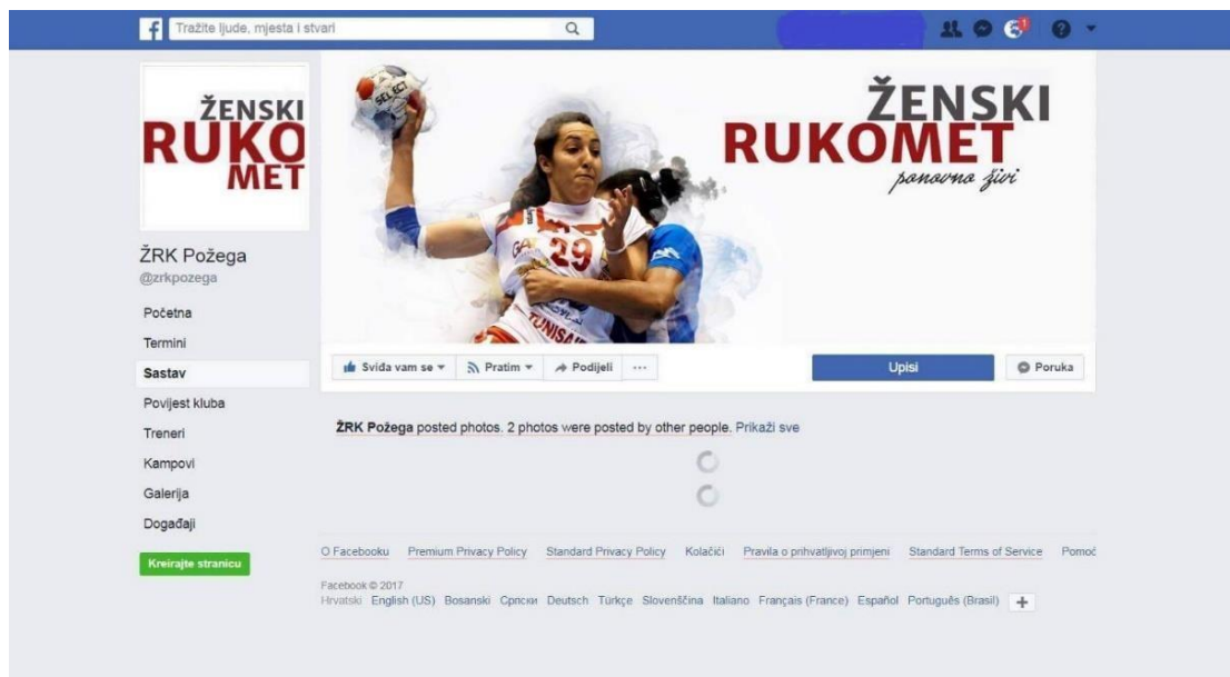
Slika 6. Primjer izgleda Facebook stranice Kluba