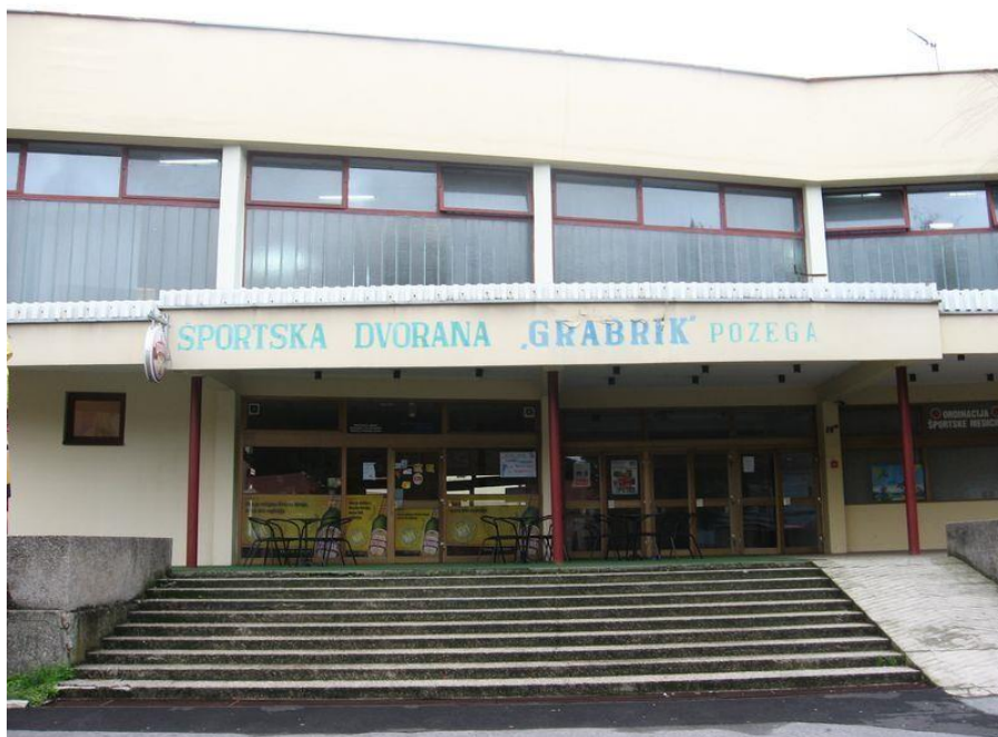
Slika 3. Sportska dvorana Grabrik