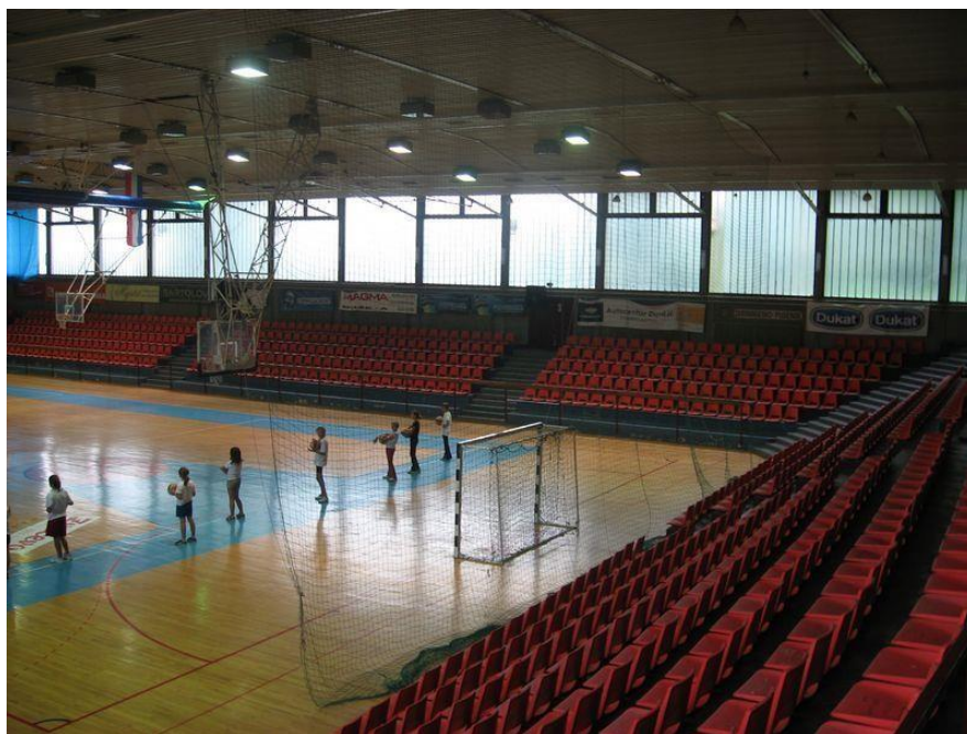
Slika 4. Unutrašnjost sportske dvorane Grabrik