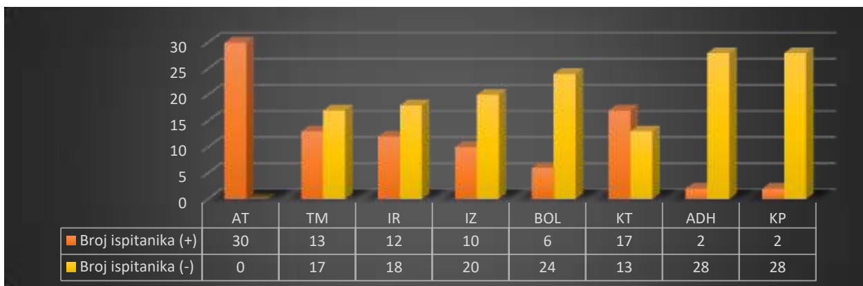
Prikaz 1. Brojčano prikazani rezultati