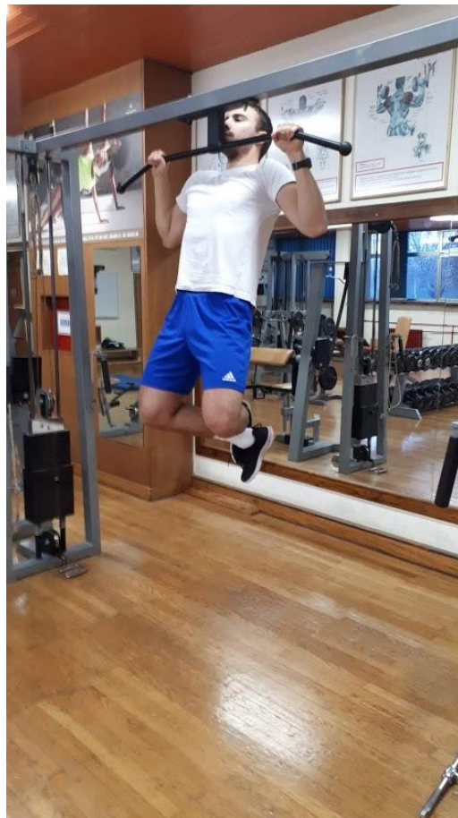
Slika 2. Prikaz zgibova sa i bez gurtne.