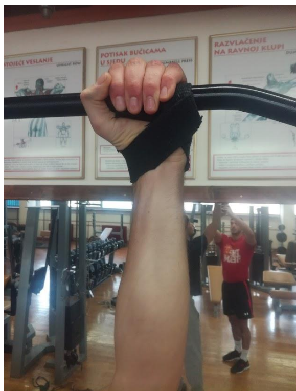
Slika 3. Prikaz postavljanja gurtne.