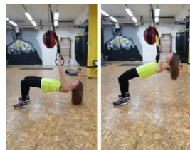
Slika 28. Podizanje tijela iz visa (zgib) na trx-u - vježba za leđa