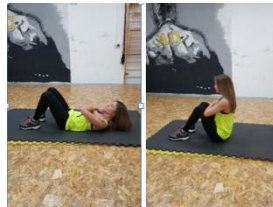
Slika 24. podizanje trupa iz ležanja na leđima- vježba za prednji dio "cora"