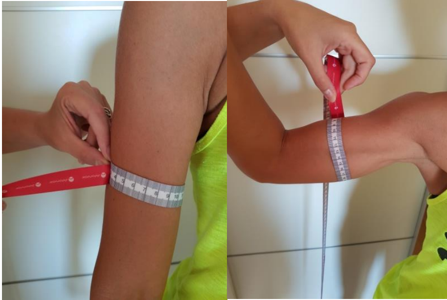
Slika 3. Mjerenje opsega nadlaktice centimetarskom vrpcom

decimalu (npr. 23,2 cm). Opseg nadlaktice u fleksiji određuje se na istom mjestu samo je ruka flektirana u lakatnom zglobu.