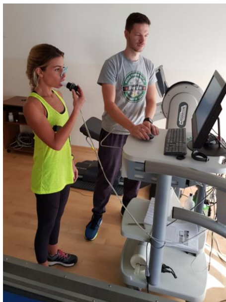
Slika 18. Mjerenje spirometrije

Nakon faze mirovanja u trajanju od 1 minute test započinje hodanjem pri brzini od 3 km/h koje traje 2 minute, nakon toga se brzina sagra povećava svakih 30" za 0,5 km/h uz konstantan nagib sagra od 1,5%. Ispitanice će hodati do 6 km/h nakon čega će promijeniti vrstu lokomocije u trčanje. Za utvrđivanje dostignuća maksimalnih vrijednosti u testu koristi će se kriteriji: porast VO_2 dostiže plateau (porast manje od 2 mL/kg/min ili <5%) s porastom opterećenja, frekvencija srca unutar je 10 otkucaja/min ili 5% u odnosu na predviđeni maksimum za dob, RQ (respiracijski kvocijent) >1,10 ili >1,15, VE/VO_2 (dišni ekvivalent) > 30, subjektivni osjećaj iscrpljenja iznosi – 13 bodova po modificiranoj Borgovoj ljestvici. Ispitanice će u oporavku nastaviti hodati 2 minute pri brzini od 5 km/h, uz daljnje praćenje spiroergometrijskih parametara. Subjektivna procjena opterećenja bit će procijenjena i kvantificirana upotrebom modificirane Borgove skale.