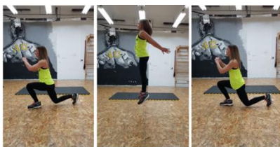
Slika 32. Iskoraci sa skokom- vježba za noge