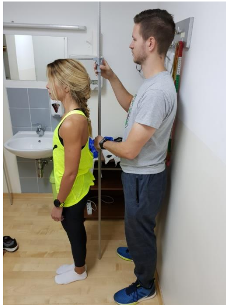
Slika 1. Mjerenje visine tijela