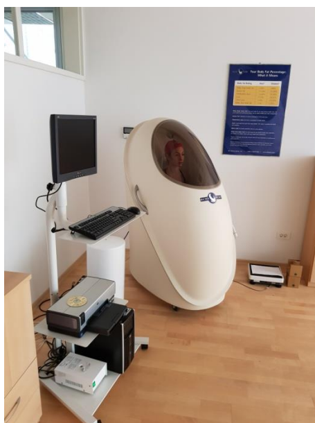
Slika 21. Zračna pletizmografija (BOD-POD)