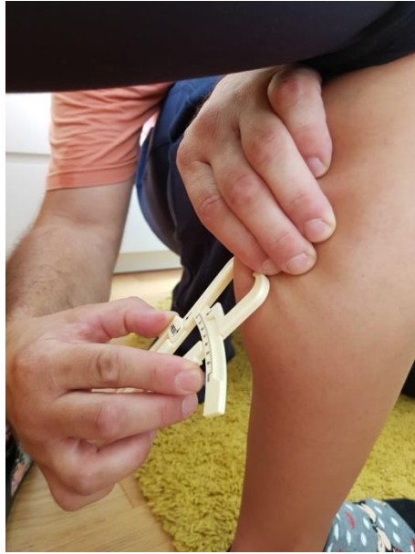
Slika 15. Nabor potkoljenice