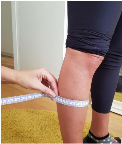
Slika 7. Mjerenje opsega potkoljenice centimetarskom vrpcom