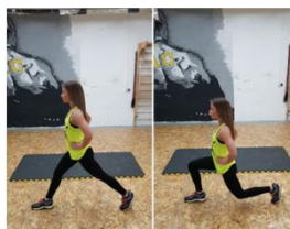
Slika 54. Iskoraci- vježba za noge