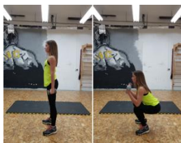
Slika 33. Polučučanj + pregib podlakticama - vježba za ruke (m. biceps brachi)