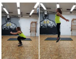
Slika 35. Čučanj skok- višezglobna cardio vježba (vježba za noge)