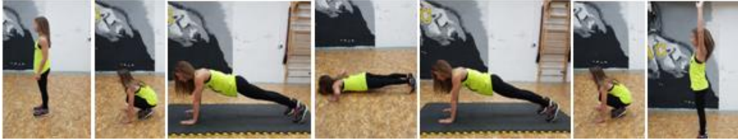
Slika 23. "Marinac"- višezglobna cardio vježba