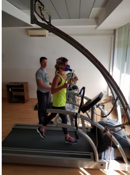
Slika 19. Progressivni test opterećenja na pokretnom sagu KF1