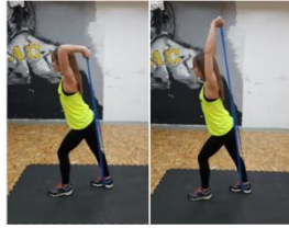
Slika 51. Potisak podlakticama "pilates gumom"- vježba za ruke (m. triceps)