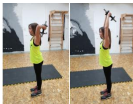
Slika 29. Potisak podlakticama bučicom - vježba za ruke (m. triceps)