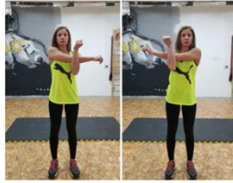
Slika 36. Vježba istezanja- m. deltoideus