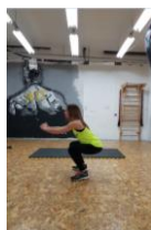
Slika 48. Izdržaj u polučučnju - vježba statičke snage