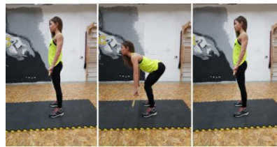
Slika 56. Tehnika izvođenja mrtvog dizanja s drvenom palicom ili s malom bučicom (4 kg)