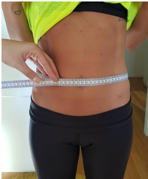
Slika 8. Mjerenje opsega trbuha centimetarskom vrpcom