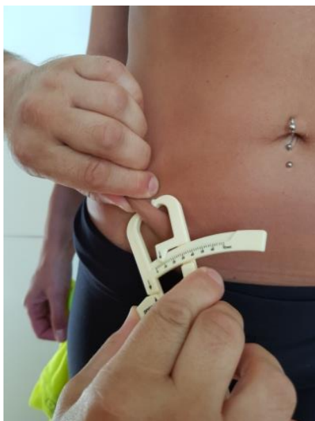
Slika 13. Nabor suprailiokristalno