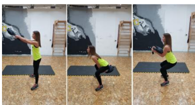
Slika 34. Nabačaj "bugarskom vrećom" iz swinga- višezglobna cardio vježba