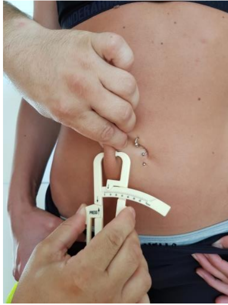
Slika 12. Nabor trbuha