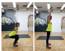
Slika 31. Polučučanj + potisak bučicama stojeći - vježba za ramena