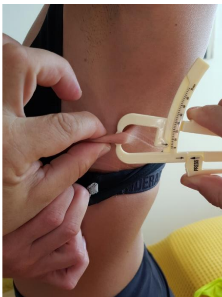
Slika 17. Nabor aksilarno