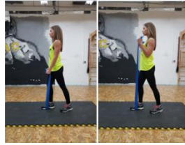
Slika 55. Pregib podlakticama "pilates gumom"- vježba za ruke (m. biceps brachi)