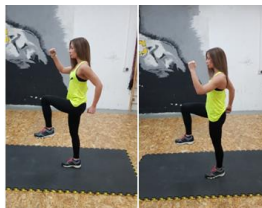
Slika 26. Visoki skip u mjestu - višezglobna cardio vježba