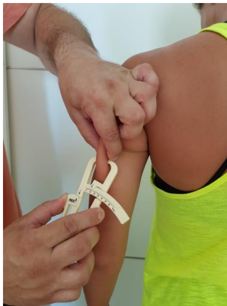
Slika 9. Nabor nadlaktice