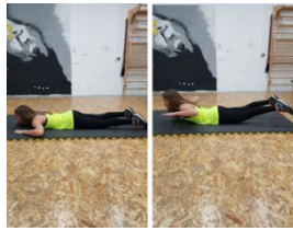
Slika 27. Podizanje trupa i nogu iz ležanja na prsima - vježba za stražnji dio "cora"