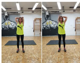
Slika 60. Vježba istezanja - m. triceps