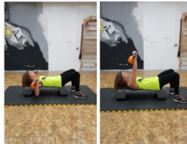
Slika 25. Potisak girjama iz ležanja na leđima - vježba za prsa