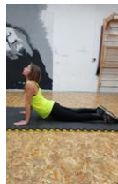
Slika 64. Vježba istezanja - mišići prednjeg dijela "cora"