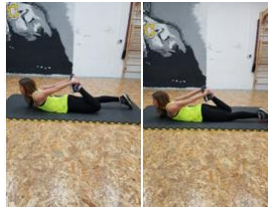
Slika 41. Vježba istezanja - m. kvadriceps