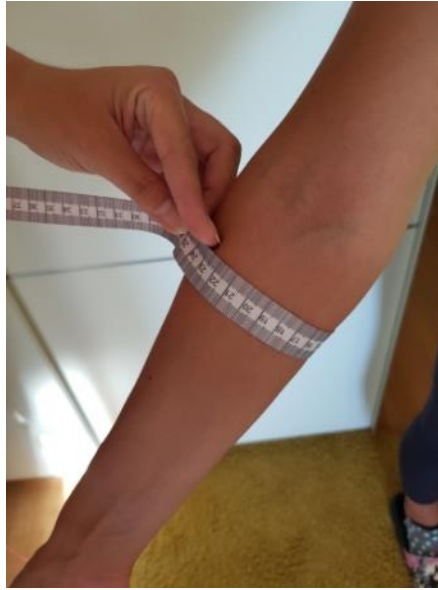
Slika 4. Mjerenje opsega podlaktice centimetarskom vrpcom