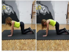
Slika 43. Vježba istezanja - mišići stražnjeg dijela "cora"