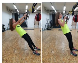
Slika 50. Podizanje tijela iz kosog visa – 45° (zgib) na trx-u- vježba za leđa