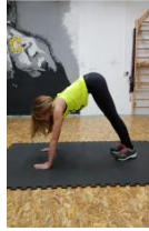
Slika 66. Vježba istezanja – mišići stražnjeg dijela potkoljenice

10. upor prednji s podignutim kukovima i petama na tlu - stražnji dio potkoljenice