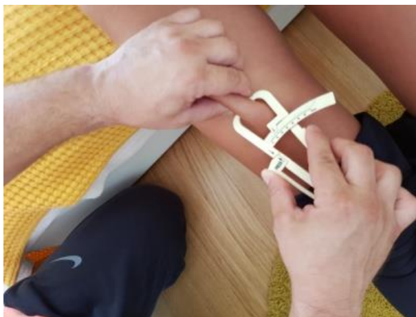
Slika 14. Nabor natkoljenice