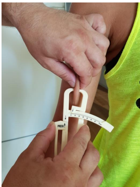
Slika 16. Nabor biceps