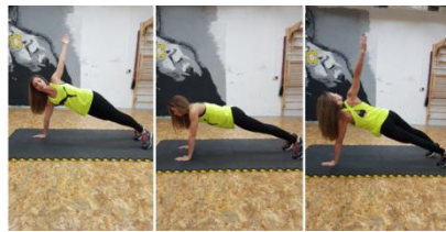
Slika 52. Prelazak iz upora prednjeg na lijevoj ruci sa zasukom u upor prednji na desnoj ruci sa zasukom