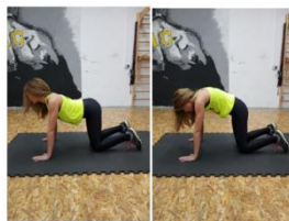
Slika 65. Vježba istezanja - mišići stražnjeg dijela "cora"