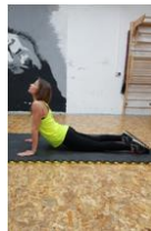
Slika 42. Vježba istezanja - mišići prednjeg dijela "cora"