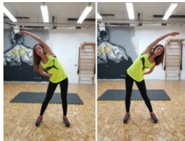
Slika 38. Vježba istezanja- m. latissimus dorsi