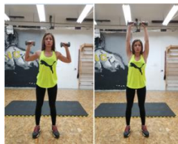
Slika 53. Potisak bučicama stojeći - vježba za ramena