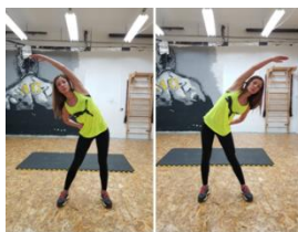
Slika 59. Vježba istezanja- m. latissimus dorsi