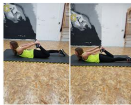
Slika 63. Vježba istezanja - m. kvadriceps