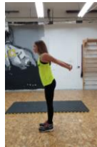
Slika 37. Vježba istezanja m. pectoralis major i m. biceps brachi