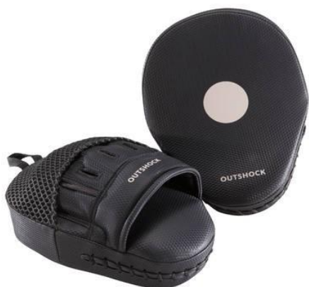
Slika 12. Fokuseri.