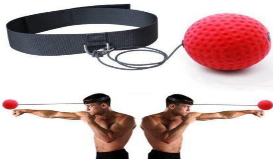
Slika 13. Refleks loptica.

Što se tiče boksačkih rekvizita, fokuserima se mogu postići najspecifičniji uvjeti boksačkog meča gdje protivnik ( a u ovom slučaju je to trener) izvodi kontraudarce i kretnje te može izmaknut fokuser. U tim slučajevima nije samo fokus na preciznosti.