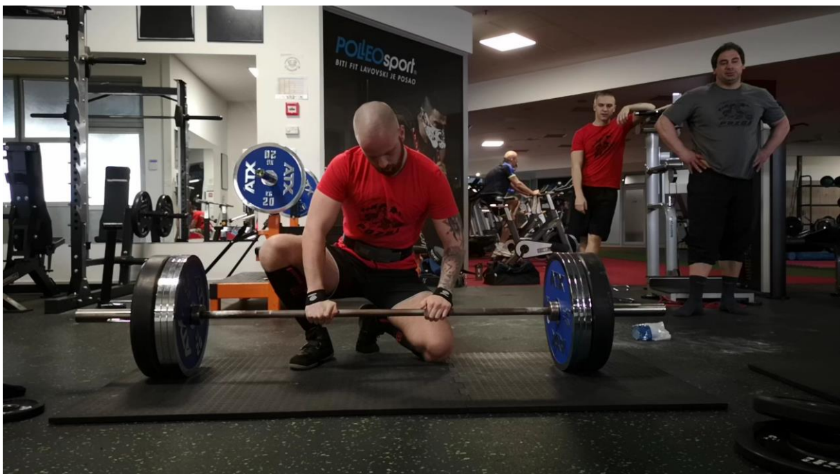
Slika 5. Prikaz pripreme za mrtvo dizanje korištenjem gurtne (uvjet 3).