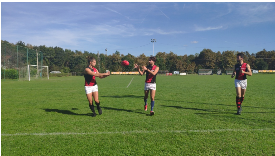
Slika 9. Dodavanje rukom u formaciji „trojke“

Vježbači formiraju tri kolone te izvode dodavanje u kretanju s promjenom pozicija (slika 9) po principu metodskih vježbi koje se koriste npr. u nogometu, rukometu i košarci. Vježbač koji dodaje loptu kreće iz srednje kolone te zauzima mjesto igrača kojem je uputio loptu i čeka sljedeću izmjenu i tako se nastavlja vijugavo kretanje i izmjena pozicija sve do bočne linije terena. Pored samog dodavanja, zadatak je i konstantno trčanje umjerenim tempom određenog brojem metara. U početku vježba se izvodi prelaženjem 20 metara te se progresivno proširuje obujam zadanog terena za vježbanje na 30 m, 40 m, 50 m itd.