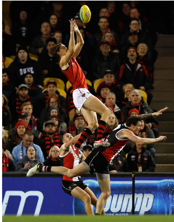
Slika 2. Hvatanje lopte (mark)

igrača dotakne, igra se nastavlja. Zadatak obrambenih igrača je onemogućiti napadačima da ostvare željeni mark, izbijanjem lopte dlanom ili šakom, što se naziva „spoil“ te napadanjem i dozvoljenim ometanjem suparničkih igrača kako bi im onemogućili ostvarivanje kontrole nad loptom.