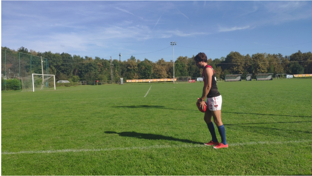
Slika 10. Zauzimanje osnovnog stava za dodavanje nogom