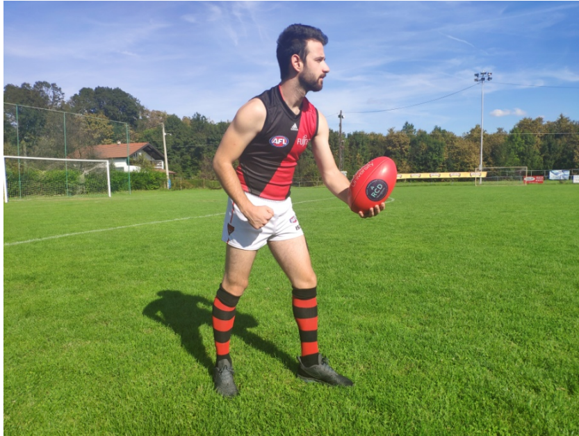
Slika 6. Zauzimanje osnovnog stava za dodavanje rukom