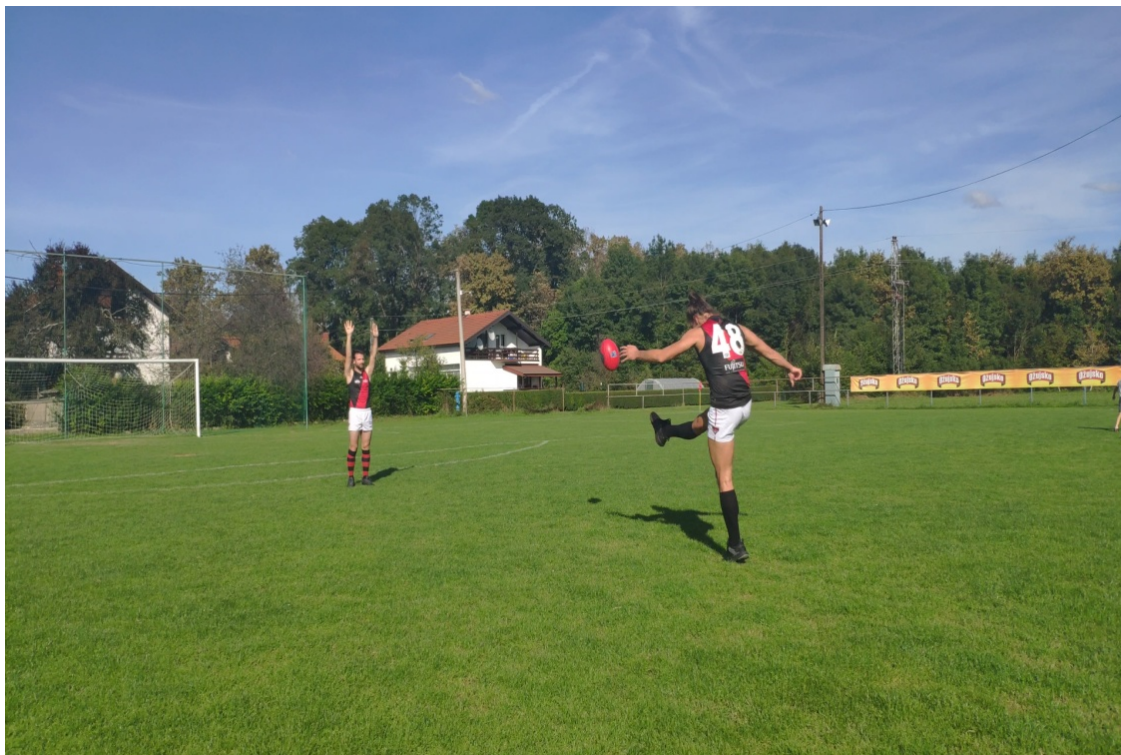
Slika 14. Slobodni udarac u situacijskim uvjetima

zbog obrambenog igrača koji “smeta“ potrebno je uzeti dovoljno velik zalet koji može biti i do 15 metara.