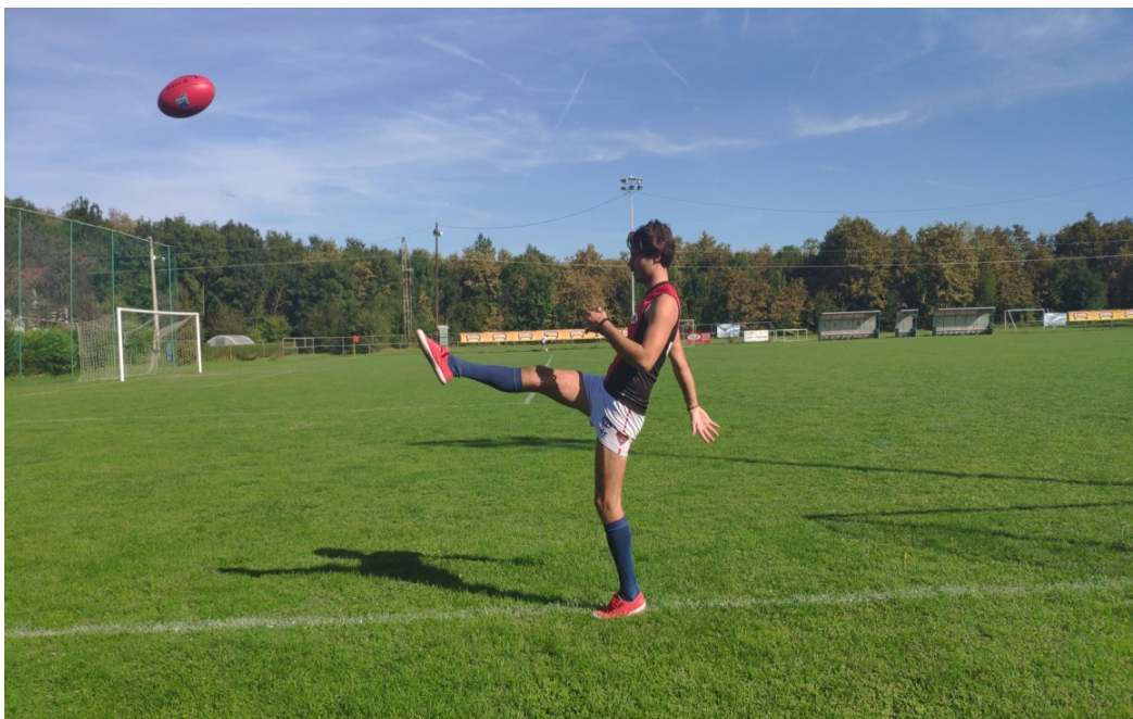
Slika 13. Udarac na gol s naglaskom na fleksiju zamašne noge u zglobu kuka

Za razliku od standardnog dodavanja, kod udarca na gol ili dalekog ispucavanja lopte bitno je, u završnoj fazi šuta, opružiti zamašnu nogu u zglobu koljena te stopalo u skočnom zglobu (slika 13). Prije izvođenja ove vježbe, pozornost treba posvetiti dinamičkom istezanju mišića nogu (biceps femuris) radi prevencije ozljeda.