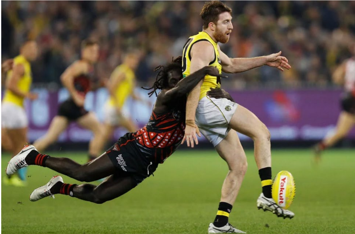
Slika 3. Obaranje igrača (tackle) (preuzeto: https://www.theage.com.au/sport/afl/afl-racing-to-build-new-review-centre-for-finals-20190717-p5284z.html )

odnosno u sredini terena. Razlog tome je što su igrači na ovim pozicijama nižeg rasta te imaju izrazito razvijenu eksplozivnu snagu i brzinu. U zoni prijenosa lopte uglavnom se koristi dodavanje rukom što omogućuje veći broj rušenja suparnika.