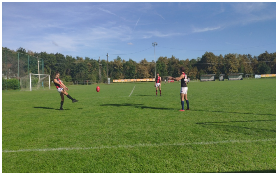
Slika 12. Dodavanje nogom u formaciji „trokut“