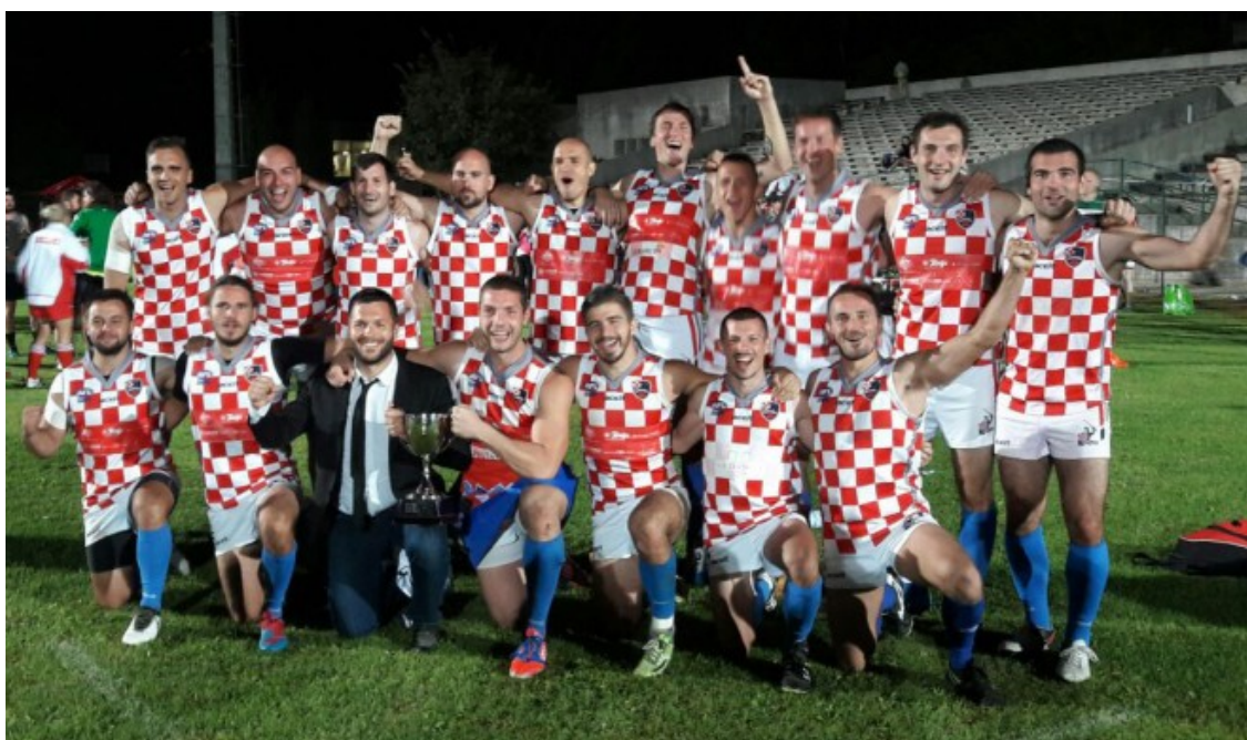
Slika 1. Hrvatska reprezentacija australskog nogometa, Lisabon 2016