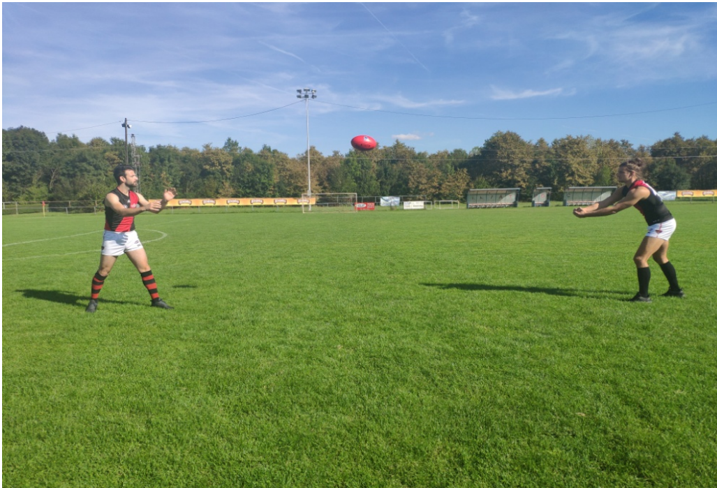
Slika 8. Dodavanje rukom u paru (udaljeno)

Vježbači stoje na udaljenosti od pet do sedam metara te izvode osnovno dodavanje na način kao što je opisano u predhodnoj vježbi (Slika 8).