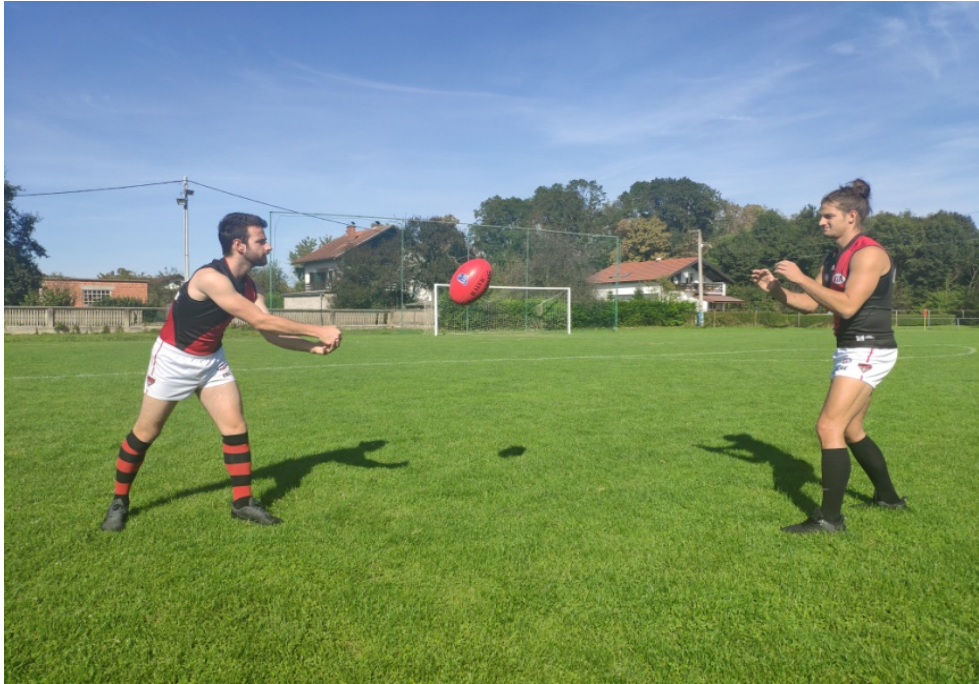
Slika 7. Dodavanje rukom u paru