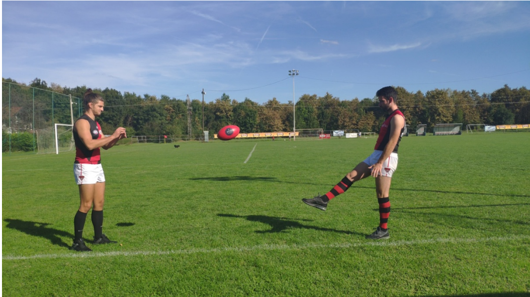
Slika 11. Dodavanje nogom u paru