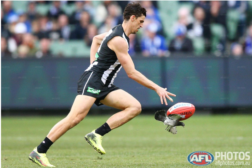
Slika 4. Potvrđivanje lopte (bounce)

rukom ili nogom svom suigraču. Međutim isti ovaj element ostavlja puno prostora suparniku za izvođenje obaranja te oduzimanje lopte na ranije opisani način.