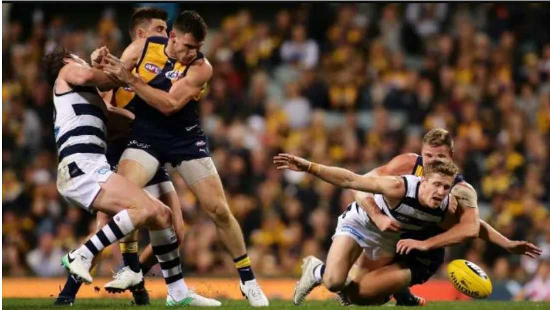
Slika 5. Blokiranje igrača (shepherding)