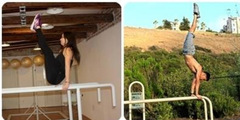
Slika 17: V sit, stoj na dip bar-u