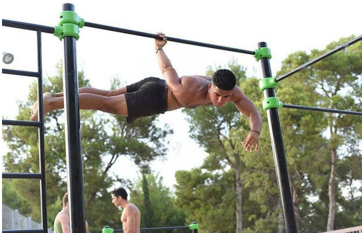
Slika 18: Back lever na jednoj ruci, close to impossible.