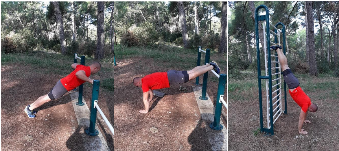
Slika 7: Varijacije Sklekova (Incline / Decline / Handstand Pushups)