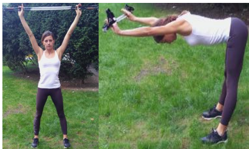
Slika 6. PRETKLON TRUPOM

OPIS: Raskoračni stav. Stopala postaviti paralelna, prstima usmjerenim naprijed, nešto šire od širine ramena. Uzručiti sa štapovima. Učiniti vodoravni pretklon.