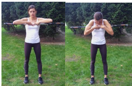
Slika 19. „IZVLAČENJE“ LEĐA

OPIS: Stopla postaviti u širini ramena prstima usmjerenim naprijed. Štapove držati na prsima paralelno s podlogom tako da su ruke bliže jedna drugoj. Laktove prebaciti preko štapova, a bradu postaviti na prsa. Gurati laktove nazad.