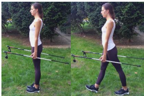
Slika 13. HODANJE SA ŠTAPOVIMA U SREDINI

OPIS: Stav raskoračni, stopala usmjerena naprijed. Priručiti sa štapovima. Hodati ravno.