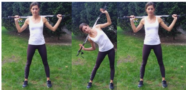
Slika 4. BOČNI OTKLON

OPIS: Stav raskoračni. Stopala usmjerena prema naprijed, postavljena nešto šire od širine ramena. U području pogrčenom držati štapove iza glave.