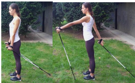
Slika 12. „RUKOVANJE“ UZ POMOĆ ŠTAPOVA