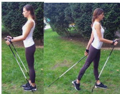
Slika 16. HODANJE S UBODOM JEDNOG ŠTAPA

OPIS: Raskoračni, stopala usmjerena naprijed. Štap jedne ruke držimo opuštено tako da ga pri hodu, kao u prethodnoj vježbi „vučemo“ iza tijela, suprotnom rukom naglašeno radimo ubod štapa i odziv.