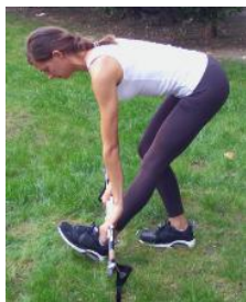
Slika 22. PRETKLON

OPIS: Stopala postaviti u širini kukova. Napraviti iskorak jednom nogom. Težinu tijela prenijeti na stražnju nogu . leđa držati ravna u potpunosti. U isto vrijeme treba se spuštati u pretklon te kukove gurati unatrag.