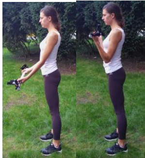
Slika 8. BICEPS PREGIB

OPIS: Stav raskoračni, stopala paralelna usmjerena naprijed. U blago pogčenom niskom predručenju držati štapove. Povlačiti štapove prema sebi uz svjesnu aktivaciju mišića ruku.