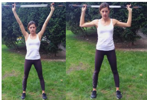
Slika 7. POTISAK IZNAD GLAVE

OPIS: Stav raskoračni. Stopala usmjerena naprijed. Uzručiti sa štapovima iznad glave. Povlačiti štapove dolje do uzručenja pogčenog uz svjesnu aktivaciju mišića ruku i ramenog pojasa.