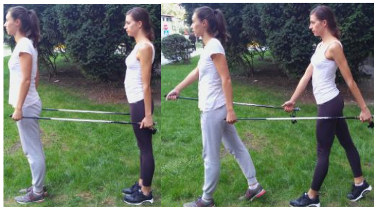
Slika 14. HODANJE U PARU

OPIS: Vježba u paru. Stav raskoračni, stopala usmjerena naprijed. Priručiti sa štapovima na način da svaki par drži stapove za jedan kraj. Hodati ravno.