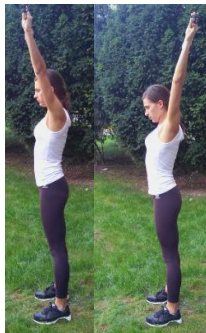
Slika 18. UZRUČENJE SA ŠTAPOVIMA

OPIS: Raskoračni stav. Stopala paralelno u širini kukova. Uzručiti. Iz uzručenog položaja gurati ruke nazad i gore.