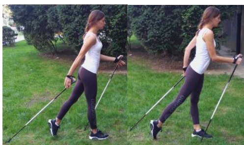
Slika 17. KONTINUIRANO HODANJE

OPIS: Izvedba tehnike nordijskog hodanja u kontinuitetu. Ritmičan ubod štapa i odziva suprotnom rukom u zadnjoj fazi.