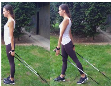
Slika 15. „VUČENJE“ ŠTAPOVA U HODU

OPIS: Stav raskoračni, stopala usmjerena naprijed. Priručiti sa štapovima na način da se štapovi nalaze iza tijela. Hodati ravno naprijed, usklađenih pokreta ruku i nogu na način da štapove „vučemo“ iza tijela.