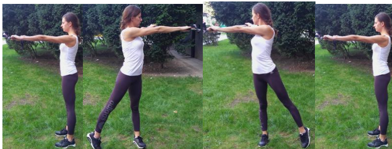
Slika 5. ZASUK TRUPOM

OPIS: Iz raskoračnog stava u kojemu su stopala paralelna ruke postaviti u predručje držeći štapove. Učiniti zasuk trupom.