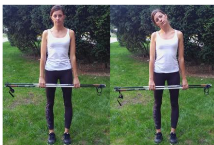
Slika 1. OTKLON GLAVOM

OPIS: Stav raskoračni. Stopala paralelna, usmjerena prema naprijed. Štapove držati ispred tijela. Otklon glavom.