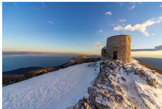
Slika 6. Vrh Vojak, Kvajo, K. 2018.

Učka. Jedni od takvih događaja su Outdoor dan Parka prirode Učka, maraton „Mama i beba“, Biciklijada za djecu i odrasle-Vojak, Offroad duathlon Učka.