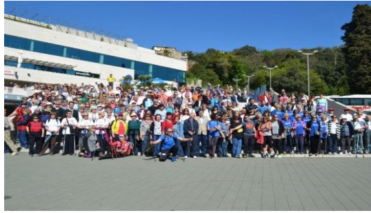
Slika 8. RK Opatija, Žic, D.(2018).