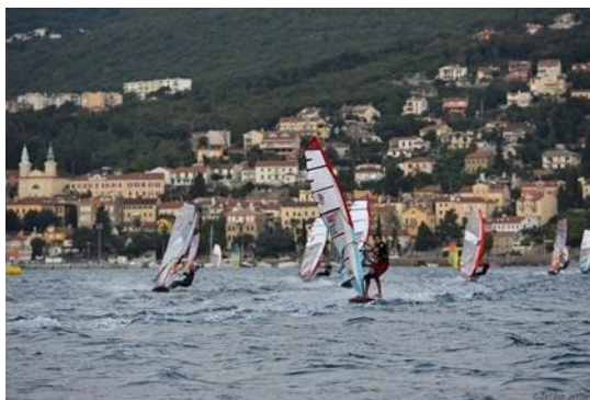
Slika 7. Windsurfing na Preluku, veljača 2020.