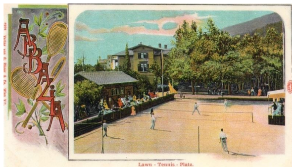
Slika 4. Povijest tenisa u Opatiji, Kučić, V., (2014)

teniskim terenima mogućnosti imaju igrati i turisti željni aktivnog odmora. Najam terena moguć je tijekom cijele godine, a iznosi 80 kuna po satu.