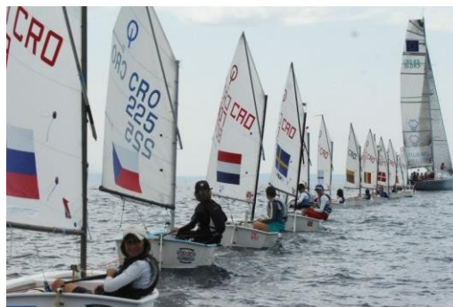
Slika 5. Jedrenje u Opatiji, Aničić, M. (2013)

kojima se natječu seniorske posade, CUP Opatija, državno prvenstvo za olimpijske klase te IOM Opatija Cup, regata jedriličarskih maketa.