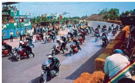
Slika 3. Moto utrke Preluk, Pendić, K. 2015.

posjetioca nije poznat iz razloga što se promatranje utrka ne naplaćuje te je nemoguće točan broj gledatelja, osim procjenom koja iznosi nekoliko stotina gledatelja po utrci. U utrci imaju pravo sudjelovati vozači, zapisani u registru matičnog kluba u Hrvatskoj, ali i izvan nje.