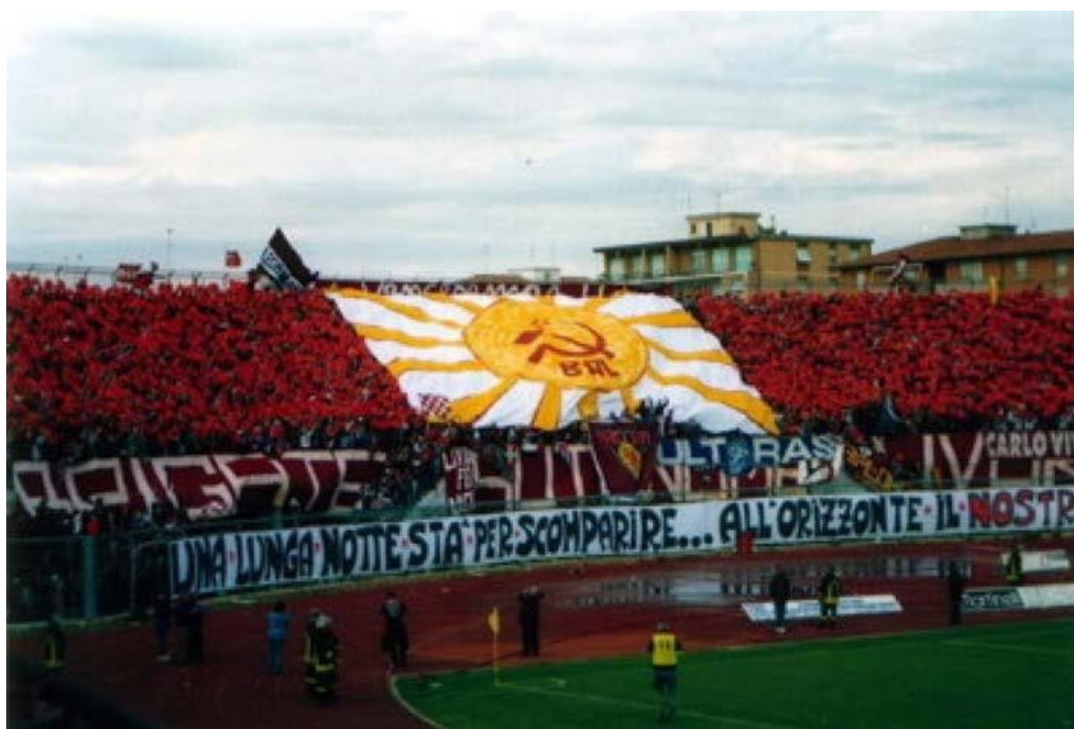
Slika 1. Koreografija navijača Livorna (Doidge, 2013, str. 253)

komunističkom simbolikom, a uz srp i čekić na slici se nalazilo izlazeće Sunce kao simbol svijetle budućnosti koja čeka radnike kad komunizam stigne. Također, navijači su na transparentu riječ naše napisali crvenom bojom koja simbolizira boju kluba, a inače je crvena boja jedan od najistaknutijih simbola komunizma. Ta koreografija jasno je istaknula lijevu političku orijentaciju navijača i stanovnika Livorna te njihove simpatije prema ekstremno lijevoj političkoj ideologiji komunizma (Doidge, 2013, str. 252). Na rođendan komunističkog diktatora Staljina navijači su izvjesili transparent kojim su obilježili taj dan i na taj su način istaknuli svoju povezanost s komunističkom Rusijom. Godine 2006. navijači su izvjesili transparent povodom 80. rođendana kubanskog revolucionara Fidela Castra (Doidge, 2013, str. 253).