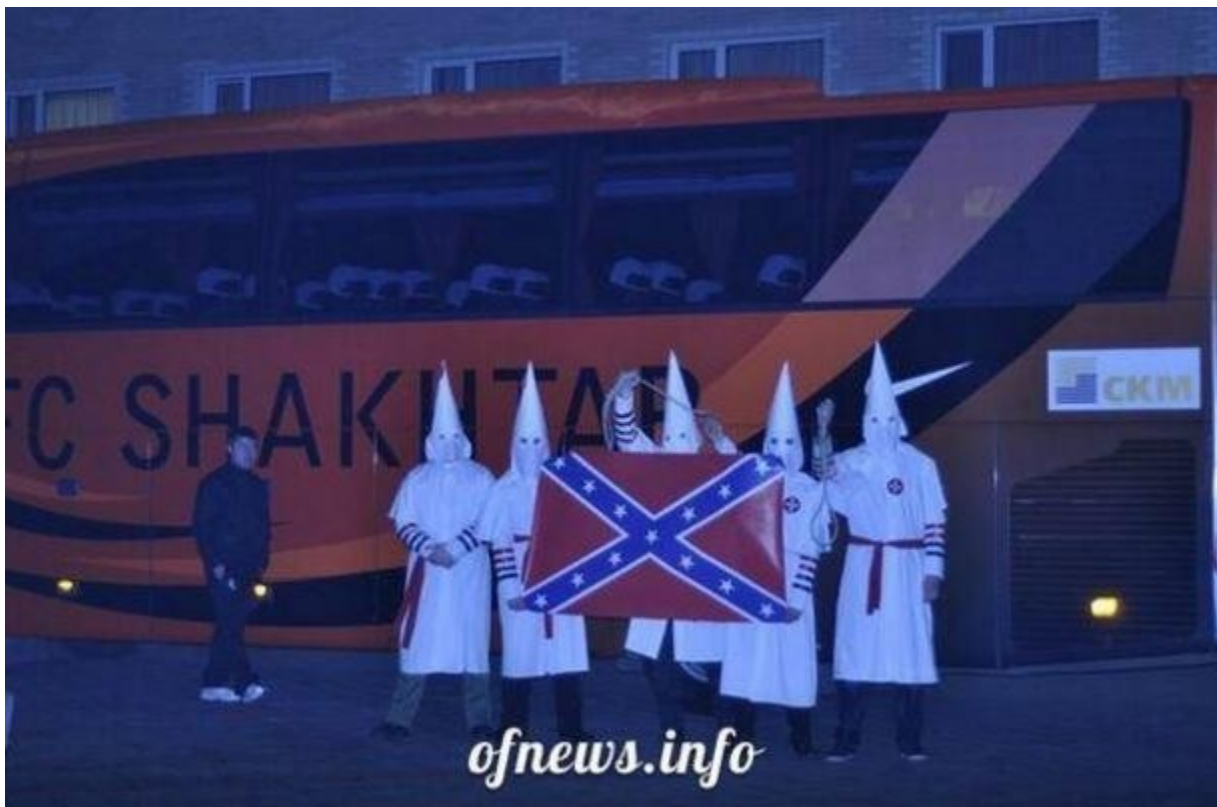
Slika 3. Navijači Dynamo Kijeva u odori Ku Klux Klana (KKK) ističu konfederacijsku zastavu (Forrester, 2017)