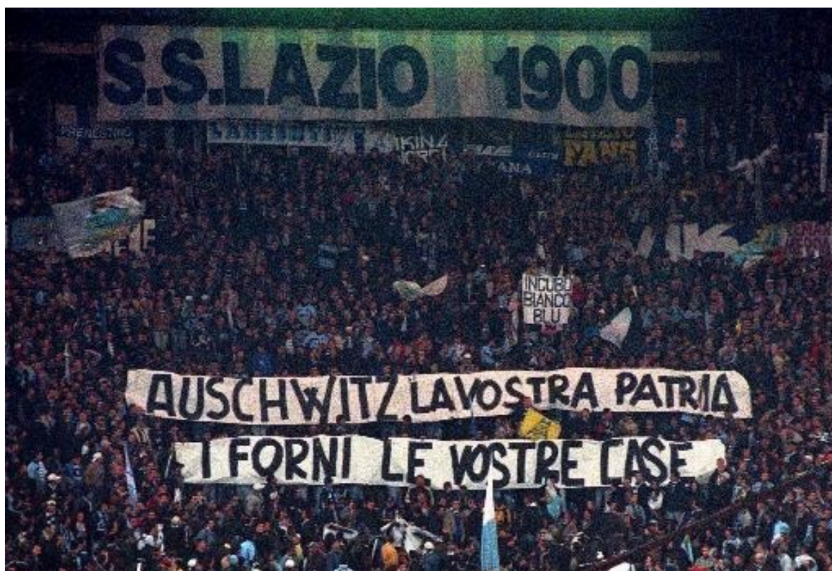
Slika 4. Antisemitski transparent navijača Lazija upućen navijačima Rome: „Auschwitz je vaša domovina, pećnica je vaša kuća“ (Dampf, 2017)