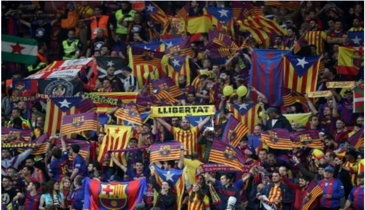
Slika 8. Navijači Barcelone ističu klupski grb zajedno s katalonskim zastavama Senyerom i Esteladom te političkim natpisom „Sloboda“ kojim traže neovisnost od Španjolske (Acn, 2018)

prekrivene žutim i crvenim bojama koje predstavljaju Kataloniju (“Clasico delayed,” 2019). Kao što je već rečeno u radu, navijači Barcelone u finalima Kupa kralja zvižde španjolskoj himni koja se pušta s razglasom neposredno prije utakmice (Acn, 2018), a također zvižde i himni Lige prvaka te na taj način protestiraju protiv odluke UEFA-e koja je zabranila unošenje katalonskih zastava na utakmice (Wilson, 2019).