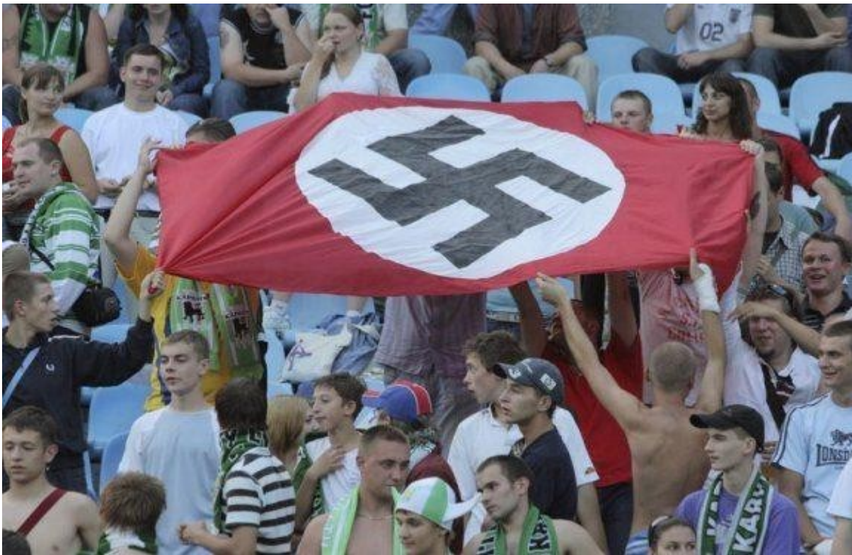
Slika 2. Isticanje svastike (kukastog križa) na tribinama stadiona (Srulevitch, 2019)