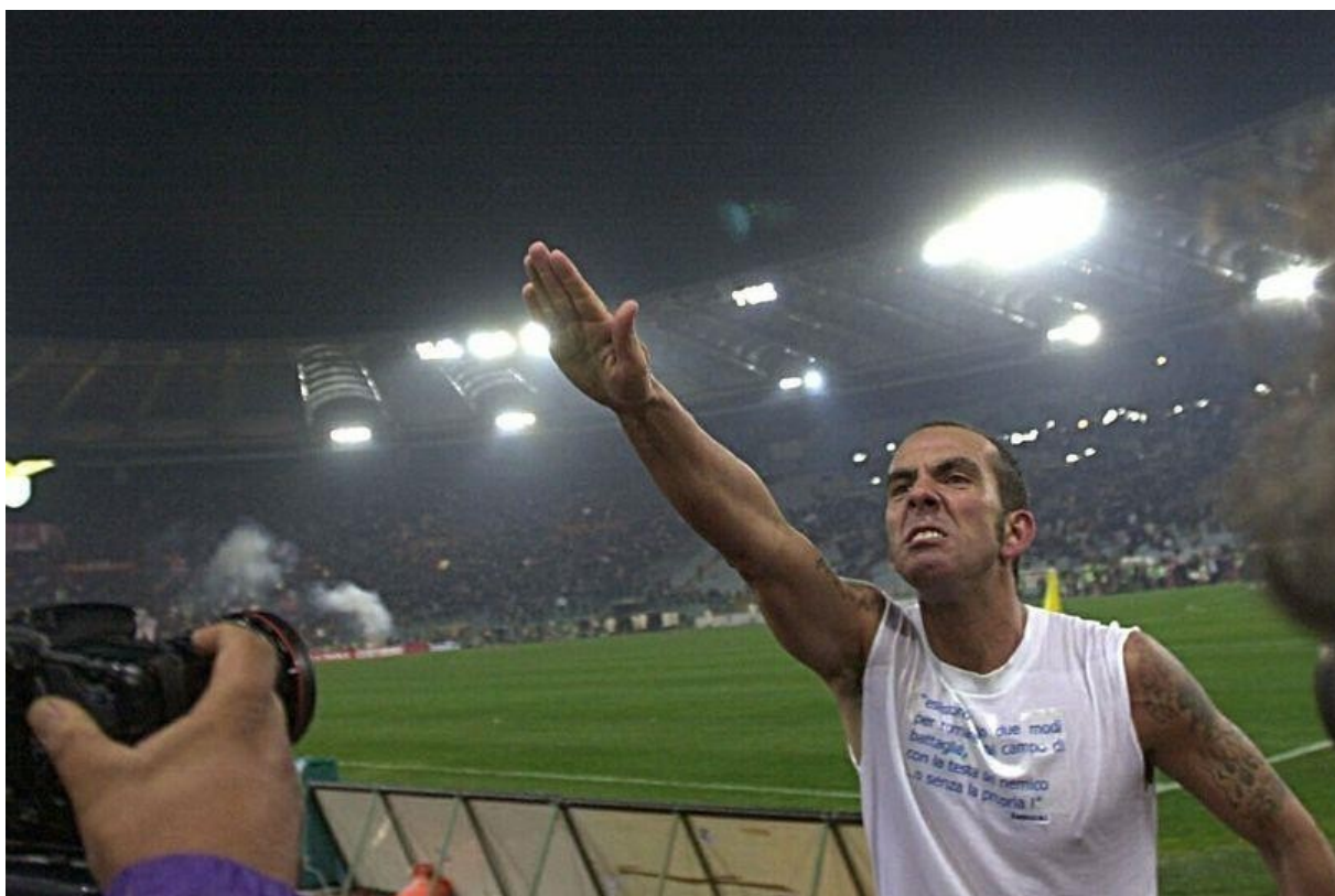
Slika 6. Paulo di Canio salutira fašističkim pozdravom (Silver, 2013)