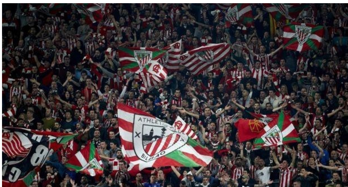
Slika 7. Navijači Athletic Bilbaa ističu kombinaciju zastava s klupskim grbom i bojama baskijske zastave „Ikurriñe“ (Smith, 2020)