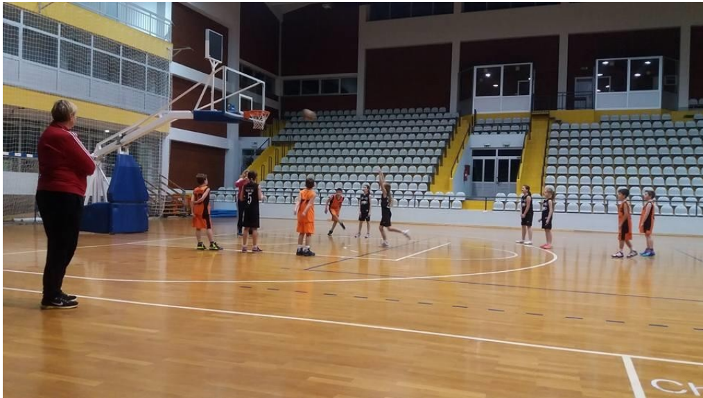
Slika 10. Igra 5:5 u dvorani Vijuš u Slavonskom Brodu

Pogreške koje se pojavljuju u igri 5:5 su: