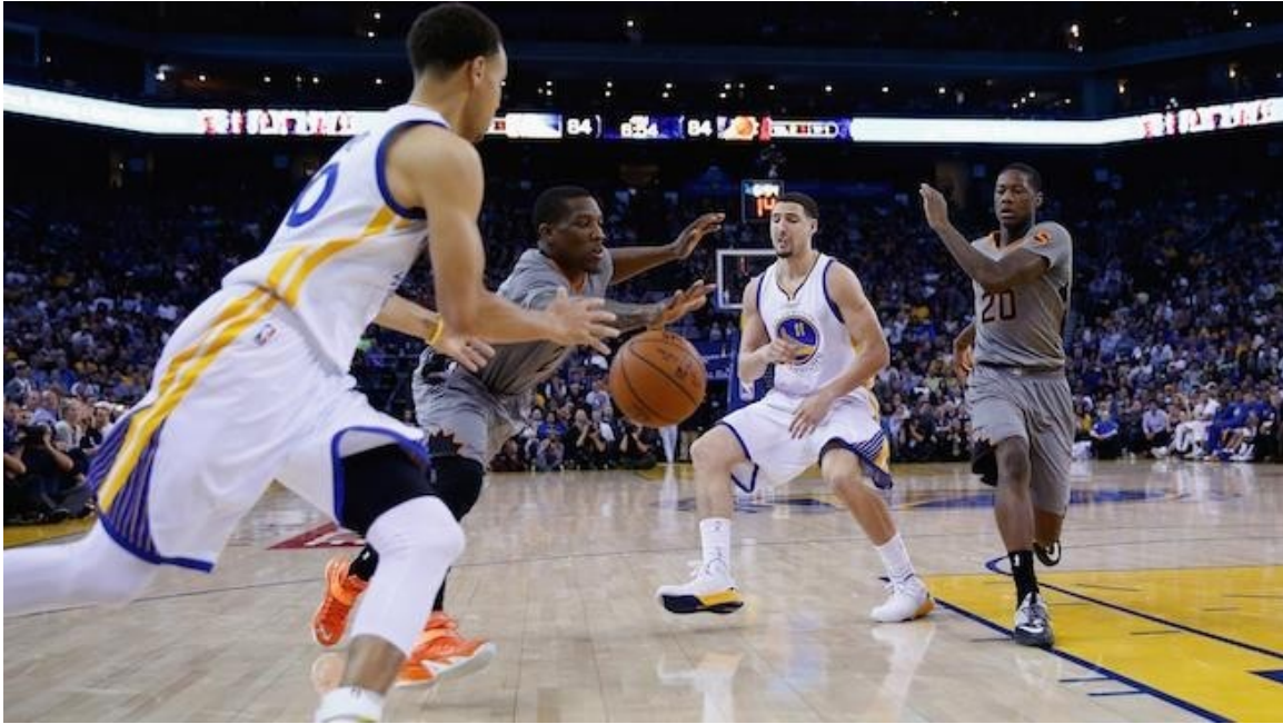
Slika 7. Dodavanje dva igrača u napadu

Pogreške prilikom podučavanja suradnje dva igrača u napadu i obrani su: