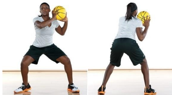
Slika 4. Prikaz tehnika prednjeg i stražnjeg pivota

Pivotiranje predstavlja, uz stav s loptom, jedan od najvažnijih košarkaških elemenata u poduci. Izvodi se iz osnovnog stava s loptom prilikom čega dolazi do uzastopnog pomicanja pivot noge u raznim smjerovima (otvorena i zatvorena strana) uz stalan kontakt druge, stajne noge s podlogom. Prilikom pivotiranja potrebno je ostvariti vizualni kontakt s obrambenim igračem, naglasiti stabilan stav ravnim leđima, savijenim koljenima i glavom iznad visine kukova. Težinu tijela potrebno je prebaciti na prednji dio stopala pivot noge. Podjela tehnike pivotiranja je na prednjeg i stražnjeg pivota. Tehnika prednjeg pivota je zauzimanje bolje pozicije na igralištu prsima u smjeru kretanja, a tehnika stražnjeg pivota je zauzimanje bolje pozicije na igralištu leđima u smjeru kretanja. Slika 4. prikazuje podjelu tehnike pivotiranja.