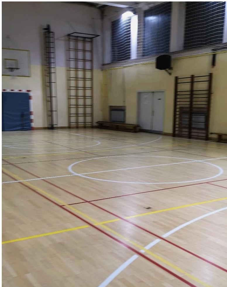
Slika 1. Prikaz školske dvorane u Slavonskom Brodu

Važno je naglasiti da ukoliko nisu postojali materijalno-tehnički uvjeti za provedbu nastavnih tema iz košarkaške igre u trećem i četvrtom razredu, iste teme uključuju se kao programski sadržaji u petom razredu. Programski sadržaji koje je potrebno svladati u trećem razredu su vođenje lopte desnom i lijevom rukom u mjestu i pravocrtnom kretanju, osnovno dodavanje i hvatanje lopte s dvije ruke u mjestu te dodavanje i hvatanje lopte s dvije ruke u kretanju. Programski sadržaji koje je potrebno svladati u četvrtom razredu su vođenje lopte s promjenom pravca kretanja, košarkaški dvokorak i elementi dječje košarke. Postoje i programi dječje košarke koje se provode sa djecom od prvog do četvrtog razreda osnovne škole. Program dječje košarke sadrži osnovne elemente košarkaške tehnike u modificiranim uvjetima za djecu te dobi (manja visina koša, manje lopte, manje dimenzije terena). Problemi koji se mogu pojaviti često su povezani s materijalnim uvjetima jer mnoge školske dvorane u Republici Hrvatskoj nemaju adekvatne uvjete za provedbu košarkaških aktivnosti zbog nedostataka adekvatne dvorane, koševa, lopti, rekvizita i dr. Na slici 1. prikazana je mala školska dvorana u Slavonskom Brodu.