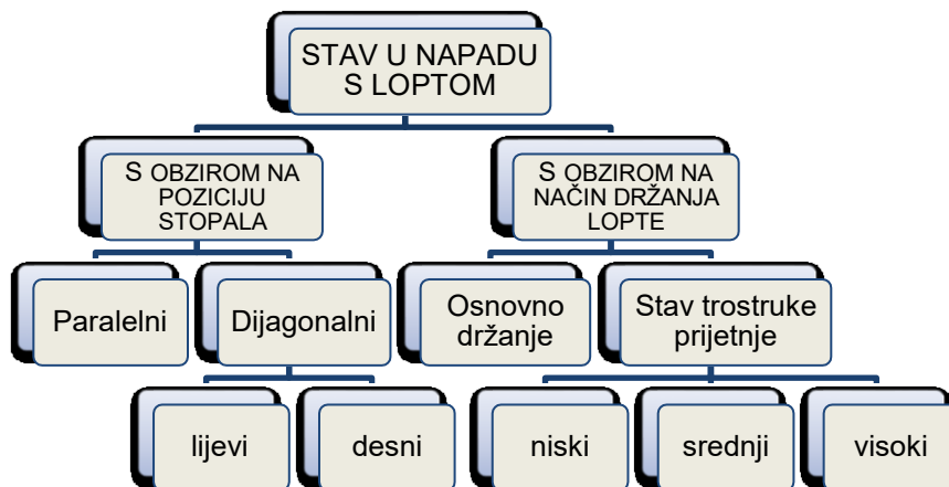
Slika 2. Podjela tehnike stavova s loptom s obzirom na izvedbu (Matković, B., Knjaz, D., & Rupčić, T., 2014)

Kod napadačkog stava s loptom stopala su paralelna, razmaknuta za širinu ramena, a težina je ravnomjerno raspoređena na prednjem dijelu stopala. Kut između natkoljenice i potkoljenice iznosi približno 120^\circ . Koljena su savijena, leđa ravna, ruke se nalaze iznad kukova, savijenih laktova i blizu tijela. Lopta se drži čvrsto s dvije ruke u visini grudi, palčevi su usmjereni prema vrhu lopte, a podlaktice su gotovo u paralelnom položaju s podlogom. Trup se nalazi u blagom pretklonu, a glava se nalazi iznad centra težišta tijela s pogledom na obruč i loptu. Stav mora biti stabilan iz kojeg je moguće brzo krenuti, promijeniti smjer te kontrolirano se zaustaviti i skakati. Kod svih napadačkih stavova naglasak je na ravnoteži kako bi pokreti mogli biti pravilni i kontrolirani. Slika 3. prikazuje razliku između napadačkih stavova u košarci.