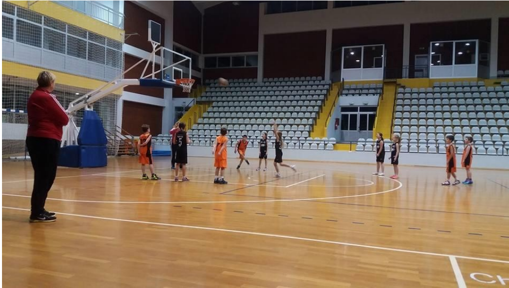
Slika 10. Igra 5:5 u dvorani Vijuš u Slavonskom Brodu

Pogreške koje se pojavljuju u igri 5:5 su: