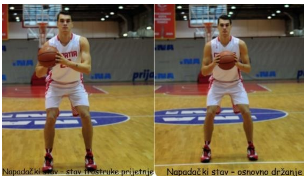
Slika 3. Prikaz napadačkih stavova u košarci (Matković, B., Knjaz, D., & Rupčić, T., 2014)

Kod napadačkog stava s loptom stopala su paralelna, razmaknuta za širinu ramena, a težina je ravnomjerno raspoređena na prednjem dijelu stopala. Kut između natkoljenice i potkoljenice iznosi približno 120^\circ . Koljena su savijena, leđa ravna, ruke se nalaze iznad kukova, savijenih laktova i blizu tijela. Lopta se drži čvrsto s dvije ruke u visini grudi, palčevi su usmjereni prema vrhu lopte, a podlaktice su gotovo u paralelnom položaju s podlogom. Trup se nalazi u blagom pretklonu, a glava se nalazi iznad centra težišta tijela s pogledom na obruč i loptu. Stav mora biti stabilan iz kojeg je moguće brzo krenuti, promijeniti smjer te kontrolirano se zaustaviti i skakati. Kod svih napadačkih stavova naglasak je na ravnoteži kako bi pokreti mogli biti pravilni i kontrolirani. Slika 3. prikazuje razliku između napadačkih stavova u košarci.