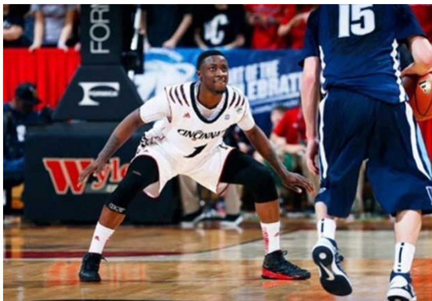
Slika 8. Osnovni obrambeni stav

Obrambeni stav je element individualne košarkaške tehnike koji igračima omogućava efikasno kretanje pri obavljanju obrambenih zadataka. Postoje dvije vrste obrambenog stava, a to su dijagonalni i paralelni. Njihova učinkovitost i primjena ovisi o situaciji u igri i mogućnostima igrača. Oba stava karakteriziraju stopala u paralelnoj ili dijagonalnoj poziciji široj od ramena, koljena su flektirana, trup u blagom pretklonu, leđa ravna, a ruke aktivne s laktovima udaljenim od tijela. Dlanovi su usmjereni prema gore i naprijed, a palčevi okrenuti prema gore. Ruke se nalaze ispod razine kukova i moraju biti vrlo aktivne. Jedna ruka sprječava šut ili dodavanje, a druga ruka napada loptu napadača. Težište tijela je na prednjim dijelovima stopala, a težina tijela jednako je raspoređena na obje noge. Igrači se nalaze u položaju tzv. obrambenog cilindra i svaki izlazak iz cilindra označava prekršaj ili osobnu pogrešku. Slika 8. prikazuje osnovni obrambeni stav u košarci.