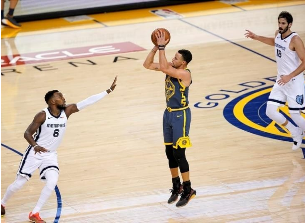
Slika 9. Skok šut u igri