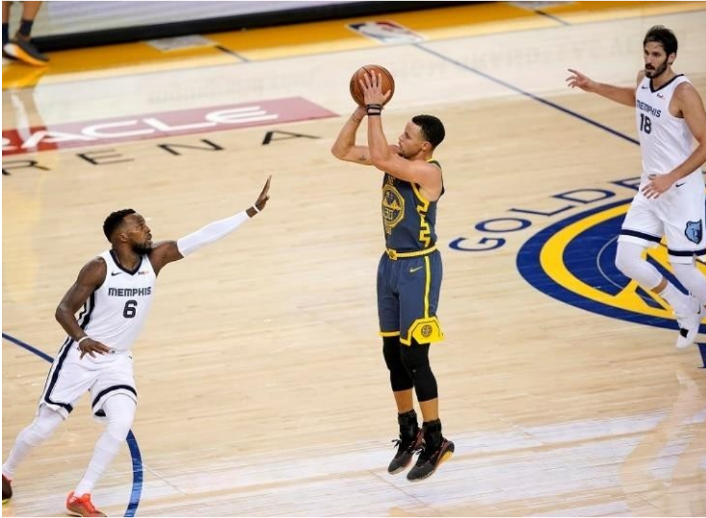
Slika 9. Skok šut u igri (slika preuzeta s https://www.lesoir.be/196184/article/2018-12-18/nba-stephen-curry-atteint-les-15000-points-en-nba-kevin-durant-depasse-larry )

Pogreške prilikom svladavanja skok šuta nakon vođenja ili dodane lopte: