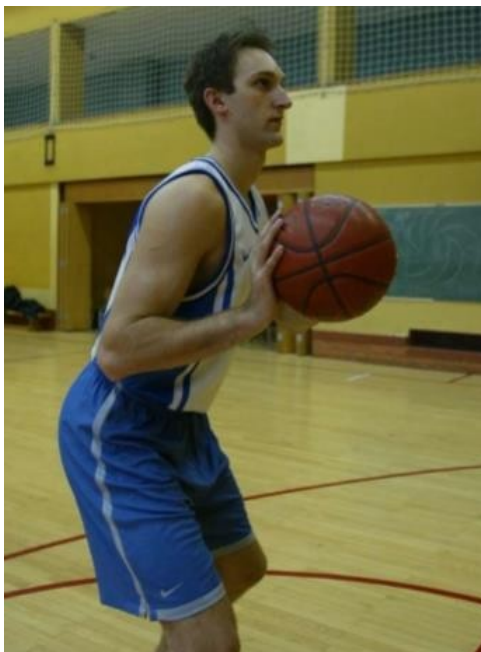
Slika 5. Pripremna faza šuta jednom rukom s grudi iz mjesta (Matković, B., Knjaz, D., & Rupčić, T., 2014)

Učenicima je potrebno naglasiti da za ovaj šut postoje 3 faze, a to su: pripremna faza ili početni položaj, osnovna faza ili faza izbačaja te završna faza ili faza doskoka. Ovaj element tehnike se najčešće koristi pod kutom od 45° u odnosu na ploču koša. Slika 5. prikazuje pripremnu fazu šuta s grudi iz mjesta.