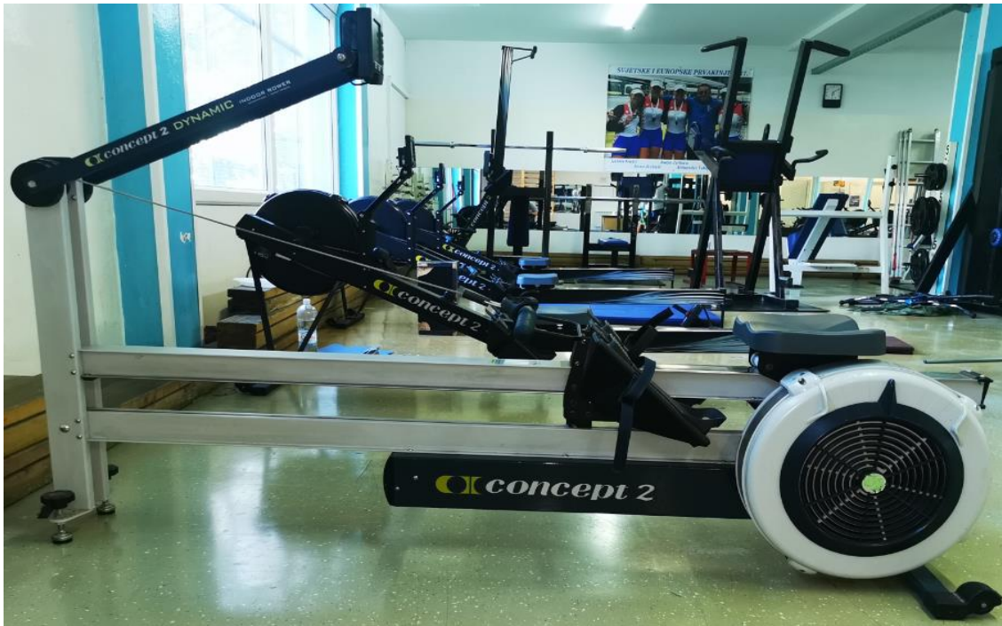
Slika 5. Veslački ergometar Concept2 Model Dynamic