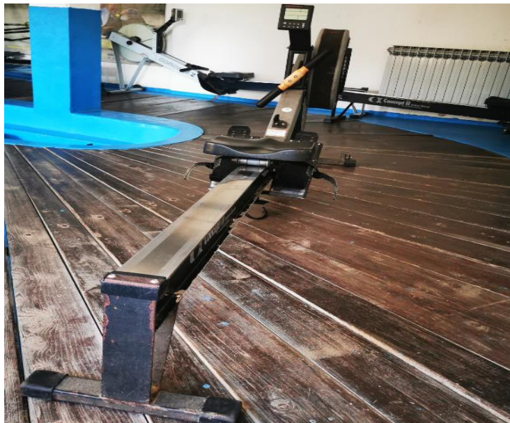
Slika 3. Veslački ergometar Concept2 model C

Boja sivo crna, drvena ručka s crnom gumom kao presvlakom, plastični držači za noge, s polugom za regulaciju otpora na desnoj strani zamašnjaka i monitorom.