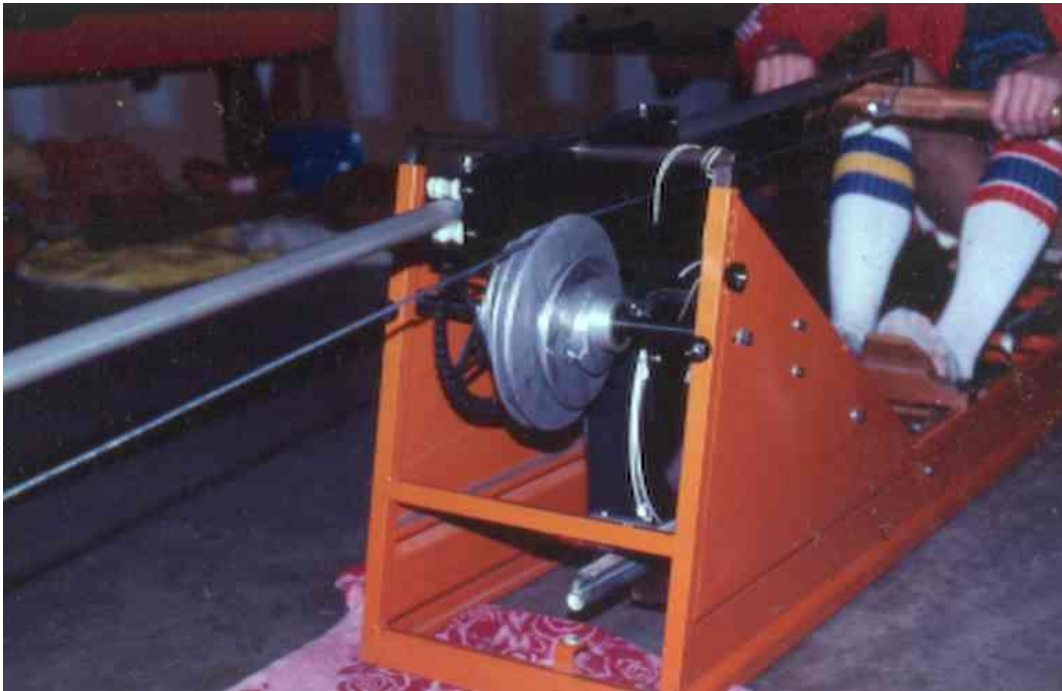
Slika 2. Gjessing-Nilson veslački ergometar

Ovaj veslački ergometar je dugi niz godina bio međunarodno priznati standard mjerenja veslačkih parametara.