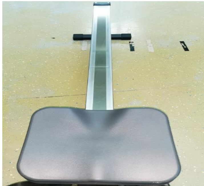
Slika 10. Sjedalica i vodilica na Concept2 veslačkom ergometru

Sjedalica kotačićima pričvršćena na vodilicu duljine cca. 1 m, omogućuje kretanje gornjeg dijela tijela naprijed-natrag kroz odupiranje nogama o držače za noge.