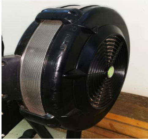
Slika 7. Concept2 zamašnjak i prigušivač