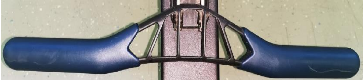
Slika 9. Drška na Concept2 veslačkom ergometru

Lancem povezana s bubnjem/zamašnjakom, simulira dršku vesla. Ergonomska, izrađena od plastike presvučena gumom.