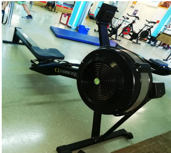
Slika 4. Veslački ergometar Concept2 model D

Od 2003.-2006. se proizvodio u plavoj i svijetloplavoj boji, a od 2006. do danas se proizvodi u sivoj i svijetloplavoj boji. Nogare su izrađene od plastike, ručka je ergonomska s gumenim gripom, dok kućište zamašnjaka radi na principu prethodnog modela.