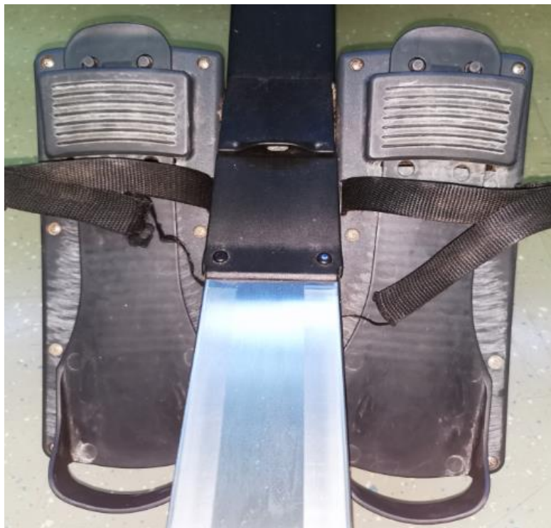
Slika 8. Držači za noge na Concept2 veslačkom ergometru

Dio veslačkog ergometra na koje se vezicom fiksiraju stopala. Mogu se prilagoditi veličini stopala te su određene skalom od 1-6