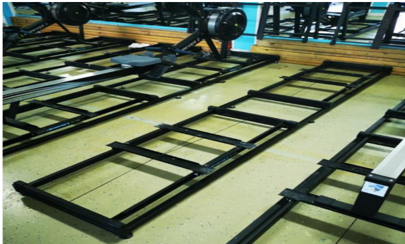
Slika 11. Concept2 klizači za veslački ergometar

Godine 1999. tvrtka Concept2 na tržište donosi tzv. „slide“ dodatak veslačkom ergometru koji omogućuje još bolju simulaciju veslanja u čamcu. Ergometar tokom zaveslaja/veslanja nije fiksiran, već se pomiče i stvara osjećaj puno bliži veslanju u čamcu na vodi.