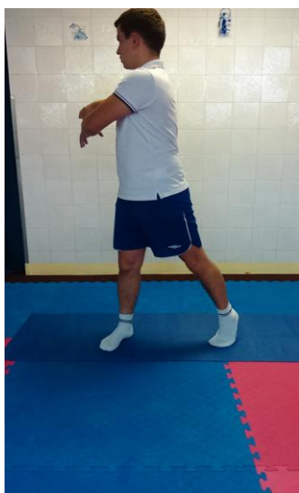
Slika 16: Zasuk u desnu stranu