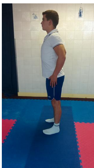
Slika 25: Podižemo ramena