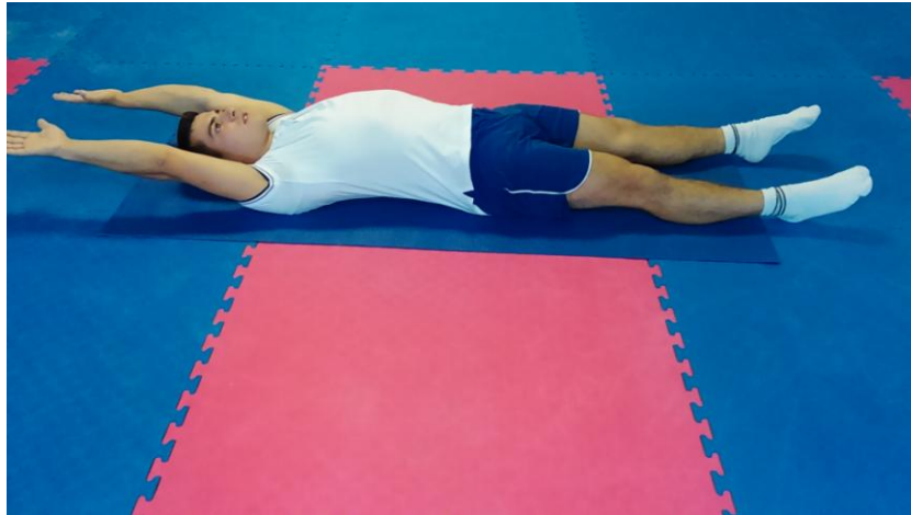
Slika 9: Izdužiti ruke i noge

OPIS VJEŽBE: Ležati na leđima, podizati ruke iz priručenja do zaručenja