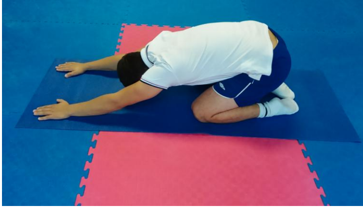
Slika 12: Sijed na potkoljenice sa opruženim rukama

OPIS VJEŽBE: U uporu klečećem osoba izvodi uvinuće u lumbalnom dijelu kralježnice, te se radi izdržaj u tom položaju, zadržati 3 sekunde.