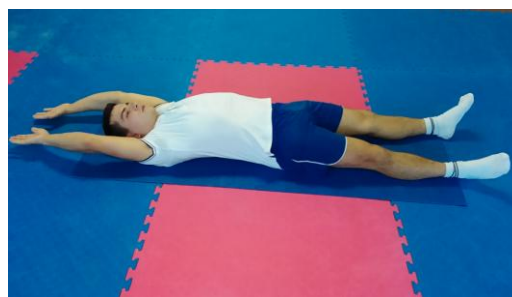
Slika 11: Odručenje