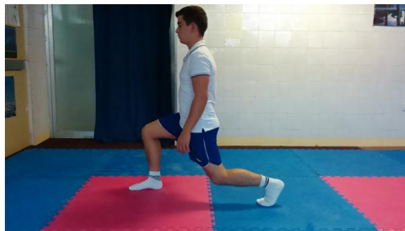
Slika 5: Zakoračiti jednom nogom prema naprijed

OPIS VJEŽBE: Iz uspravnog položaja zakoračiti jednom nogom u stranu, ruke opuštene uz tijelo, zadržati položaj 3 sekunde, vratiti se u početni položaj.