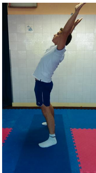
Slika 15: Zaklon

OPIS VJEŽBE: Stojimo u raskoračnom stavu, izvodimo zasuke rukama u lijevu i desnu stranu.