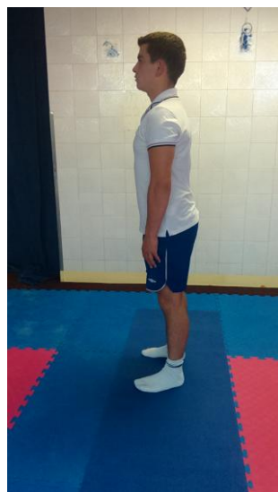
Slika 26: Spuštamo ramena