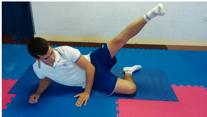
Slika 21: Odnoženje

OPIS VJEŽBE: Ležeći na prsima podižemo jednu pa drugu nogu, jačanje leđa.