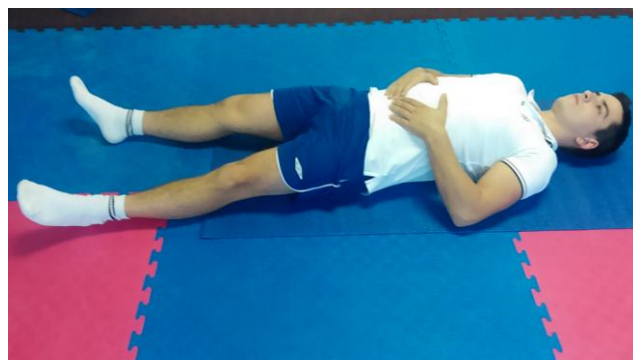
Slika 28: Tiskati dlanovima trbušne mišiće