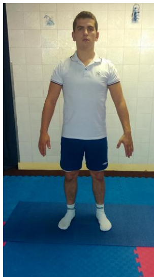
Slika 24: Priručenje

OPIS VJEŽBE: Podižemo ramena naprijed zatim prema gore i u nazad te izvodimo udah, i obrnuto vraćamo u početni položaj izvodeći izdisaj.