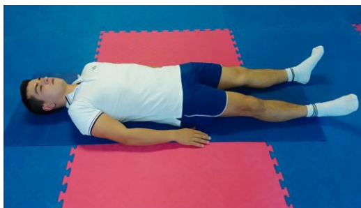
Slika 10: Priručenje