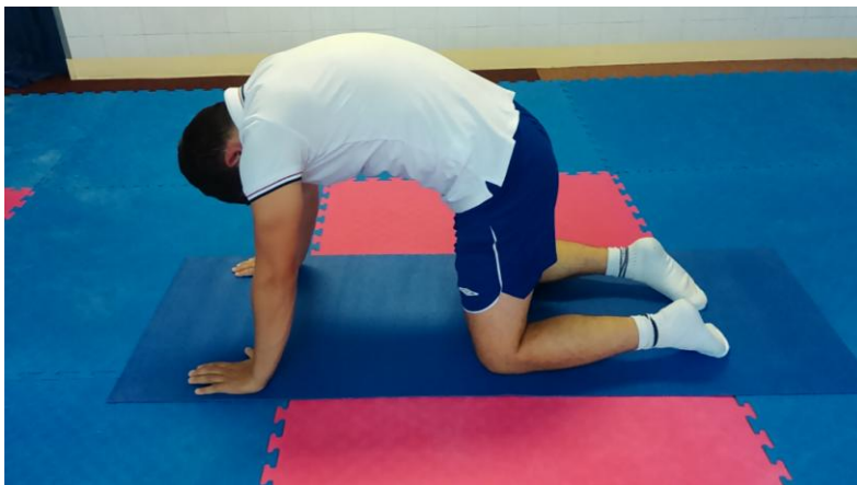
Slika 13: Uvinuće lumbalnog dijela kralježnice