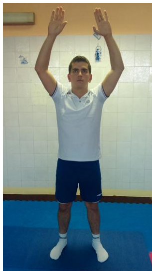
Slika 23: Uzručenje