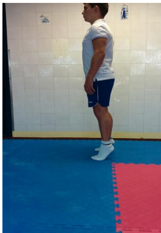
Slika 7: Podizanje na prste

OPIS VJEŽBE: Podizanje na pete, zadržati 3 sekunde, ponovno vraćanje u početni položaj.