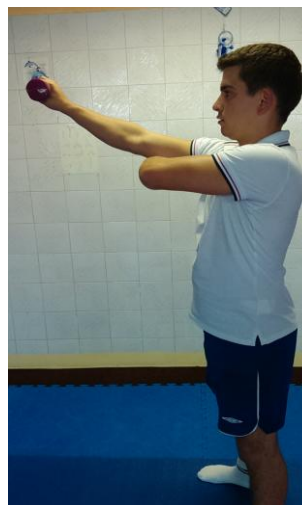
Slika 21: Ispružena ruka