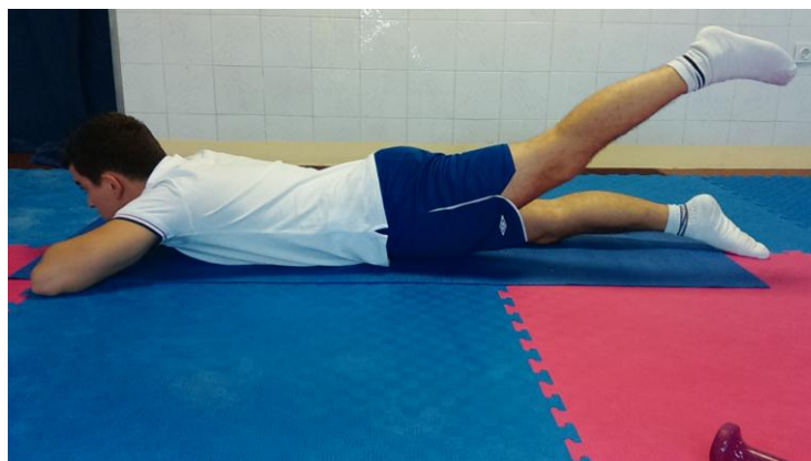
Slika 22: Podizanje noge