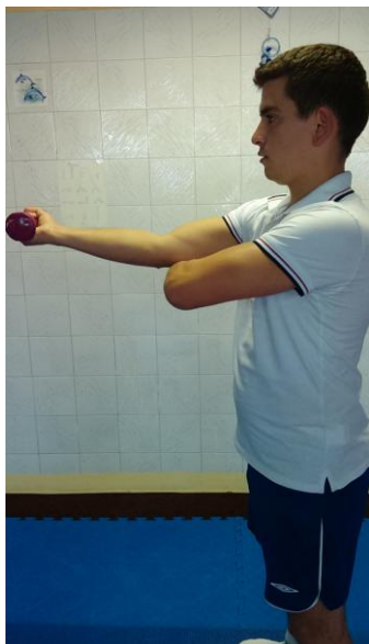
Slika 18: Ispružimo ruku