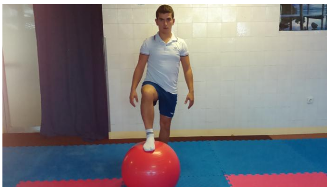
Slika 4: Podizanje noge na loptu