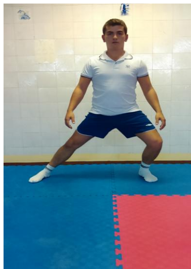
Slika 6: Zakoračiti nogom u stranu