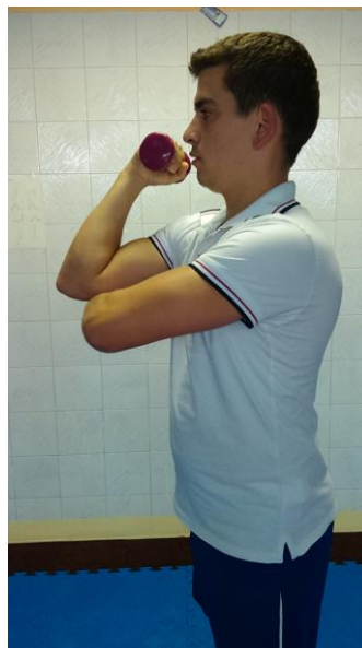
Slika 19: Privlačimo ruku

OPIS VJEŽBE: Jačanje M. tricepsa , u stojećem položaju, polako opružiti u predručenje gore, zadržati 2 sekunde.