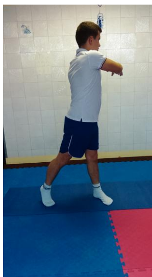
Slika 17: Zasuk u lijevu stranu