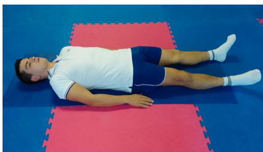
Slika 10: Priručenje