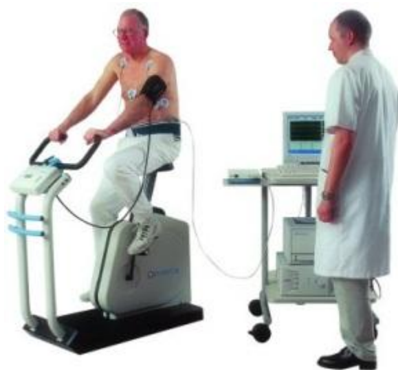
Slika 3. Test opterećenja (ergometrija) ( www.mortonmedical.co.uk , 2002)

vozi bicikl ili hoda po pomičnoj traci određene brzine. Postupno se opterećenje povećava ali se obavezno kontrolira EKG, a krvni pritisak se mora mjeriti u određenim intervalima. Uglavnom, ispitanici izvode test podnošenja opterećenja sve dok im srčana frekvencija ne dosegne 80% do 90% maksimuma za njihovu dob i spol. Ako simptomi, kao zaduha ili bol u prsima, postanu nepodnošljivi ili se pojave značajne promjene u EKG-u ili krvnom pritisku, test se prekida kako ne bi došlo do ne željnih posljedica.