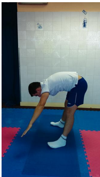
Slika 14: Pretklon