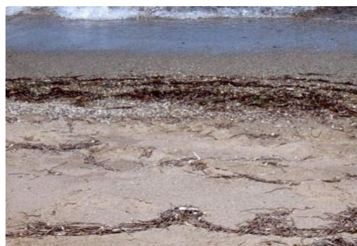
Slika 4. Posidonija na obali

Ugrožene su zbog ribolova povlačnim mrežama, sidrenja, nasipavanja zbog izgradnje obale, postavljanja kaveza za uzgoj ribe i onečišćenja od strane čovjeka. Zbog osjetljivosti i ugroženosti Posidonija je u Hrvatskoj i na europskoj razini strogo zaštićena vrsta, i štiti ju “Direktiva o zaštiti prirodnih staništa i divlje faune i flore Europske unije”.