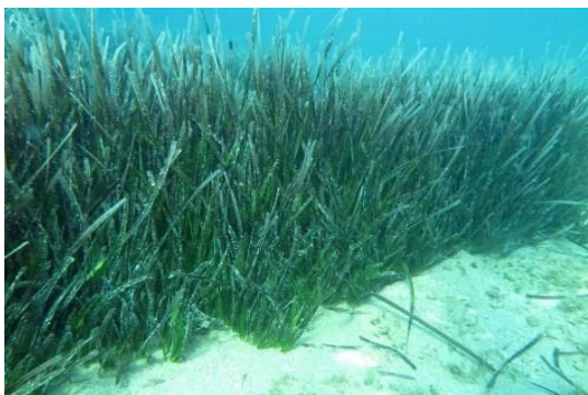
Slika 3. Posidonija

spužve, žarnjaci i poneke manje ribe. Iznimno su osjetljive jer sporo rastu i sporo se obnavljaju .