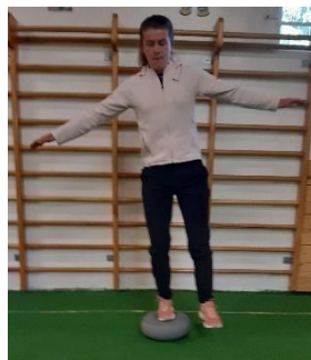
Slika 9. Stajanje na 1 nozi

Na zračnom jastuku potrebno je održavati ravnotežu na jednoj nozi ( Slika 9). Vježba se može izvoditi sa otvorenim i zatvorenim očima a cilj vježbe je, uz unapređenje ravnoteže, povećati stabilnost u zglobu gležnja. Nakon isteka vremena, mijenja se noga. Vježba se izvodi 1 minutu.