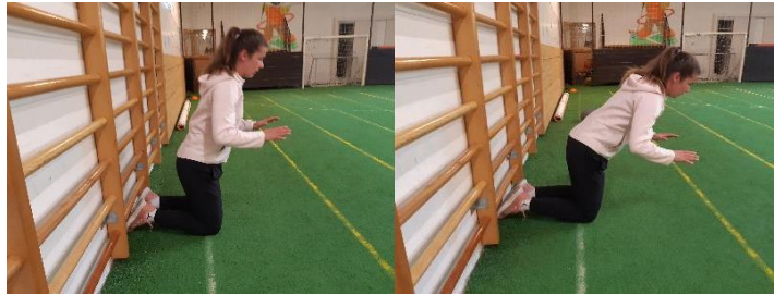
Slika 8. Nordic Hamstrings

položaj pustiti se u poziciju upora na rukama. Cilj vježbe je jačanje stražnje strane natkoljenice. Vježba se izvodi 1 seriju od 10 ponavljanja.