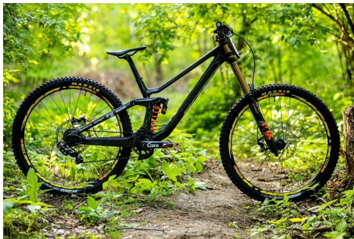
Slika 4. Downhill bicikl (Vital MTB, 2019)

Downhill (spust) - oblik biciklizma vrlo sličan „enduro“ biciklizmu s nekoliko ključnih razlika. Staze na kojima se provodi spust ekstremnije su i zahtjevnije s više prepreka i umjetno postavljenih skokova. Uz to, dolazak na početak staze odvija se motoriziranim prijevozom, bilo automobilima ili žičarom. Dakle cilj je u što kraćem vremenu spustiti se niz stazu. Konstrukcija downhill bicikla vidi se na Slici 4 (Rog-Joma, 2018).