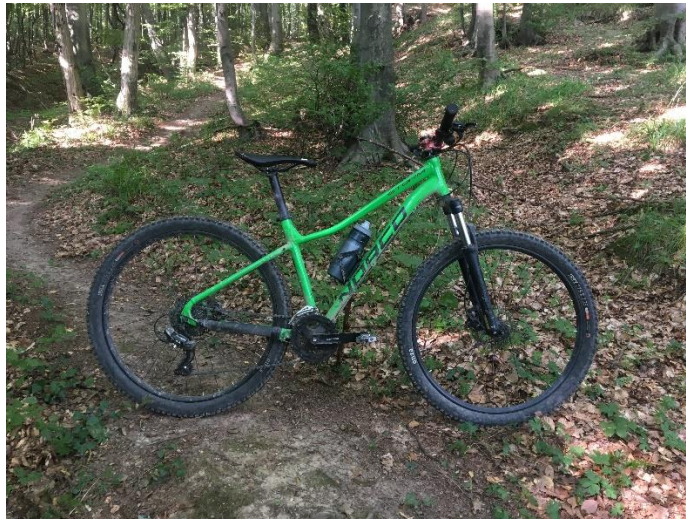
Slika 2. Cross Country (XC) bicikl (autorski rad)

Cross Country- jedina disciplina koja je dio Ljetnih olimpijskih igara. Karakterizira ju vožnja po jednostavnim do umjereno tehnički zahtjevnim stazama s puno uzbrdica i nizbrdica. Naglasak je na brzini i iznimnoj snazi penjanja što zahtjeva visoku tjelesnu spremnost. Udaljenost ruta varira između nekoliko kilometara pa preko 25 i više. Konstrukcija bicikla vidi se na Slici 2 (Rog-Joma, 2018).