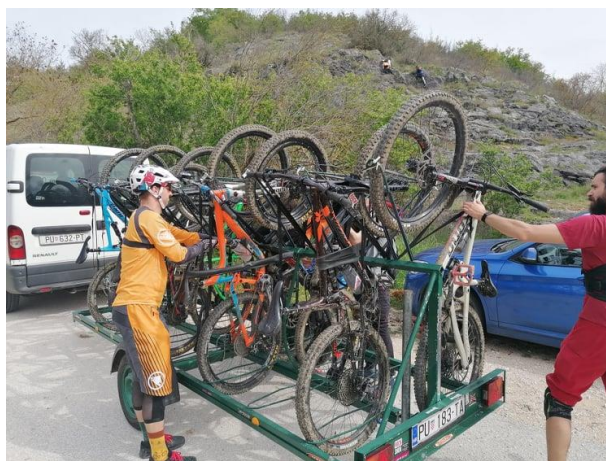
Slika 7. Shuttle - organizirani prijevoz do početka staza za spust

Barber (2015) navodi da: „U SAD-u (a) brdski biciklisti uzimaju dva MTB godišnja odmora na godinu; (b) sa sobom uzimaju bicikle na dva dodatna izleta svake godine; (c) 62% brdskih biciklista putuje da iskušaju nove staze, s prosjekom od 566 proputovanih milja (oko 910 kilometara); (d) brdski biciklisti na godišnjim odmorima prosječno potroše 382 dolara (oko 2400 kuna) i (e) više od polovine MTB izleta traje dva dana ili manje. Top destinacija u SAD-u je Moab u Utah-i.“ Moab u saveznoj državi Utah-i nudi veliku raznolikost brdsko-biciklističkih staza za bicikliste svih razina. Od početnika koji traže sceničnu vožnju kroz predivne kanjone i planinske vrhove pa do iskusnih vozača koji traže nove izazove. Infrastruktura se sastoji od kilometara posebno uređenih staza namijenjenih isključivo biciklistima. Variraju od cross country staza, enduro staza pa do downhill staza. Sve staze koncentrirane su na jednom užem području što pridonosi tome da biciklisti ostaju više dana u istom mjestu što donosi veće dobitke od akomodacije te gastro ponude. Po uzoru na skijanje, brojni biciklisti više uživaju u samom spustu, nego penjaju. Trail centar u Moabu nema izgrađenu žičaru zato organizira tzv. shuttle. Pojam shuttle odnosi se na transport biciklista na početke staza za spuštanje motoriziranim vozilima (Discover Moab, n.d). Slika 7 prikazuje jedan oblik tzv. shuttla.