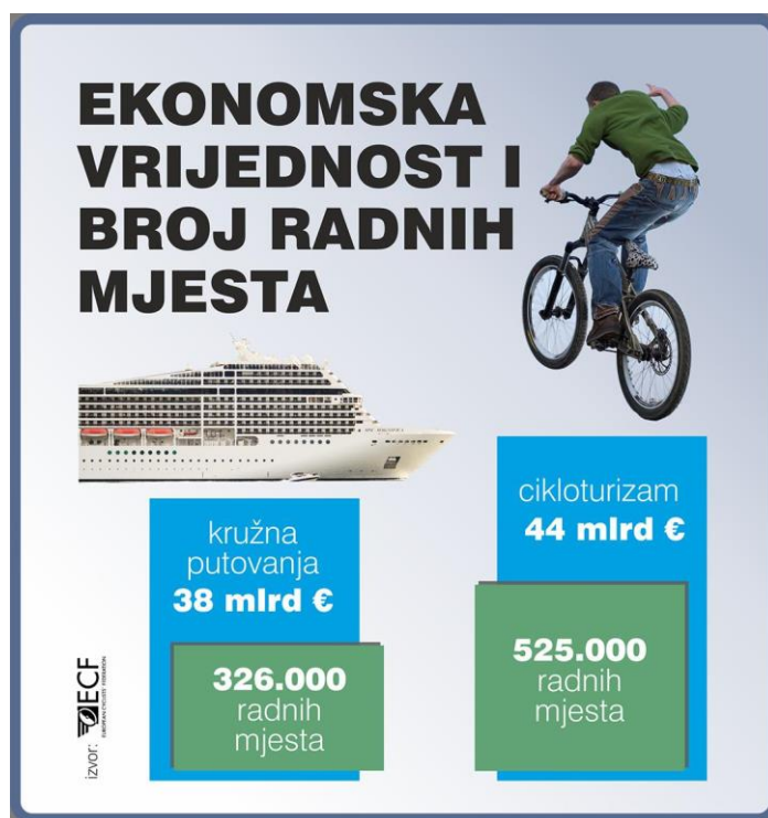
Slika 9. Ekonomska vrijednost i broj radnih mjesta (ECF, n.d.)

Svi navedeni bike parkovi/trail centri osim infrastrukture staza nude i mogućnost iznajmljivanja bicikala i opreme te smještaj i ponudu hrane, pića i noćnog života. Bez smještaja i popratnih sadržaja turistička ponuda nije cjelovita te u manjoj mjeri garantira uspjeh i isplativost (Schlemmer, 2019). O isplativosti cikloturizma u Europskoj uniji govori Slika 5.