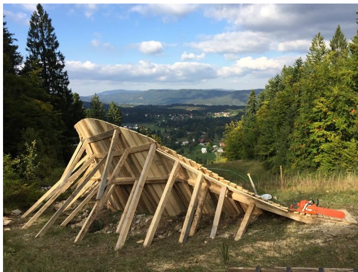
Slika 12. Wall-ride u Tršću (Bike Park Tršće, n.d.)

Potencijalno budući Bike Park Tršće (n.d.) također predstavlja idejni projekt: „Markacija i uređenje novih biciklističkih staza sa elementima atraktivnim za sportaše, ali i za turiste korisnike ovog oblika sportske aktivnosti. Uređene staze iskoristile bi se u organizaciji biciklističkih kampova, natjecanja i manifestacija kroz cijelu godinu. Planirani start dionica je iz centra Tršća, mjesta kod Čabra u Gorskom kotaru. Dionice počinju usponom koji vodi do mjesta gdje počinje spust. Staze za spust uređene su specifično za discipline enduro i downhill koje su najatraktivnije discipline brdskog biciklizma. Iako su staze tehnički zahtjevnije, nude mogućnost prolaska klasičnim brdskim biciklom – na stazi postoje putevi koji obilaze zahtjevnije elemente (poput elementa na Slici 12), čime se osigurava siguran spust. Uz to su na stazama implementirani i manje zahtjevni elementi koji početnicima omogućavaju napredak u svladavanju zapreka.“