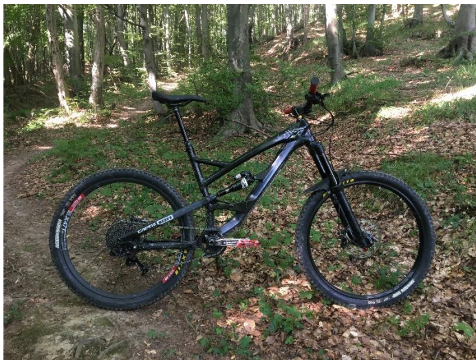
Slika 3. Enduro bicikl (autorski rad)

Downhill (spust) - oblik biciklizma vrlo sličan „enduro“ biciklizmu s nekoliko ključnih razlika. Staze na kojima se provodi spust ekstremnije su i zahtjevnije s više prepreka i umjetno postavljenih skokova. Uz to, dolazak na početak staze odvija se motoriziranim prijevozom, bilo automobilima ili žičarom. Dakle cilj je u što kraćem vremenu spustiti se niz stazu. Konstrukcija downhill bicikla vidi se na Slici 4 (Rog-Joma, 2018).