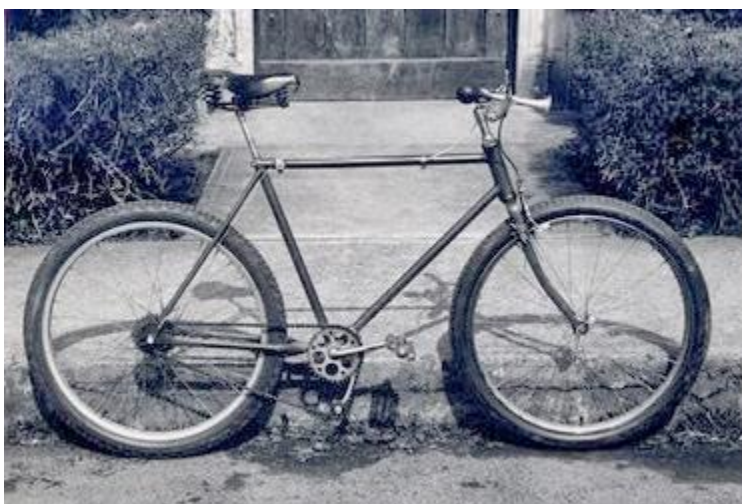
Slika 1. Bicikl iz vremena začetka brdskog biciklizma

Popularnost ove grane biciklizma postajala je sve veća pa je i pozornost proizvođača dijelova rasla. Sukladno tome pojavili su se dijelovi namijenjeni brdskim biciklima što je pokrenulo novu industrijsku granu. Trenutno je prodaja brdskih bicikala pet puta veća od cestovnih. Od 1970-ih, kada je brdski bicikl izgledao kao na Slici 1, situacija se mijenjala pa se danas brdski bicikl visoke kvalitete s dvostrukom suspenzijom, disk-kočnicama i laganim, ali čvrstim okvirima, može kupiti relativno jeftinu u odnosu na cestovne bicikle. Razlika između rekreativnih i profesionalnih vozača toliko se povećala što je uvjetovalo izradu sustava za licenciranje. U budućnosti će daljnja specijalizacija sigurno unaprijediti rezultate vrhunskih vozača. Navedeno će potaknuti razvoj industrije te poboljšanje dijelova i opreme za široku potrošnju (S. Mills, i H. Mills, 2002).