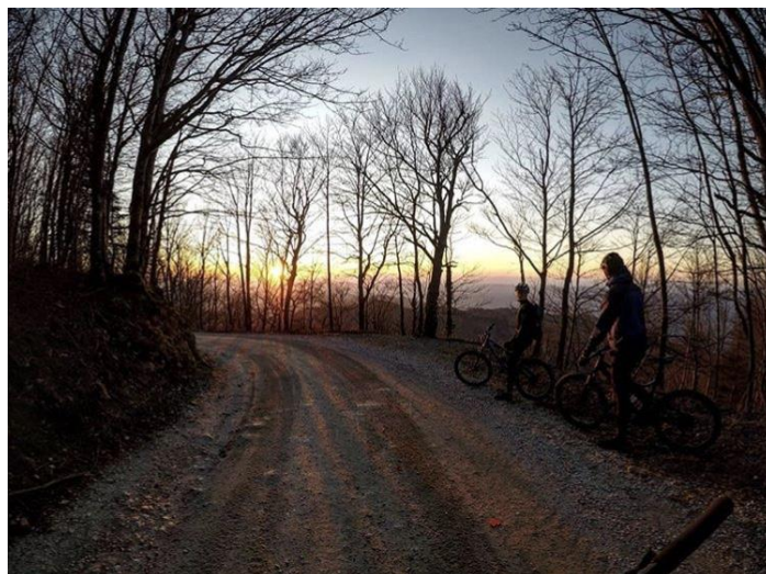
Slika 5. Zimsko predvečerje na Ivanščici

Razlozi zašto se ljudi bave brdskim biciklizmom su razni. Jedni od razloga su oni koje brdski biciklizam dijeli s ostalim aktivnostima koje se provode u prirodi. Tako na primjer svi oblici brdskog biciklizma nude zadovoljavanje avanturističkog duha, uživanje u krajolicima, druženje s osobama istih razmišljanja i afiniteta (Elkington i Stebbins, 2014) što je dočarano Slikama 5 i 6. Uz to je i vid tjelesne aktivnosti što u ukupnosti s prethodno navedenim razlozima ljudima nudi “bijeg” od svakodnevnog života, služi im kao alat za otpuštanje stresa te u isto vrijeme pozitivno utječe na njihovo psihofizičko zdravlje (Pretty et al., 2007).