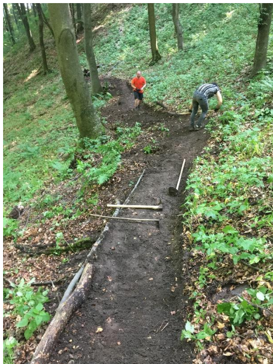
Slika 10. Radna akcija (autorski rad)

Na Slici 10 prikazana je radna akcija koja dočarava trud koji treba biti uložen u izgradnji staza, a na Slici 11 rezultat nerazumijevanja i nepoštivanja pojedinaca unatoč potpisanoj suglasnosti o mogućnosti prolaska biciklističke staze kroz privatni posjed.