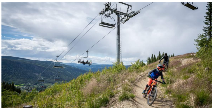
Slika 8. Skijaške staze ljeti se pretvaraju u biciklističke staze (Visit Norway, 2021)

Sličnu ponudu nude i europske države, a neke od najpoznatijih destinacija za brdske bicikliste su talijanski Livigno, francuski Morzine, švedski Åre itd. (Schlüchter, 2019). Najpoznatiji bike park/trail centar u susjedstvu RH je slovensko Pohorje. Kako izgledaju skijališta koja tijekom ljeta nude sadržaje za brdske bicikliste prikazuje Slika 8.