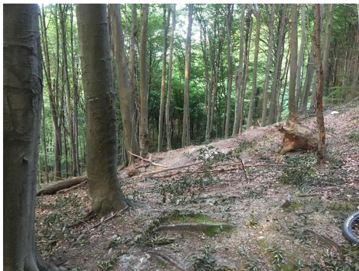
Slika 11. Porušeno drveće i granje na biciklističkoj stazi