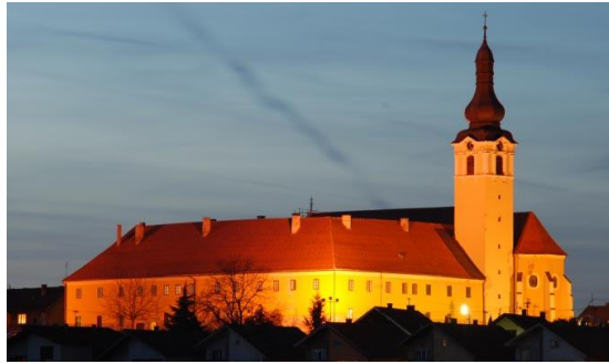
Slika 4. Crkva Sv. Antuna Padovanskog

stilu. Tijekom 18. i 19. stoljeća Samostan u Našicama bio je bitno središte pastoralnog, umjetničkog i prosvjetnog života Hrvatske. Današnji prostor crkve prava je riznica vrijednih umjetnina. Crkva ima sedam oltara, vrijedne barokne orgulje, dvije kripte, bogato ukrašen oratorij, mnoštvo vrijednih baroknih skulptura i slika, te propovjedaonicu. Unutrašnjost crkve oslikana je freskama. U sklopu samostana nalazi se knjižnica sa deset inkunabula i drugim vrijednim knjigama, te stalna izložba „Blago našičkih franjevaca“.