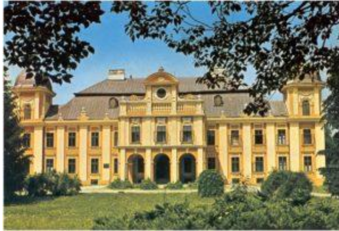
Slika 2. Dvorac Teodora Pejačevića