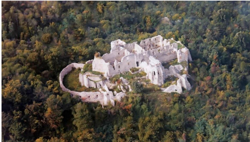
Slika 7. Ružica grad

ruža. Ružica grad nalazi se na visini od 378 metara, a udaljen je 2-3 kilometra od centra grada Orahovice (slika 7). Do samog dvorca izgrađena je planinarska staza, a polazak je s Orahovačkog jezera. Orahovačko jezero nosi naziv „slavonsko more“, te je odličan primjer kako se s malo truda može napraviti puno za turizam u Slavoniji, ali o tome više u nastavku rada.