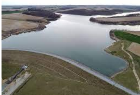
Slika 11. Jezero Koritnjak

Jedno od najmlađih slavonskih jezera, svakako je umjetno akumulacijsko jezero Koritnjak u Bučju Gorjanskom (slika 11). Brana Koritnjak sagrađena je 2012. godine prvenstveno s preventivnom namjerom obrane od poplava, ali i za potrebe navodnjavanja, sporta i rekreacije. Jezero ima površinu od 100 hektara, te na pojedinim dijelovima dubinu od 15 metara. Jezero je smješteno u sredini slavonskih poljoprivrednih polja, tako da ga okružuju brojne oranice, polja i livade. Jezero obiluje slatkovodnom ribom, te je pogodno za ribolov. Na jezeru nema ponude hrane i pića, niti sanitarnog čvora. Postoji divlja staza koja okružuje jezero, ali nažalost još ne postoji uređena staza za pješaćenje, trčanje ili biciklizam. Uz minimalna ulaganja lokalne samouprave, Jezero Koritnjak zasigurno ima potencijal za sportsko-rekreacijske i ribolovne sadržaje.