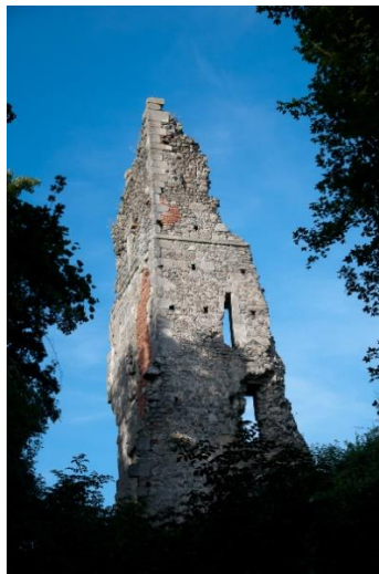
Slika 6. Bedemgrad

srednjovjekovni utvrđeni grad na Krndiji iznad sela Gradca. Nalazi se na visini od 407 metara, na nepristupačnoj vulkanskoj hridini. Južno od Bedemgrada nalazi se antička prometnica koja je spajala Incero, Stravianis i Mursu, odnosno, Požegu, Našice i Osijek. Prvi vlasnici bili su ugarski plemići Aba-Khan, dok se kao kasniji gospodari spominju slavonske plemićke obitelji Lackovići, Gorjanski i Iločki. Ispod ruševina nekad impresivnog grada prolazi Našički planinarski put i Našička geološka staza. U neposrednoj blizini Bedemgrada uređeno je izletišta sa stolovima, klupama i ognjištem. Uz uređenu stazu i izletišta, osigurani su materijalni uvjeti za posjetu turista.