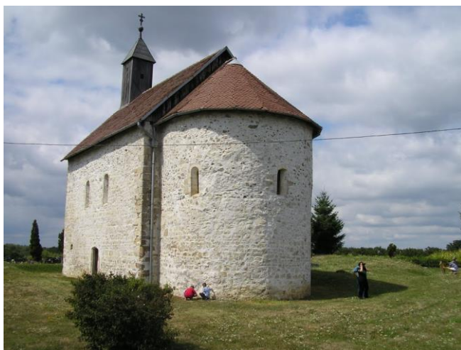
Slika 5. Crkva Sv. Antuna Padovanskog