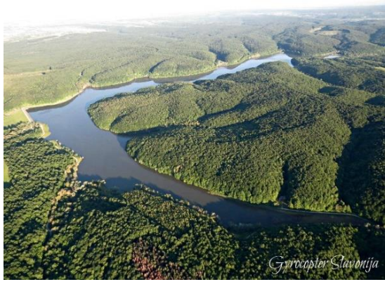
Slika 10. Jezero Borovik