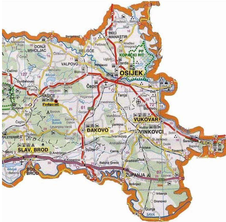
Slika 1. Položaj grada Našica na karti

Nekche, Naschitz, Vesice i Nesice. Zemljopisni položaj i očuvana prirodna ljepota našičkoj kraja u kojem se poznata slavonska ravnica spaja sa Krndijom i Papukom uvelike je doprinijelo razvoju ribolovnog i lovnog turizma.