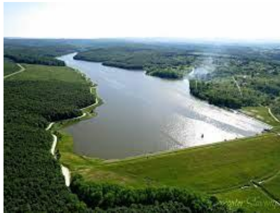
Slika 8. Jezero Lapovac

Rijetko se koji grad može pohvaliti da u neposrednoj blizini središnjeg gradskog trga ima jezero ove veličine. Na nešto manje od 3 kilometra od centra grada nalazi se umjetno akumulacijsko jezero Lapovac (slika 8). Nastalo je 90-ih godina izgradnjom brane kako bi se spriječile česte poplave u nizvodnim naseljima. Dugačko je 2.63 kilometra, te široko 250 metara. Osim što služi za ribolov i kupanje, ovo je odlično mjesto i za izlete u prirodu. Oko cijelog jezera napravljena je pješačka staza koja se u nekim dijelovima spaja i sa stazom za brdski biciklizam. Jezero Lapovac već je nekoliko puta bilo mjesto održavanja sportskih natjecanja od kojih treba izdvojiti europsko prvenstvo u kajaku, te mnogobrojna međunarodna natjecanja u sportskom ribolovu. Na jezeru ne postoji ponuda sportske rekreacije, sanitarni čvor, niti ugostiteljska ponuda.