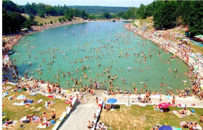
Slika 9. Orahovačko jezero

raznih manifestacija. Prvosvibanjski piknik, Ferragosto jam, Papuk extreme challenge, Sajam vina i kulena, Vinski maraton, akustične i ljetne večeri samo su dio širokog repertoara. Ovo je idealan primjer kako maksimalno iskoristiti potencijale umjetnih jezera našičkog kraja.