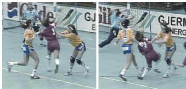
Slika 3. Dva najčešća mehanizma nastanka ozljede koljena u rukometu (prema: Olsen, 2004)

Prema mehanizmu nastanka ozljeda koljena, važno je provođenje preventivnih vježbi koje povećavaju aktivnost medijalnih mišića tetive, kako bi se uskladile s vanjskim momentima rotacije koljena prema van i momentima valgusa koljena, te povećale aktivnost vanjskih rotatora kuka u skladu s vanjskim momentom rotacije kuka prema unutra.