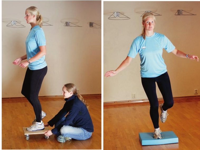
Slika 4. Neuromišićni trening na nestabilnim površinama (Laver i sur., 2018)