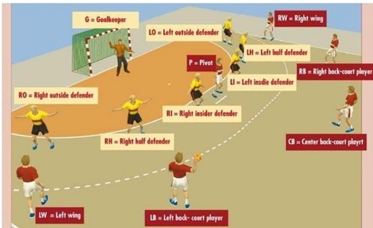
Slika 1. Pozicije u rukometu

Karakterističan morfološki profil primjeren vrhunskim rukometašima je: atletska građa tijela, naglašena uzdužna dimenzija skeleta, proporcionalni omjer koštanog sustava i mišićne mase te smanjeno masno tkivo (Srhoj i sur., 2002). Takav morfološki profil podržava rukometaše da učinkovito izvode tehničko-taktičke strukture igre u stvarnim natjecateljskim uvjetima. Isto tako, postavlja racionalne energetske zahtjeve za kretanje tjelesne mase pojedinog igrača.