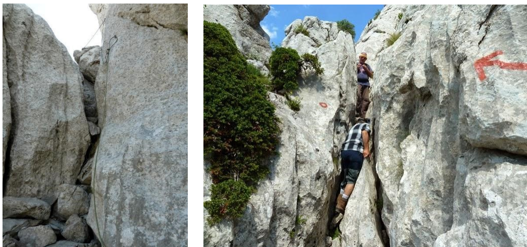
Slika 4. Južni Velebit, Tulove grede, zahtjevan put osiguran sajlama

putovi su zahtjevni planinarski putovi koji su osigurani sajlama, čeličnom užadi, ljestvama i klinovima (slika 4).