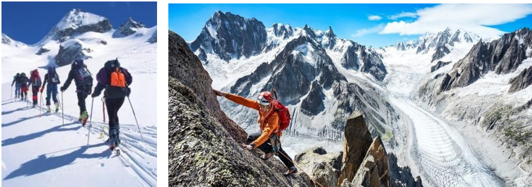
Slika 8. Turno skijanje (lijevo) i alpsko penjanje (desno)

Penjanje je vještina kretanja po strmim terenima pri čemu se koriste ruke i noge. Sportsko penjanje možemo podijeliti na penjanje po prirodnim i umjetnim stijenama. Kao i kod alpinizma i ovdje se koristi oprema za penjanje, ali ona ne služi kao pomoć već je samo osiguranje penjaču u slučaju pada. Osnovna razlika između alpinizma i sportskog penjanja je u tome što alpinisti sami sebi osiguravaju put, dok se penjači penju po već uređenim putevima (Stanković i Puletić, 2005). Turno skijanje je specifičan vid skijanja koje je, najjednostavnije rečeno, kombinacija alpskog skijanja i skijaškog trčanja. Jedinствена skijaška oprema (skije s vezovima, skijaške cipele) omogućava i hodanje (po ravnom terenu i usponu uz brijeg) i skijanje (spuštanje) po neuređenim snježnim površinama.