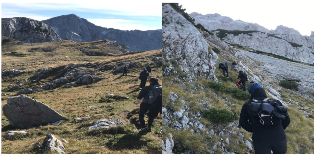
Slika 5. Pješaćenje (lijevo) i planinarenje (desno)

Pješaćenje se odnosi na sposobnost kretanja po raznim planinskim ravnicama koje ne sadrže velike uspone, već uključuje manje zahtjevne nagibe. Pješaćenje ne podrazumijeva uspone na planinske vrhove nego prolaženje ispod njih. Ovaj vid kretanja u planini ne zahtjeva posebne vještine. Planinarenje je vještina kretanja u planini koja podrazumijeva savladavanje strmina ali bez korištenja ruku. Ljetno planinarenje je planinarenje po terenima koji nisu prekriveni snijegom i ledom, dok se zimsko planinarenje odnosi na kretanje po terenima koji su prekriveni snijegom i ledom.