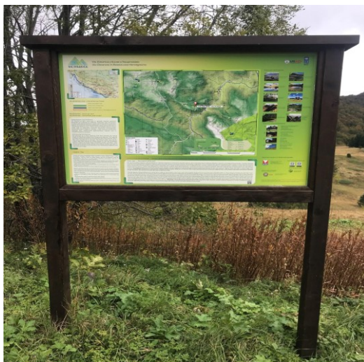
Slika 3. Poučna staza na Magliču

Planinarski putovi su svojevrsni produžetak prometne infrastrukture u planini. Osim klasičnih planinarskih putova, postoje i tematski putovi (biciklistički, gljivarski, hodočasnički i drugi) (Čaplar, 2012). Poučni putovi (slika 3) su staze na kojima su postavljene informativne ploče o prirodnim zanimljivostima vezanima za područje na kojem se planinari.